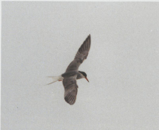
22-23 Common Tern / Visdief Sterna hirundo , Eemshaven, Groningen, Netherlands, June 1995

Klaus Malling Olsen, Gartnerivej 3,1, 2100 København Ø, Denmark