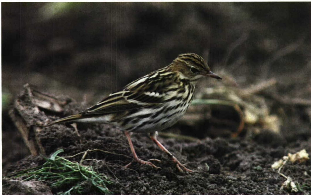
303 Pechora Pipit / Petsjorapieper Anthus gustavi , Fair Isle, Shetland, Scotland, October 1997