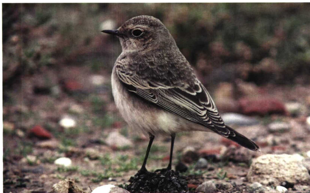
304 Pied Wheatear / Bonte Tapuit Oenanthe pleschanka , Spurn, Yorkshire, England, October 1997