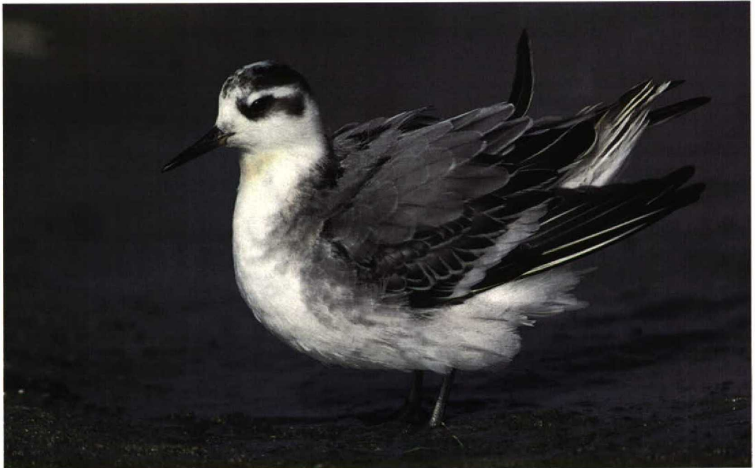
313 Rosse Franjepoot / Grey Phalarope Phalaropus fulicaria , Kennemermeer, IJmuiden, Noord-Holland, 6 oktober 1997 (Arnoud B van den Berg)