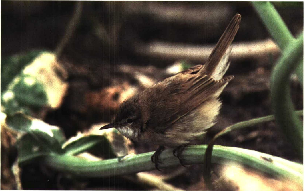
310 Paddyfield Warbler / Veldrietzanger Acrocephalus agricola , Fair Isle, Shetland, Scotland, October 1997