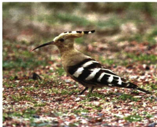
314 Witbandkruisbek / Two-barred Crossbill Loxia leucoptera , mannetje, Oranje-Nassau's Oord, Wageningen, Gelderland, 8 november 1997 315 Pallas' Boszanger / Pallas's Leaf Warbler Phylloscopus proregulus , Texel, Noord-Holland, oktober 1997 316 Lachmeeuw / Laughing Gull Larus atricilla , Groningen, Groningen, 4 oktober 1997 317 Roodkeelpieper / Red-throated Pipit Anthus cervinus , Hoorn, Terschelling, Friesland, 4 november 1997 318 Groenlandse Kolgans / Greenland White-fronted Goose Anser albifrons flavirostris , Workum, Friesland, 9 november 1997 319 Hop / Hoopoe Upupa epops , Texel, Noord-Holland, oktober 1997