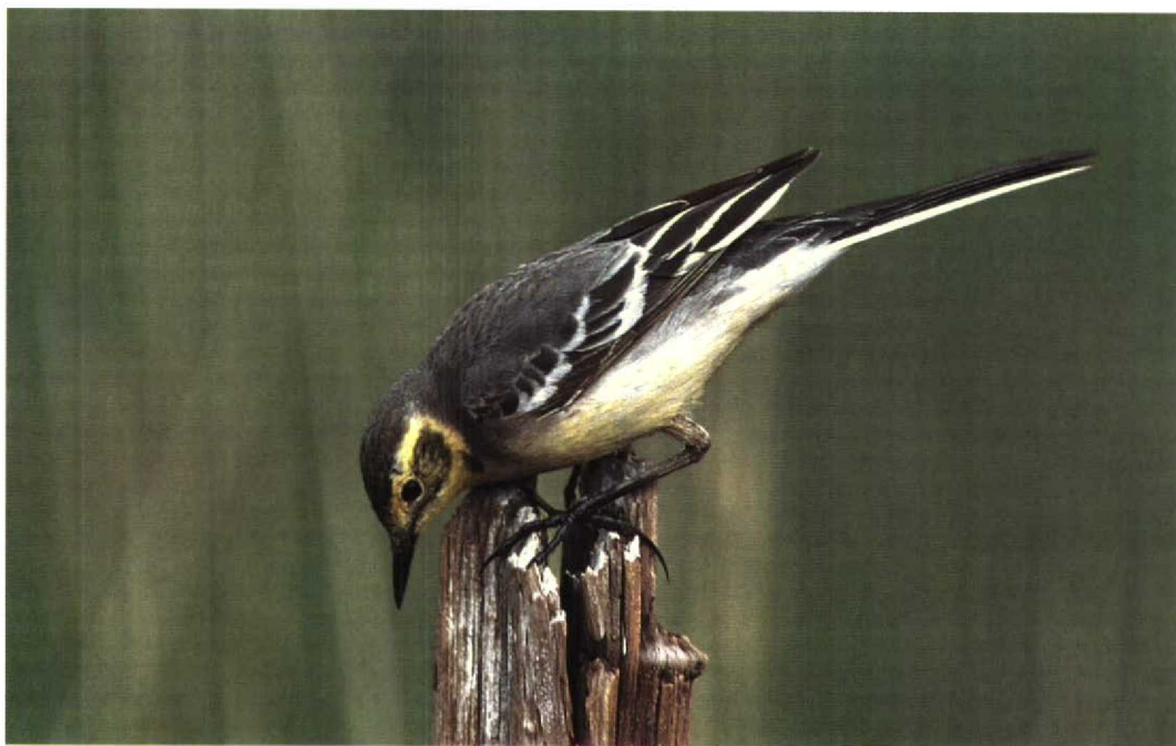
299 Citrine Wagtail / Citroenkwikstaart Motacilla citreola , female, summer plumage, Paimionlahti, Paimio, Finland, June 1997