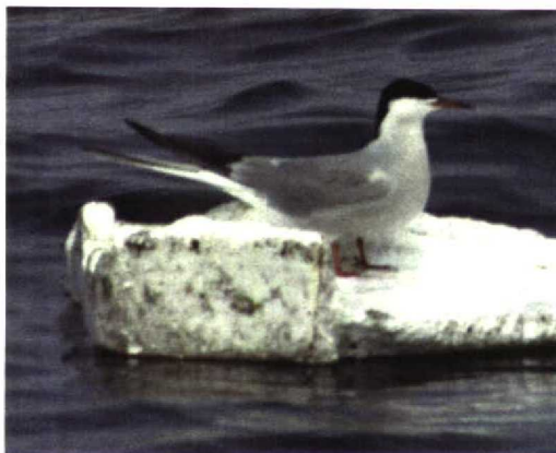
294 Common Tern / Visdief Sterna hirundo tibetana , Mirs Bay, Hong Kong, China, 24 April 1993

In breeding plumage, S h tibetana always shows a dark wash to the belly and breast which can extend onto the throat, frequently producing a thin white line, or whisker, between the black