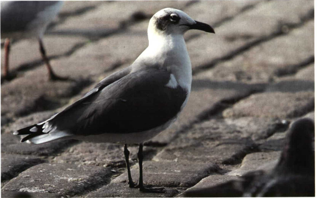
312 Lachmeeuw / Laughing Gull Larus atricilla , Groningen, Groningen, 6 oktober 1997