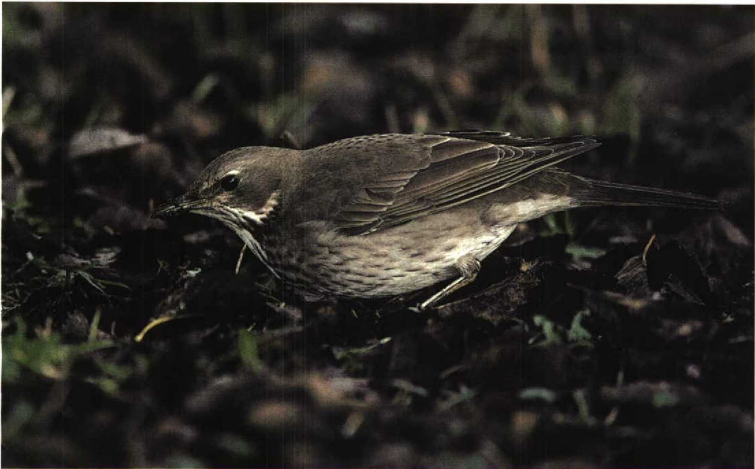
281 Zwartkeellijster / Black-throated Thrush Turdus ruficollis atrogularis , Den Helder, Noord-Holland, 8 januari 1996

Zwartkeellijster broedt in Centraal-Azië: in Rusland, vanaf de Oeral in het westen (net binnen het West-Palearctische gebied) tot Centraal-Siberië, zuidelijk tot de Altai, en bewoont een breed spectrum van taigahabitats (Rogacheva 1992). Roodkeellijster broedt meer zuidoostelijk, van de Altai tot aan de oostzijde van het Baikalmeer (Transbaykalia), noordelijk tot c 60° N en zuidelijk tot in Noord-China. Het broedbiotoop bestaat uit spaarzaam begroeide bergbossen en mosachtige toendra (Cramp 1988). Zwartkeel- en Roodkeellijster komen samen voor in grote delen