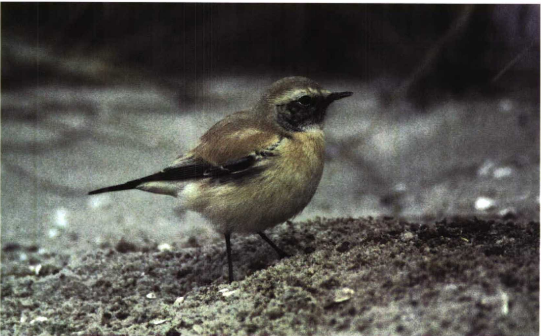
311 Desert Wheatear / Woestijntapuit Oenanthe deserti , Jastarnia, Hel Peninsula, Poland, 23 October 1997 (Arkadiusz Sikora)