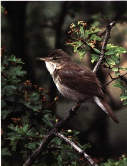
283-285 Struikrietzanger / Blyth's Reed Warbler Acrocephalus dumetorum , Walem, Limburg, 24 juni 1996 (Hans Gebuis)