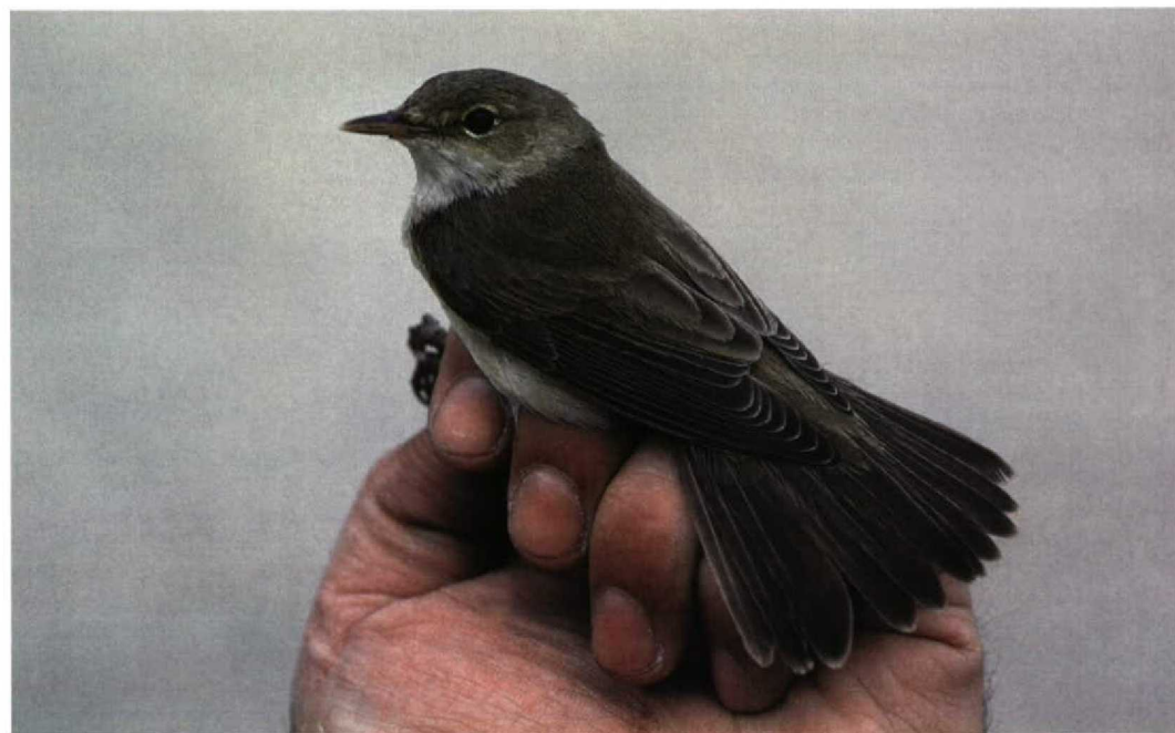
302 Caspian Reed Warbler / Kaspische Karekiet Acrocephalus fuscus , Jubail, Saudi Arabia, 16 April 1991 (Arnoud B van den Berg)