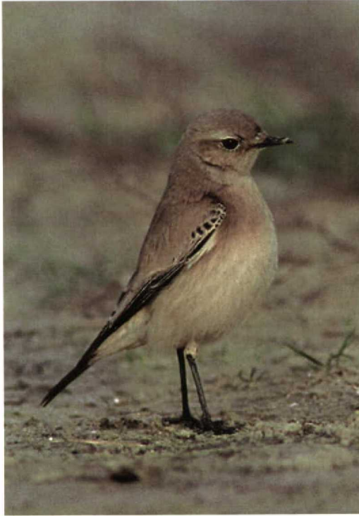
323 Woestijntapuit / Desert Wheatear Oenanthe deserti , eerste-winter vrouwtje, Verdronken Land van Saeflinge, Zeeland, november 1997