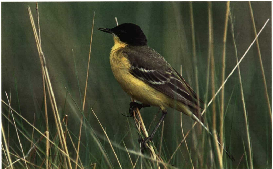
298 Black-headed Wagtail / Balkankwikstaart Motacilla flava feldegg , male, summer plumage, Paimionlahti, Paimio, Finland, June 1997