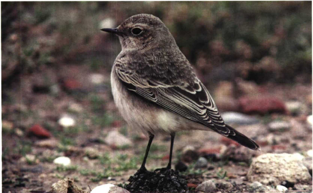
304 Pied Wheatear / Bonte Tapuit Oenanthe pleschanka , Spurn, Yorkshire, England, October 1997