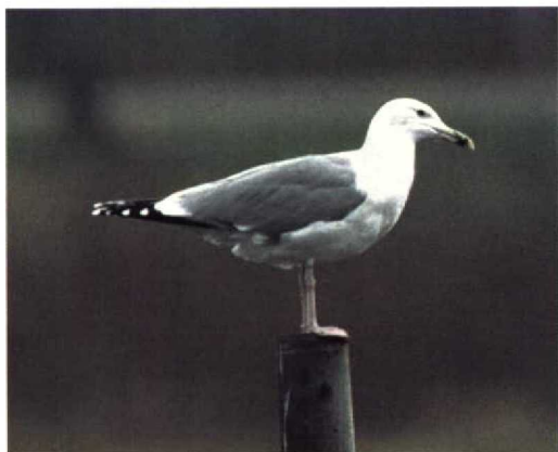
326 Pontische Geelpootmeeuw / Pontic Yellow-legged Gull Larus cachinnans cachinnans , Oost-Maarland, Limburg, 6 december 1997