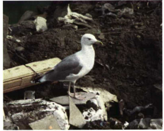
291 Pontische Geelpootmeeuw / Pontic Yellow-legged Gull Larus cachinnans cachinnans (rechts) en Zilvermeeuw / Herring Gull L. argentatus , Zutphen, Gelderland, 4 oktober 1988 (Geert Groot Koerkamp) 292-293 Pontische Geelpootmeeuw / Pontic Yellow-legged Gull Larus cachinnans cachinnans , Zutphen, Gelderland, 4 oktober 1988 (Geert Groot Koerkamp)

Harris et al 1996, Garner 1997, Garner & Quinn 1997, Garner et al 1997, Klein & Buchheim 1997, Klein & Gruber 1997, Liebers & Dierschke 1997). Most important characters were the almost unstreaked all-white head (indicating Pontic or Mediterranean Yellow-legged Gull L. c. michahellis ); grey upperparts colour as in Herring Gull L. argentatus (darker in Mediterranean); wing tips with more white and less black than in Mediterranean; long, slender and parallel-sided bill (heavier with stronger gonydeal angle in Mediterranean); pale yellowish bill with red gonydeal spot and black subterminal marking, mostly on lower mandible (deeper yellow and normally without black in Mediterranean); dark iris (variable in Pontic but often dark, normally pale in Mediterranean); pale yellowish-flesh legs with pinkish-flesh feet (deeper yellow in Mediterranean); and general proportions with sloping forehead, flat belly and very long wings, giving the bird