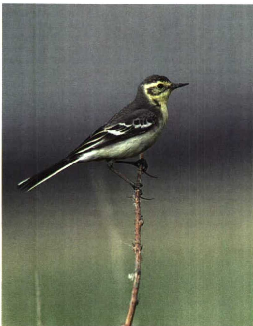
300 Citrine Wagtail / Citroenkwikstaart Motacilla citreola , female, summer plumage, Paimionlahti, Paimio, Finland, June 1997

Grey-headed and Citrine Wagtails. The successful mixed breeding reported here was the first record of hybridization between Black-headed and Citrine Wagtails for Fenno-Scandia. Elsewhere, hybridization between Yellow and Citrine Wagtails may occur more frequently. Possible hybrids between these taxa were recorded in Israel during migration (Shirihai 1990); their geographical origin is, however, unknown. Black-headed and Citrine Wagtails are both rare in Finland, with seven and 94 accepted records, respectively, up to and including 1995 (Nikander et al 1996).