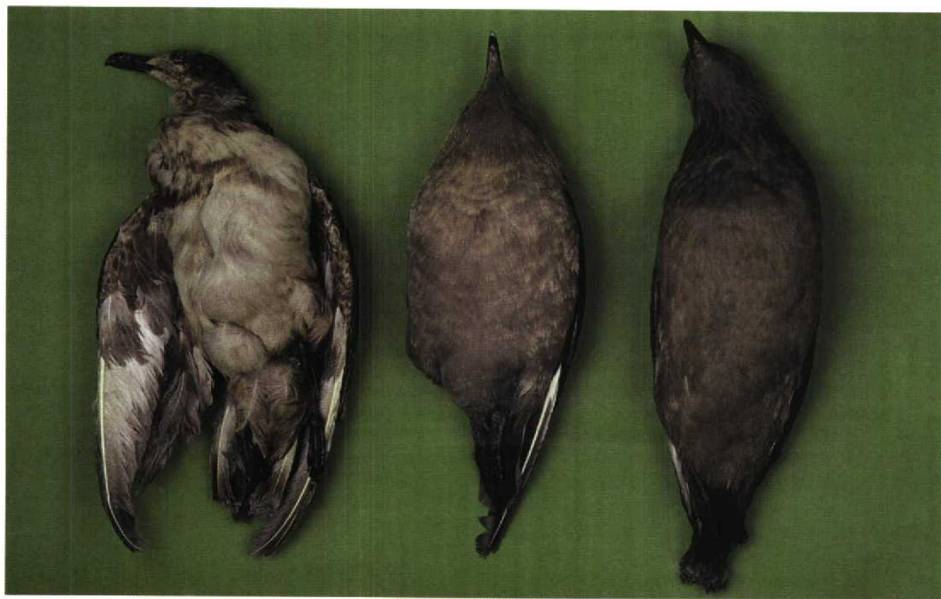
295-296 Gebleekte eerstejaars Grote Jager / bleached first-year Great Skua, Catharacta skua , Hompelvoet, Grevelingen, Zuid-Holland, 24 mei 1990 (ZMA 37386) (links), Zuidpooljager / South Polar Skua C. maccormicki , adult (ZMA 37000) (midden) en Grote Jager / Great Skua, juveniel (ZMA 2556) (rechts) (Louis van der Laan)