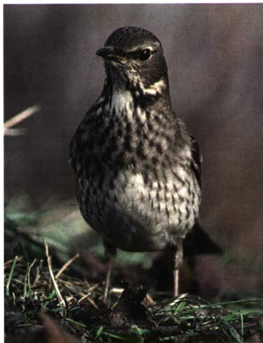
278 Zwartkeellijster / Black-throated Thrush Turdus ruficollis atrogularis , Den Helder, Noord-Holland, 12 januari 1996