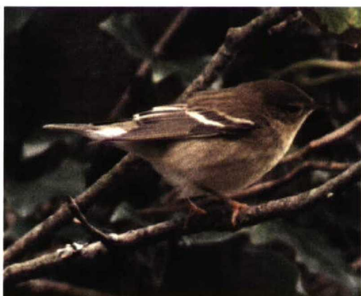
305 Hybrid Barn Swallow x House Martin / hybride Boerenzwaluw x Huiszwaluw Hirundo rustica x Delichon urbica , Vrhnika, Slovenia, 4 September 1997 ( Dare Šere ) 306 Paddyfield Warbler / Veldrietzanger Acrocephalus agricola , Vrhnika, Slovenia, 17 September 1997 ( Dare Šere ) 307 Canvasback / Grote Tafelend Aythya valisineria , Welney, Norfolk, England, December 1997 ( Iain H Leach ) 308 Blackpoll Warbler / Zwartkopzanger Dendroica striata , Tresco, Scilly, England, October 1997 ( Iain H Leach )

northern Greece (9500 individuals were counted here on 1 November and 3840 on 26 October). In southern Italy, an influx of four to five juvenile White Pelicans Pelecanus onocrotalus occurred in the first week of November at the Straits of Messina and Sicily. In Yemen, single Great Bitterns Botaurus stellaris were found at Amria on 8 November and at Marib on 29 November. In Morocco, 105-110 Bald Ibises Geronticus eremita were seen near Tamri on 7 November, including a flock of 95. A Whistling Swan Cygnus columbianus at Veendam, Groningen, and Anloo, Drenthe, from 28 November to at least 3 January constitutes the fifth for the Netherlands; the percentage of yellow on the bill was measured in different ways from photographs (7.8-11.3% on the right side which had slightly more yellow than the left side) and the bird may have been the same as the one accepted for 1986 (cf Dutch Birding 11: 118, 1989) and 1992. Also in the