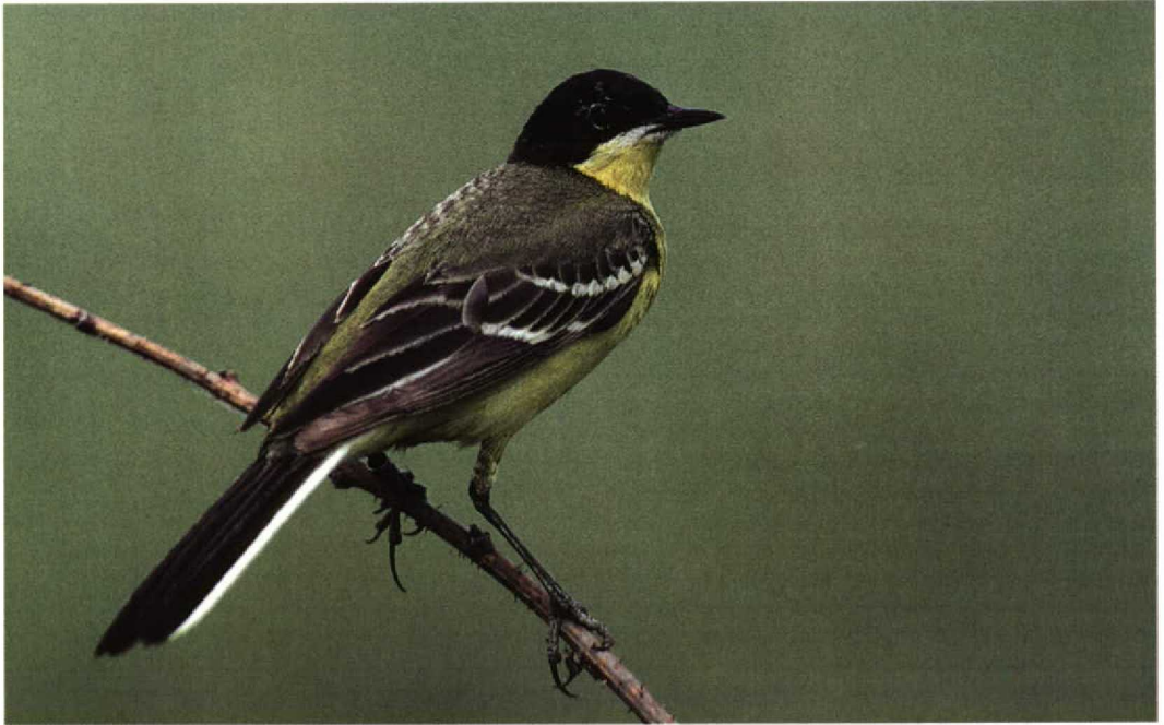
297 Black-headed Wagtail / Balkankwikstaart Motacilla flava feldegg , male, summer plumage, Paimionlahti, Paimio, Finland, June 1997