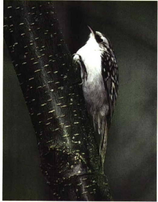
320 Roodsterblauwborst / Red-spotted Bluethroat Luscinia svecica svecica , mannetje, Westkapelle, Zeeland, oktober 1997 321 Taigaboomkruiper / Eurasian Treecreeper Certhia familiaris , Formerummerbos, Terschelling, Friesland, 30 oktober 1997 322 Roze Spreeuw / Rosy Starling Sturnus roseus , juveniel, Anjum, Friesland, 22 november 1997