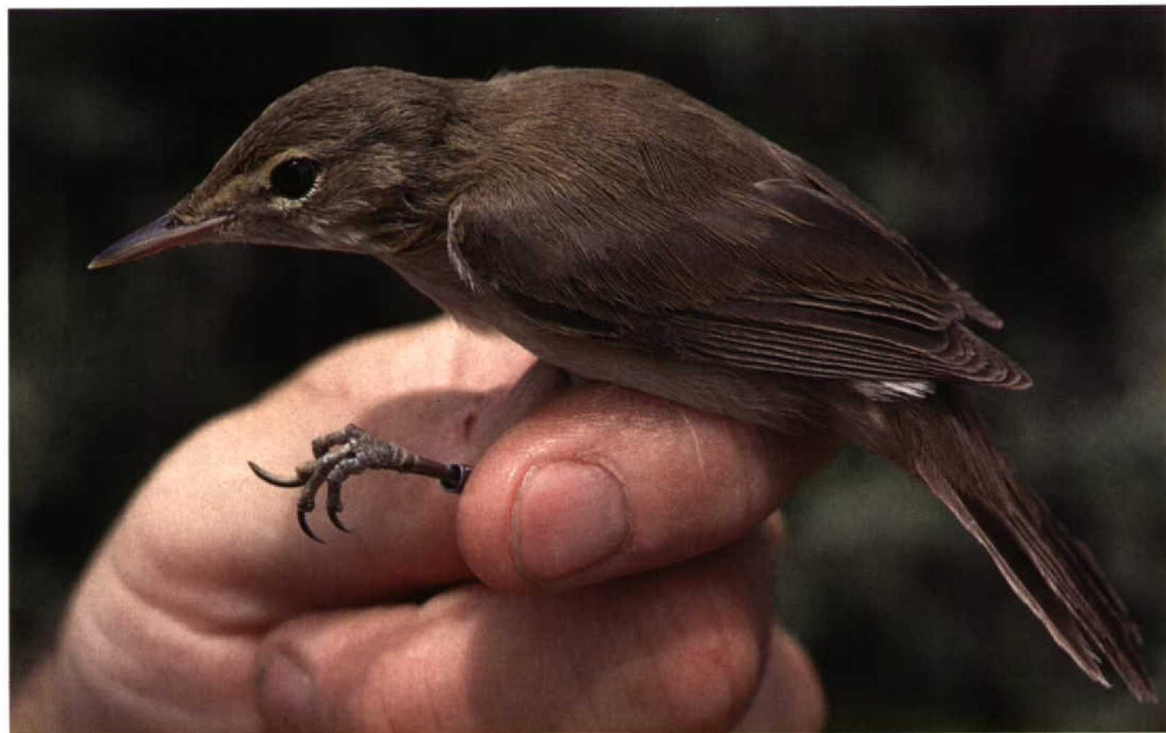
301 Mangrove Reed Warbler / Mangrovekarekiet Acrocephalus avicenniae , Shuqaiq, Asir Province, Saudi Arabia, May 1995 (Peter Symens)