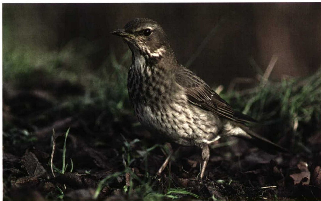
279-280 Zwartkeellijster / Black-throated Thrush Turdus ruficollis atrogularis , Den Helder, Noord-Holland, 19 januari 1996 (René Pop)