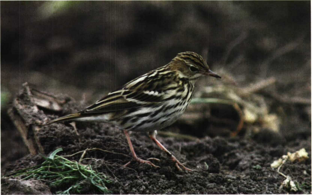
303 Pechora Pipit / Petsjorapieper Anthus gustavi , Fair Isle, Shetland, Scotland, October 1997 (Tim Loseby)