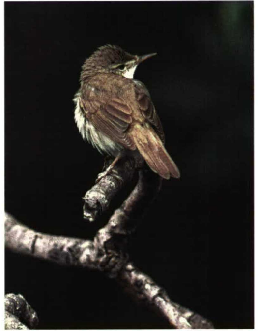
282 Struikrietzanger / Blyth's Reed Warbler Acrocephalus dumetorum , Walem, Limburg, 23 juni 1996