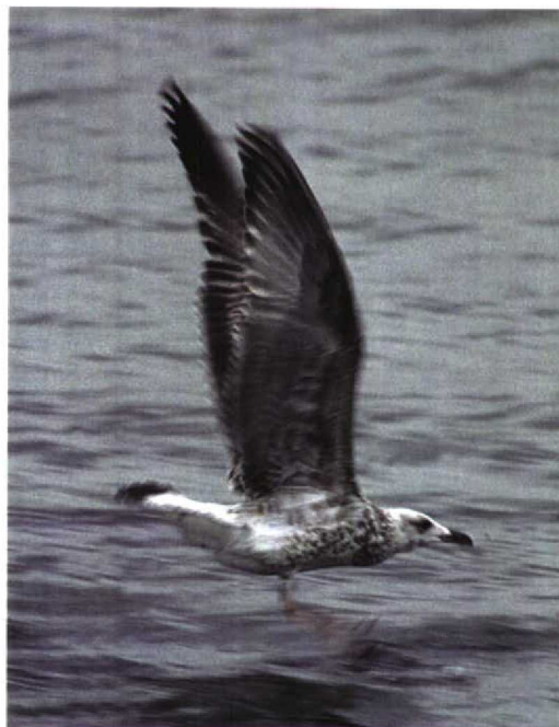
325 Pontische Geelpootmeeuw / Pontic Yellow-legged Gull Larus cachinnans cachinnans , juveniel ruiend naar eerste-winter, Nieuwe Waterweg, Rozenburg, Zuid-Holland, 1 september 1997

of twee volwassen Geelpootmeeuwen van het bewuste type. Nog altijd was er geen 100% zekerheid, al waren de drie genoemde waarnemers het met PK eens dat de vogels kansrijk waren. Het indienen van de gevallen bij de CDNA hield op dat moment, gezien de nog altijd onvolledige aanwijzingen voor determinatie in de literatuur, het risico van atwijzing in. Door de voor detailopnamen te grote afstand (meestal 80 tot 100 m) konden geen zinnvolle foto's worden gemaakt.