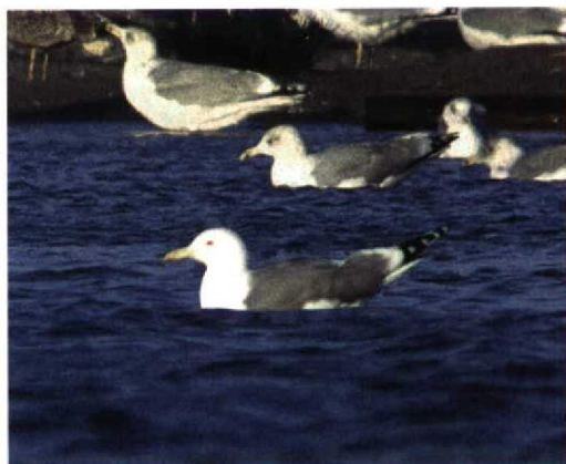
327 Pontische Geelpootmeeuw / Pontic Yellow-legged Gull Larus cachinnans cachinnans , Arcen, Limburg, 18 november 1997 (Arnoud B van den Berg)