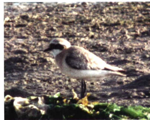
259 American Herring Gull / Amerikaanse Zilvermeeuw Larus argentatus smithsonianus , 100 miles west of Lewis, Western Isles, Scotland, 11 September 1997 (Richard White) 260 Purple Swamp-hen / Purperkoet Porphyrio porphyrio , Sandscale Haws, Cumbria, England, October 1997 (Steve Young/Birdwatch) 261 Least Sandpiper / Kleinste Strandloper Calidris minutilla , Lajes de Pico, Pico, Azores, 3 October 1997 (Willem Steenge) 262 Surf Scoter / Brillzee-eend Melanitta perspicillata , first-winter, Faja dos Cubres, São Jorge, Azores, 9 October 1997 (Willem Steenge) 263-264 Lesser Sand Plover / Mongoolse Plevier Charadrius mongolus , Pagham, Kent, England, August 1997 (Jain H Leach)