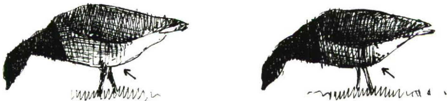
FIGURE 1 Pale-bellied Brent Goose / Witbuikrotgans Branta hrota (left) and Dark-bellied Brent Goose / Rotgans B. bernicla. Note difference in pattern of rearmost belly (indicated by arrow)