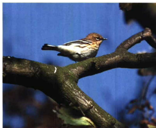
231-232 Mirtezanger / Myrtle Warbler Dendroica coronata , mannetje, Vlieland, Friesland, 13 oktober 1996 233 Mirtezanger / Myrtle Warbler Dendroica coronata , mannetje, Vlieland, Friesland, 13 oktober 1996 234 Mirtezanger / Myrtle Warbler Dendroica coronata , mannetje, Vlieland, Friesland, 14 oktober 1996

wit, borst aan beide zijden met 5-6 rijen zwartbruine V-vormige vlekken; centrum van borst wit. Flank met zwavelgele zweem bij vleugelboeg, helder zwavelgeel onder vleugel; vage zwartbruine vlekken flankstrepen vormend.