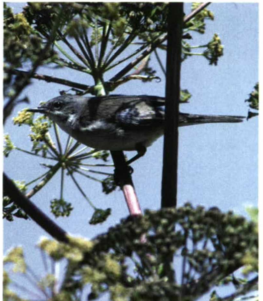
252 Orphean Warbler / Orpheusgrasmus Sylvia hortensis , first-summer female, Lesbos, Greece, May 1995 (Peter de Knijff)