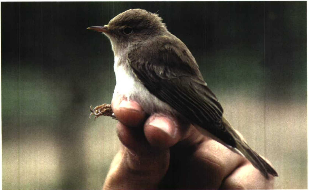
248 Western Bonelli's Warbler / Bergfluitter Phylloscopus bonelli , Illa de Gràcia, Ebro delta, Tarragona, Spain, 4 April 1985 (Ricard Gutiérrez)