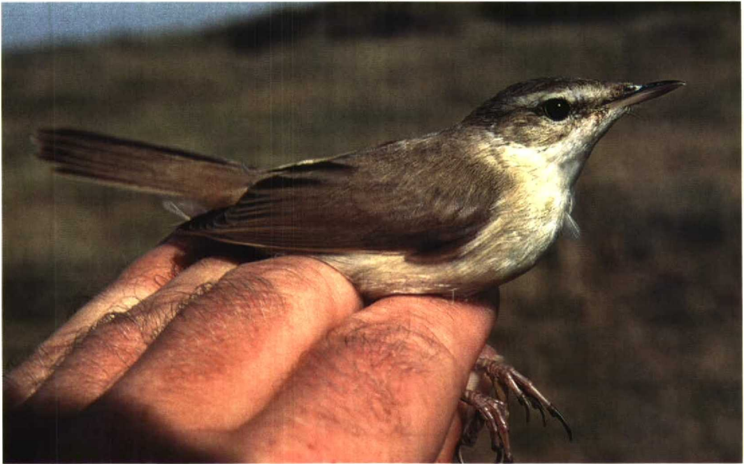
272 Veldrietzanger / Paddyfield Warbler Acrocephalus agricola , Castricum, Noord-Holland, 12 augustus 1997