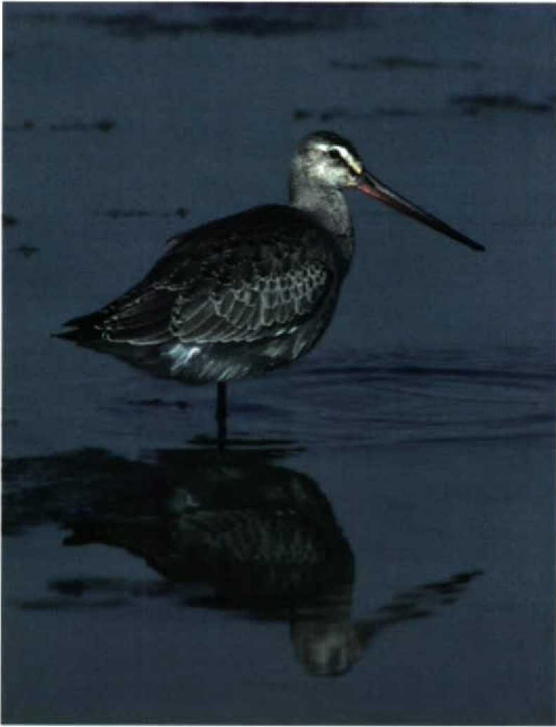
249 Hudsonian Godwit / Rode Grutto Limosa haemastica , juvenile, Cape May Meadows, New Jersey, USA