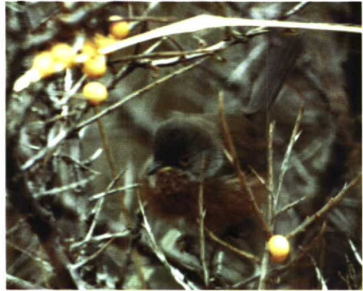
228 Provençaalse Grasmus / Dartford Warbler Sylvia undata , Brielsegatdam, Zuid-Holland, 6 januari 1997 (Jan den Hertog)

kleur van de onderdelen en de duidelijk afgetekende vuilwitte onderbuik en anaalstreek ging het om een mannetje (Cramp 1992). Het onderscheid tussen eerstejaars en adulte vogels is vaak niet of nauwelijks mogelijk (zeker in het veld) maar de wat diffuse vorm van de witte vlekjes op de keel en het bruin op de kop passen beter op een eerstejaars (Cramp 1992).