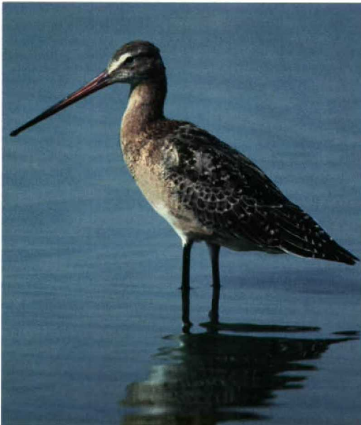
251 Black-tailed Godwit / Grutto Limosa limosa , juvenile, Flevoland, Netherlands, 4 August 1994