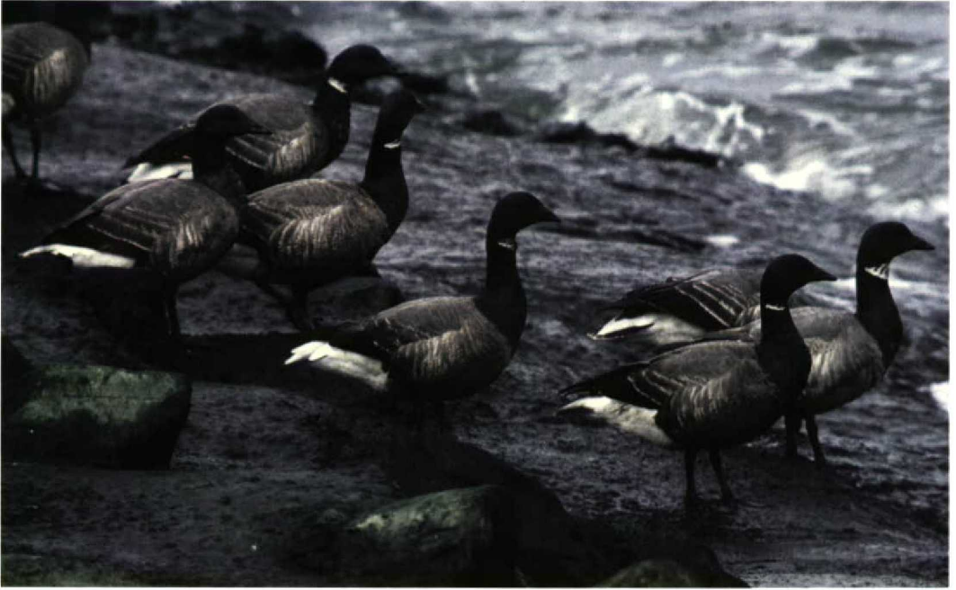
238 Dark-bellied Brent Geese / Rotganzen Branta bernicla , Zuidpier, IJmuiden, Noord-Holland, Netherlands, 26 April 1986