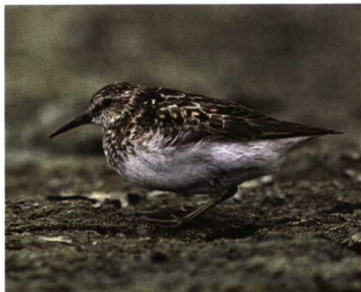
224-225 Kleinste Strandloper / Least Sandpiper Calidris minutilla , adult, Gent-Mendonk/Rodenhuize, Oost-Vlaanderen, België, 13 augustus 1996

de nek volledig gestrekt (herinnerend aan Kemp-haan Philomachus pugnax ). 9 Geluid. De roep van Taigastrandloper is het best te vergelijken met die van Krombekstrandloper C ferruginea , en lijkt niet op die van Kleinste.