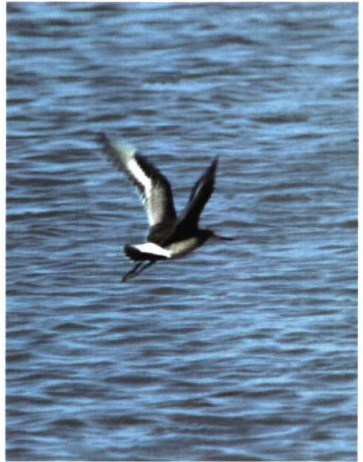
250 Hudsonian Godwit / Rode Grutto Limosa haemastica , juvenile/first-winter, Mary's Point, New Brunswick, Canada, October 1996 (Ronald de Lange)