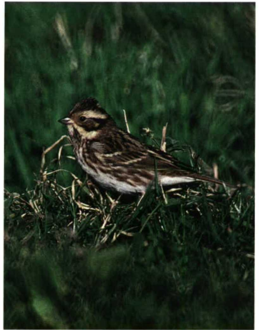
265 American Great White Egret / Amerikaanse Grote Zilverreiger Casmerodius albus egretus , Derry, Northern Ireland, October 1997 (Anthony McGeehan) 266 Rustic Bunting / Bosgors Emberiza rustica , Rathlin Island, Antrim, Northern Ireland, October 1997 (Anthony McGeehan) 267 Lesser Yellowlegs / Kleine Geelpootruiter Tringa flavipes , Sete Cidades, São Miguel, Azores, 25 September 1997 (Theo Bakker/Cursorius)