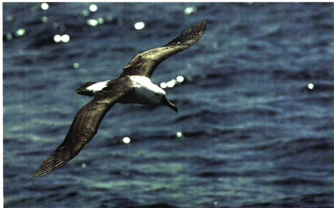
244 Indian Yellow-nosed Albatross / Indische Geelneusalbatros Diomedea chlororhynchos bassi , off Wollongong, New South Wales, Australia, 23 October 1994