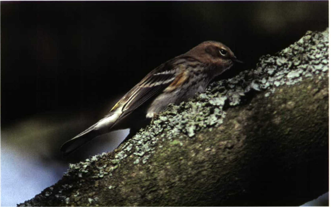
229 Mirtezanger / Myrtle Warbler Dendroica coronata , mannetje, Vlieland, Friesland, 15 oktober 1996