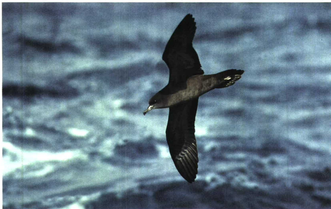
243 Wedge-tailed Shearwater / Wigstaartpijlstormvogel Puffinus pacificus , off Wollongong, New South Wales, Australia, 23 October 1994