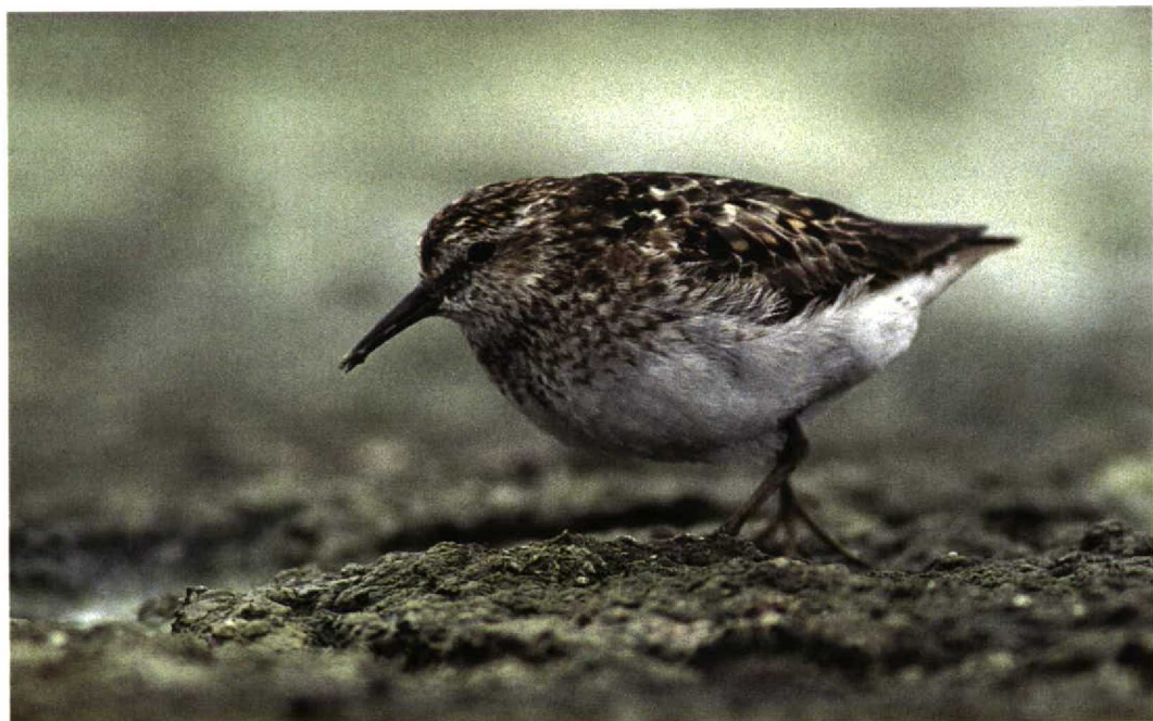
223 Kleinste Strandloper / Least Sandpiper Calidris minutilla , adult, Gent-Mendonk/Rodenhuize, Oost-Vlaanderen, België, 13 augustus 1996

GEDRAG Sterk lijkend op dat van Temmincks Strand-