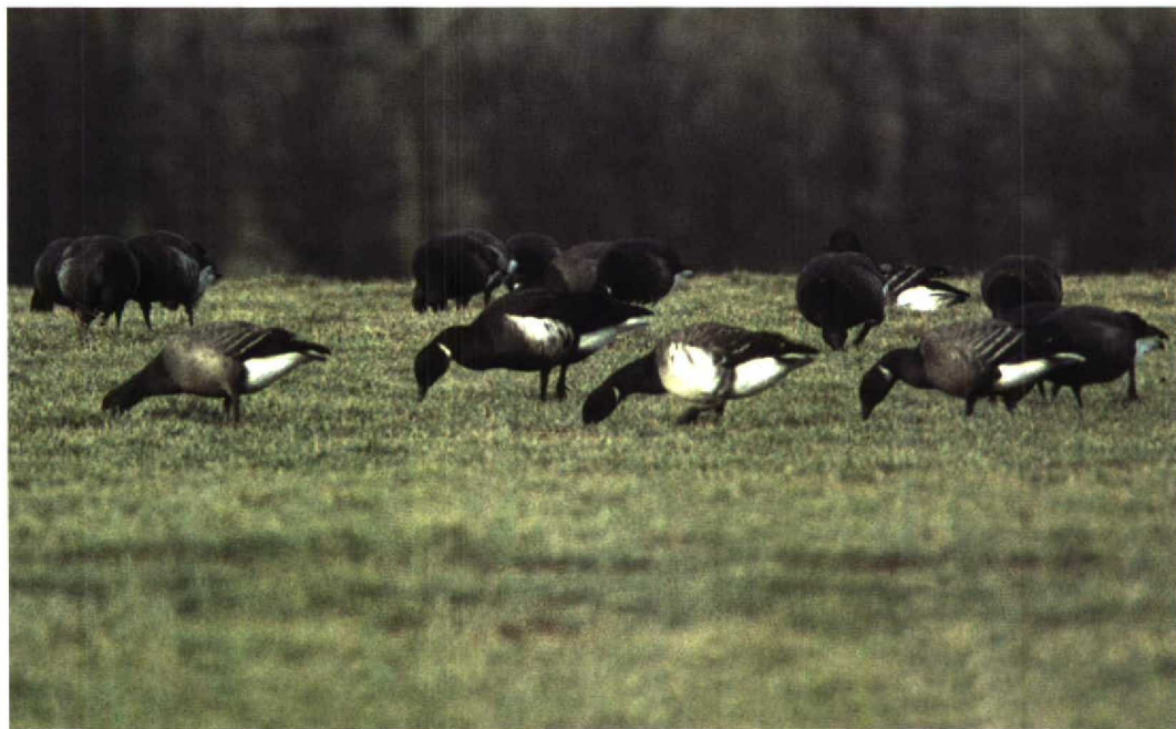
236 Dark-bellied Brent Geese / Rotganzen Branta bernicla with Black Brant / Zwarte Rotgans B nigricans (centre) and Pale-bellied Brent Goose / Witbuikrotgans B hrota (right of centre), Stroe, Wieringen, Noord-Holland, Netherlands, 8 February 1997 237 Pale-bellied Brent Geese / Witbuikrotganzen Branta hrota , Strangford, Down, Northern Ireland, 25 March 1993