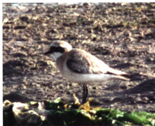
259 American Herring Gull / Amerikaanse Zilvermeeuw Larus argentatus smithonianus , 100 miles west of Lewis, Western Isles, Scotland, 11 September 1997 (Richard White) 260 Purple Swamp-hen / Purperkoet Porphyrio porphyrio , Sandscale Haws, Cumbria, England, October 1997 (Steve Young/Birdwatch) 261 Least Sandpiper / Kleinste Strandloper Calidris minutilla , Lajes de Pico, Pico, Azores, 3 October 1997 (Willem Steenge) 262 Surf Scoter / Brillzee-eend Melanitta perspicillata , first-winter, Faja dos Cubres, São Jorge, Azores, 9 October 1997 (Willem Steenge) 263-264 Lesser Sand Plover / Mongoolse Plevier Charadrius mongolus , Pagham, Kent, England, August 1997 (Jain H Leach)