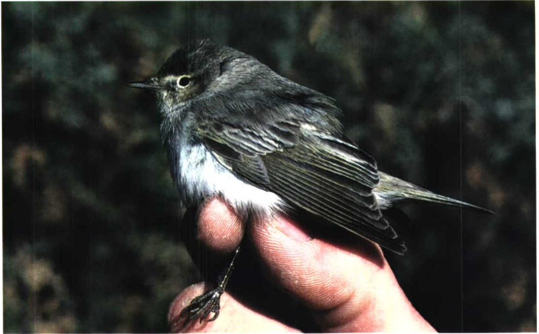
247 Eastern Bonelli's Warbler / Balkanbergfluitter Phylloscopus orientalis , Eilat, Israel, 11 March 1993