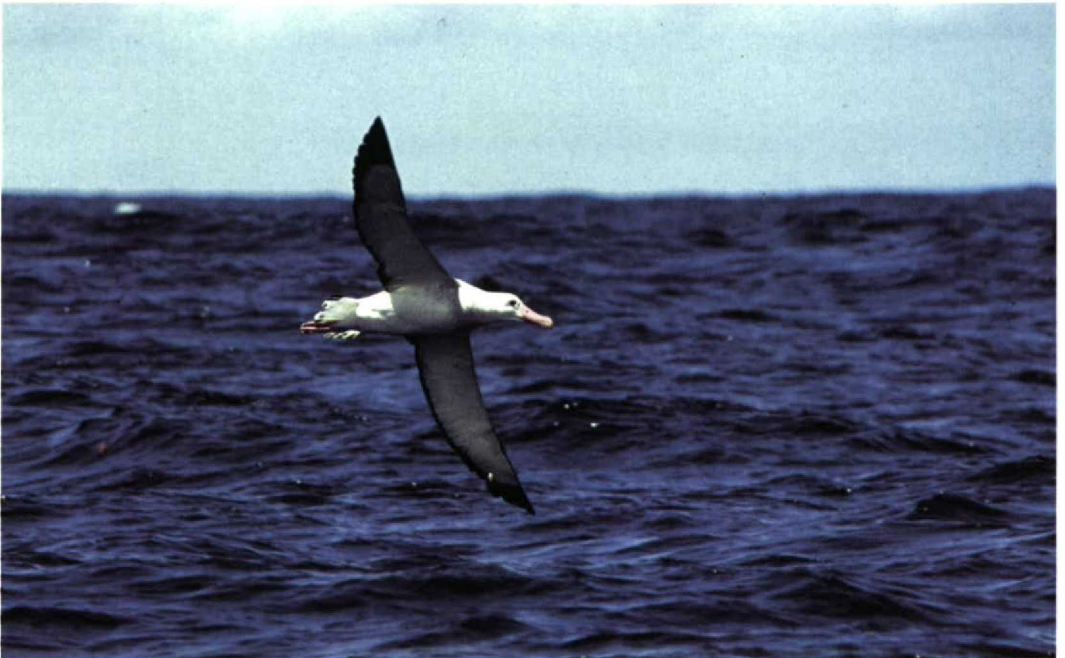
246 Wandering Albatross / Grote Albatros Diomedea exulans , off Wollongong, New South Wales, Australia, 23 October 1994