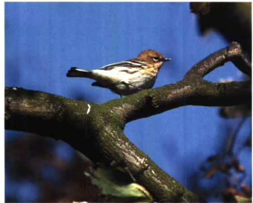
231-232 Mirtezanger / Myrtle Warbler Dendroica coronata , mannetje, Vlieland, Friesland, 13 oktober 1996 233 Mirtezanger / Myrtle Warbler Dendroica coronata , mannetje, Vlieland, Friesland, 13 oktober 1996 234 Mirtezanger / Myrtle Warbler Dendroica coronata , mannetje, Vlieland, Friesland, 14 oktober 1996

wit, borst aan beide zijden met 5-6 rijen zwartbruine V-vormige vlekken; centrum van borst wit. Flank met zwavelgele zweem bij vleugelboeg, helder zwavelgeel onder vleugel; vage zwartbruine vlekken flankstrepen vormend.