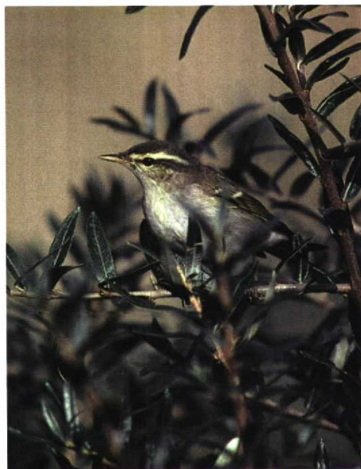
268-269 Arctic Warbler / Noordse Boszanger Phylloscopus borealis , Maasvlakte, Zuid-Holland, Netherlands, 28 September 1997