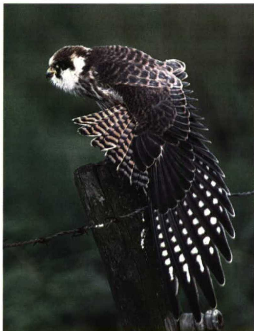
275 Roodpootvalk / Red-footed Falcon Falco vespertinus , Ter Aard, Drenthe, 31 augustus 1997

en maximaal drie op de Strabrechtse Heide, Noord-Brabant. Er werden 20 Roodpootvalken Falco vespertinus gemeld, waaronder een groepje van vijf op 24 augustus bij 's-Gravenzande, Zuid-Holland.