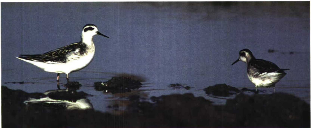
276 Grauwe Franjepoten / Red-necked Phalaropes Phalaropus lobatus , Lopikerkapel, Utrecht, 12 augustus 1997 (Arjan Boele)