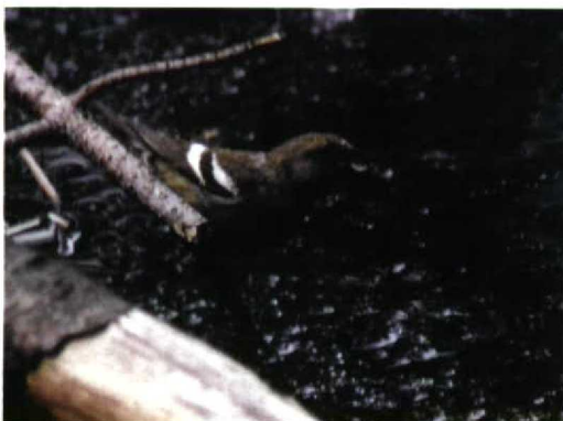
277 Witbandkruisbek / Two-barred Crossbill Loxia leucoptera , Vlieland, Friesland, 12 augustus 1997

De kans lijkt groot dat er gedurende de komende winter nog wel enkele Witbandkruisbekken op zullen duiken, zodat het de grootste invasie voor deze eeuw kan worden. De grootste 20e-eeuwse invasie tot nu toe vond plaats in najaar en winter 1990/91, toen er zeven gevallen waren van in totaal 15 exemplaren (cf Dutch Birding 15: 206-214, 1993; 16, 145, 1994). Opvallend is dat er dit jaar nog nauwelijks meldingen uit Groot-Brittannië zijn gekomen. ENNO B EBELS