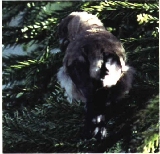
271 Azores Bullfinch / Azorengoudvink Pyrrhula murina , Tranqueira, São Miguel, Azores, 24 September 1997 (Theo Bakker/Cursorius)

was in Fife on 18 October. In Norway, a first-winter Black-headed Bunting E. melanocephala was seen on Sula, Sør-Trøndelag, on 21 September.