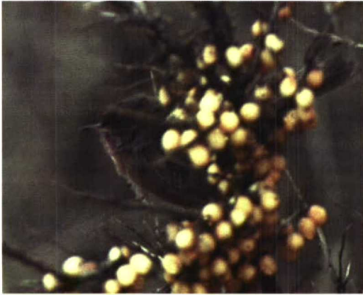
227 Provençaalse Grasmus / Dartford Warbler Sylvia undata , Brielsegatdam, Zuid-Holland, 6 januari 1997