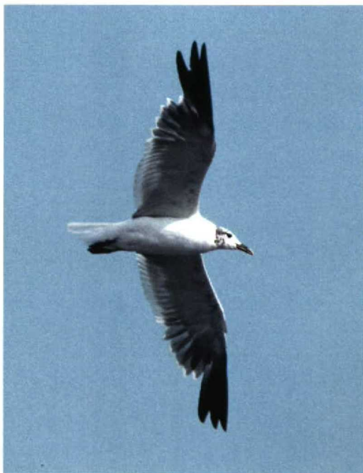
274 Lachmeeuw / Laughing Gull Larus atricilla , Groningen, Groningen, 31 augustus 1997