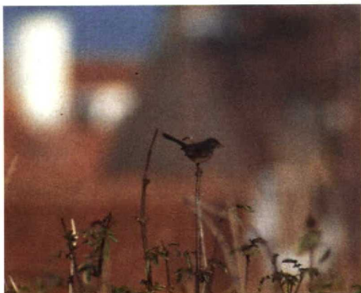
226 Provençaalse Grasmus / Dartford Warbler Sylvia undata , Westkapelle, Zeeland, 1 december 1995 (Erik Sanders)

Geen (opvallende) teugel, oogstreep of wenkbrauwstreep. Oogring rood.