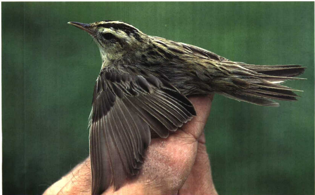
273 Waterrietzanger / Aquatic Warbler Acrocephalus paludicola , adult, Zandvoort, Noord-Holland, 23 augustus 1997