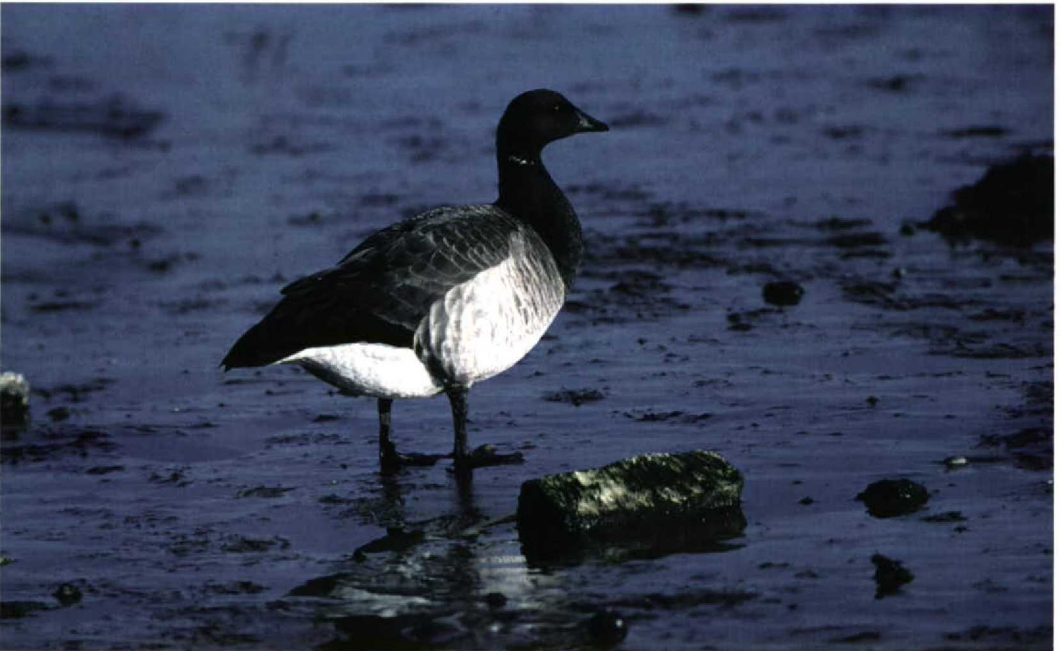
239 Pale-bellied Brent Goose / Witbuikrotgans Branta hrota , Stone Harbour, Cape May, New Jersey, USA, 6 May 1995 (Arnaud B van den Berg)