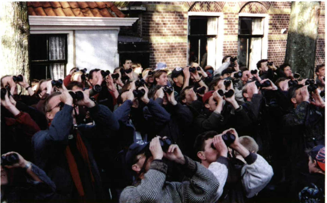
230 Vogelaars bij Mirtezanger / Myrtle Warbler Dendroica coronata , Vlieland, Friesland, 13 oktober 1996 (Leo Heemskerk)