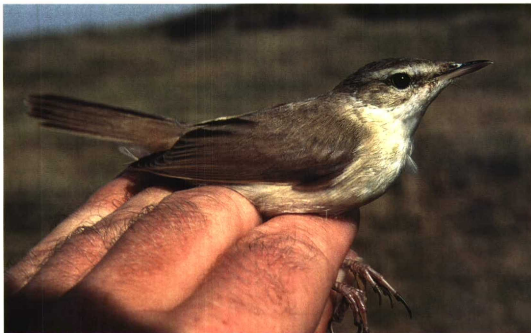
272 Veldrietzanger / Paddyfield Warbler Acrocephalus agricola , Castricum, Noord-Holland, 12 augustus 1997 (Arnold Wijker)