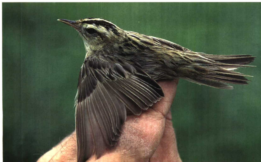
273 Waterrietzanger / Aquatic Warbler Acrocephalus paludicola , adult, Zandvoort, Noord-Holland, 23 augustus 1997