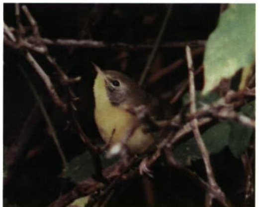
253-254 Palm Warbler / Palmzanger Dendroica palmarum , Stokkseyri, Árnessýsla, Iceland, 7 October 1997 255-256 Cerulean Warbler / Azuurzanger Dendroica cerulea , Eyraðakki, Árnessýsla, Iceland, 5 October 1997 257-258 Common Yellowthroat / Maskerzanger Geothlypis trichas , St Mary's, Scilly, England, October 1997