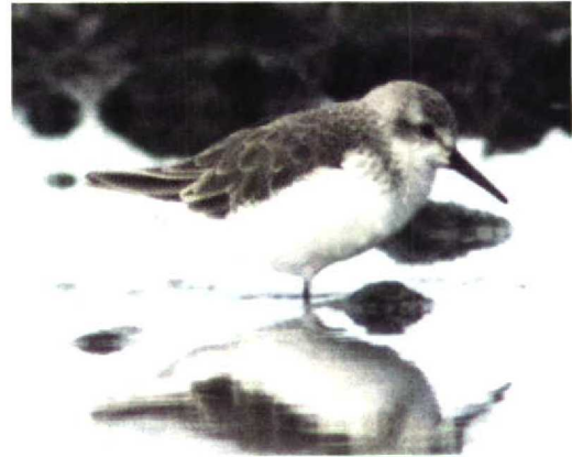
203 Red-billed Tropicbird / Roodsnavelkeerkringvogel Phaethon aethereus , Porto Santo ferry, Madeira, Portugal, 23 July 1997 (Steve Geelhoed) 204 Oriental Pratincole / Oostelijke Vorkstaartplevier Glareola maldivarum , Workumerwaard, Friesland, Netherlands, 1 August 1997 (Mark Zekhuis) 205 Semipalmated Sandpiper / Grijze Strandloper Calidris pusilla (right), Julianadorp, Noord-Holland, Netherlands, 3 August 1997 (René Pop) 206 Western Sandpiper / Alaskastrandloper Calidris mauri , Musselburgh, Lothian, Scotland, August 1997 (Iain H Leach)

Geronticus eremita were counted on 14 July. A record number of 2000 Greater Flamingos Phoenicopterus roseus bred in Sardinia, Italy, in 1997.