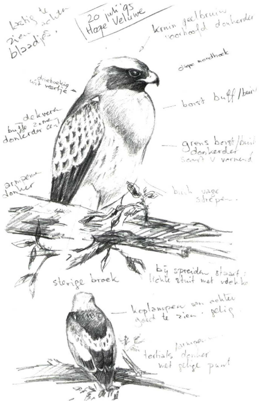
FIGUUR 2 Dwergarend / Booted Eagle Hieraetus pennatus , donkere vorm, Hoge Veluwe, Gelderland, 20 juli 1995