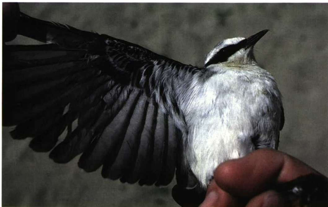
166 Northern Wheatear / Tapuit Oenanthe oenanthe , Omer Gölü, Turkey, 23 April 1987 Note dark underwing

noticeably darker than the underparts, with a sharper contrast between them. Northern always appears very contrasting and at distance the body looks bicoloured, not homogeneous as Isabelline. There have been rare reports of some very pale Northern, chiefly first-winter birds, in which such contrast is similar to that in most Isabelline, though the whole body never appears as homogeneous as in the latter species. Beware also of leucistic or aberrant, oddly coloured Northern. These