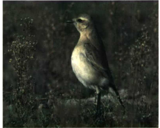
193-194 Izabeltapuit / Isabelline Wheatear Oenanthe isabellina , Maasvlakte, Zuid-Holland, 22 oktober 1996

BOVENVLEUGEL Handpennen bruin met geelbruine zoom. Armpennen, tertials en handdekveren met bruin centrum en lichte geelbruine rand. Kleine dekveren donker zandkleurig. Grote dekveren donker zandkleurig met lichte geelbruine top en zoom, tezamen vleugelstreep vormend. Middelste dekveren met donker zandkleurig centrum, weinig contrasterend met rest van verenkleed, en lichte geelbruine rand, soms indruk gevend van korte bovenste vleugelstreep. Duimvleugel zwart met witte rand, duidelijk afstekend tegen rest van verenkleed en daardoor van grote afstand zichtbaar.