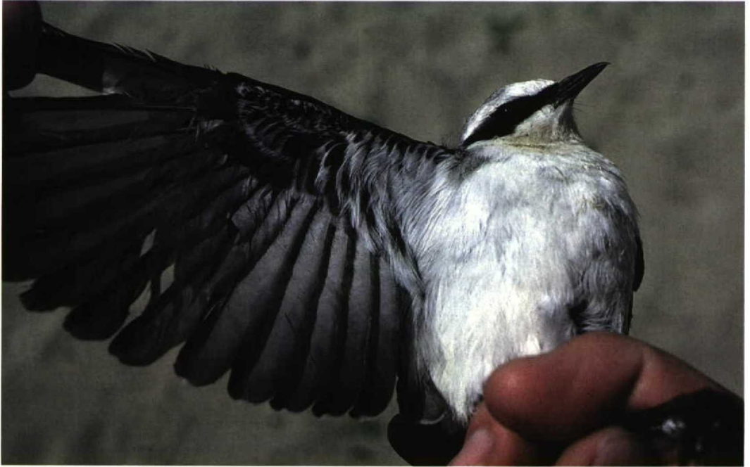
166 Northern Wheatear / Tapuit Oenanthe oenanthe , Omer Gölü, Turkey, 23 April 1987 (Arnoud B van den Berg) Note dark underwing

noticeably darker than the underparts, with a sharper contrast between them. Northern always appears very contrasting and at distance the body looks bicoloured, not homogeneous as Isabelline. There have been rare reports of some very pale Northern, chiefly first-winter birds, in which such contrast is similar to that in most Isabelline, though the whole body never appears as homogeneous as in the latter species. Beware also of leucistic or aberrant, oddly coloured Northern. These