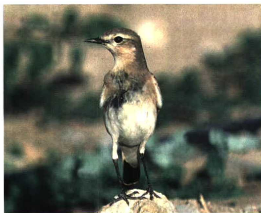
162 Northern Wheatear / Tapuit Oenanthe oenanthe , first-winter, southern Sicily, Italy, September 1996 (Valerio Cappello). Note pale upperparts and extensive pale fringes on wing, similar to Isabelline Wheatear O isabellina , but note also distinctive, even dark spotting on higher wing, black-centred greater coverts not contrasting with alula, long tail, long primary projection and broad, very striking supercilium 163 Isabelline Wheatear / Izabeltapuit Oenanthe isabellina , southern Sicily, Italy, March 1996 (Valerio Cappello). Note very pale ear-coverts and typical supercilium, but note also rather strong contrast between wing (especially higher part) and mantle and scapulars, contrasting dark centres of tertials, dark primaries and dark tail 164 Northern Wheatear / Tapuit Oenanthe oenanthe , Texel, Noord-Holland, Netherlands, 22 September 1996 (Arnoud B van den Berg) 165 Isabelline Wheatear / Izabeltapuit Oenanthe isabellina , Eilat, Israel, 3 November 1986 (Arnoud B van den Berg)

RUMP & UPPERTAIL-COVERTS (SLIGHTLY OR NOT VARIABLE; REASONABLY RELIABLE) In Isabelline, the white on the uppertail-coverts and rump, as well as on the rectrices, is less extensive and less noticeable than in Northern; hence, the contrast between black (on tail) and white (on uppertail-coverts and rump) is less evident than in Northern. During flight, this contrast stands out visibly in Northern, very striking even at a distance.