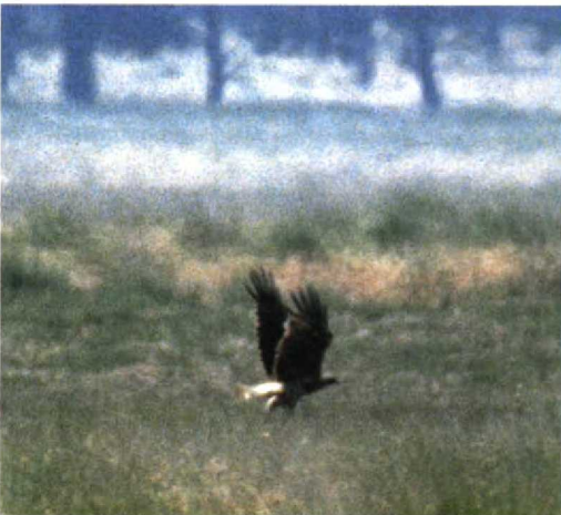
183-185 Dwergarend / Booted Eagle Hieraetus pennatus , donkere vorm, Hoge Veluwe, Gelderland, juli 1995