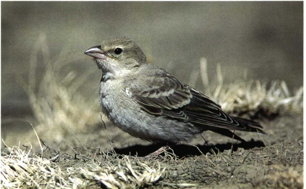
211 Pale Rock Sparrow / Bleke Rotsmus Petronia brachydactyla , Nemrut Dagı, Turkey, 13 July 1997