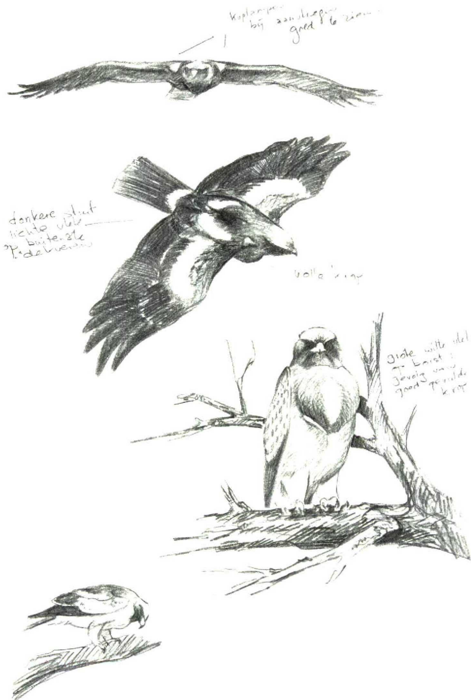
FIGUUR 1 Dwergarend / Booted Eagle Hieraetus pennatus , donkere vorm, Hoge Veluwe, Gelderland, 20 juli 1995