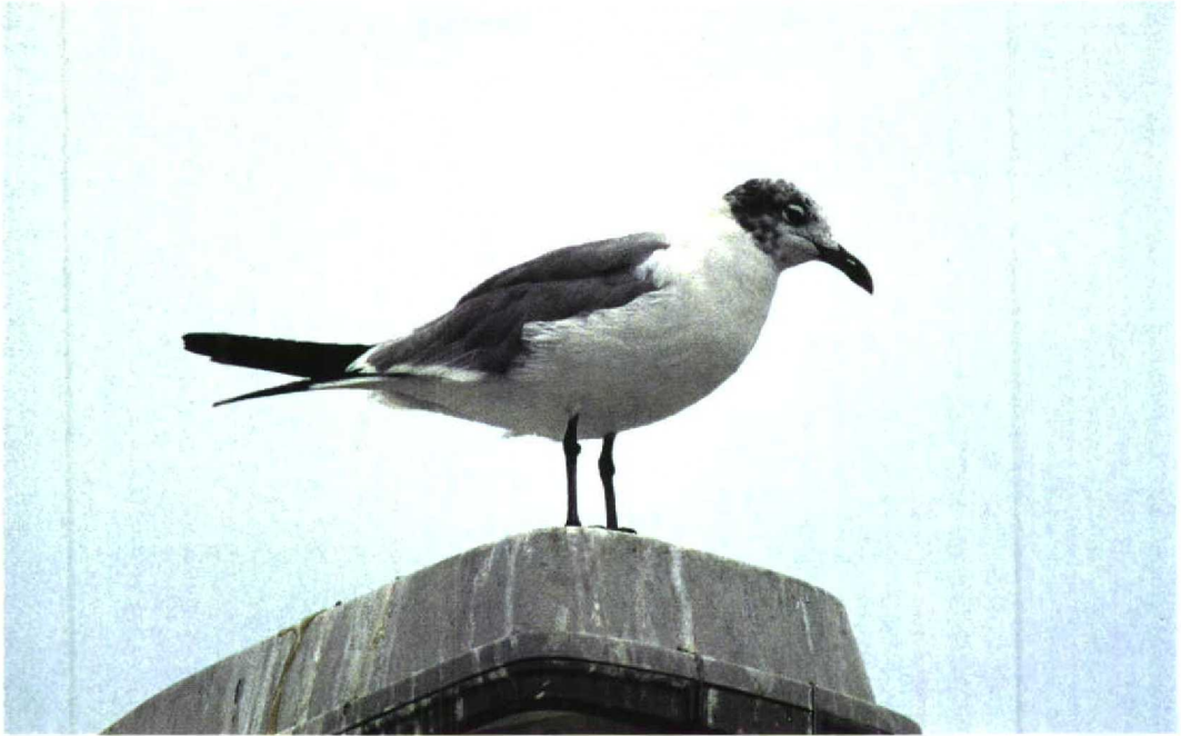
208 Laughing Gull / Lachmeeuw Larus atricilla , Groningen, Groningen, Netherlands, 27 August 1997