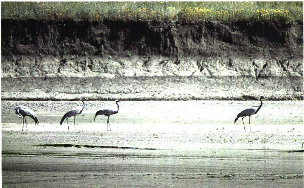
209 Demoiselle Cranes / Jufferkraanvogels Anthropoides virgo , Yoncali, Turkey, 11 July 1997 (Kris De Rouck)