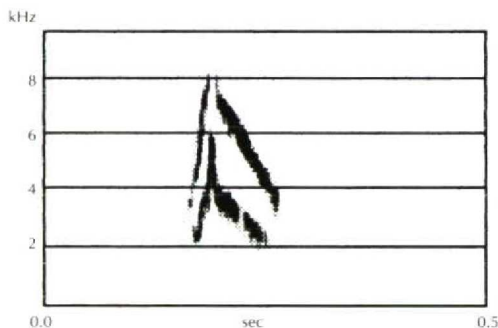
FIGUUR 1 Vluchtroep van Mongoolse Pieper / Blyth's Pipit Anthus godlewskii ( chep-roep ), Maasvlakte, Zuid-Holland, 26 oktober 1996