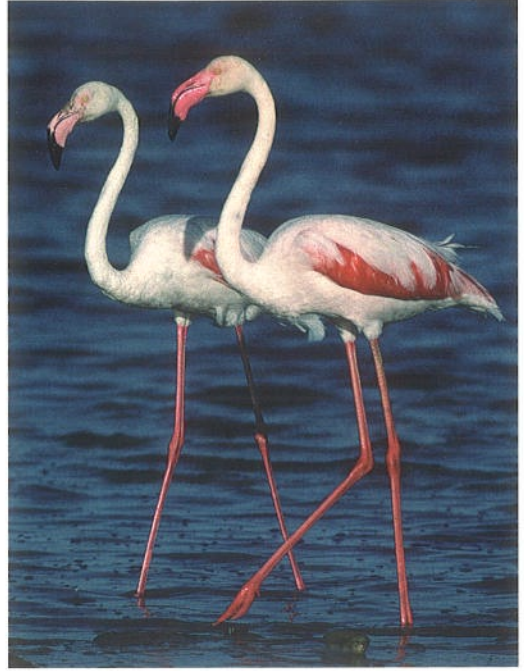
196 Greater Flamingo / Flamingo Phoenicopterus roseus , juvenile, Camargue, Bouches-du-Rhône, France, 9 September 1994 (Arnoud B van den Berg) 197 Greater Flamingos / Flamingo's Phoenicopterus roseus , adult and immature, Camargue, Bouches-du-Rhône, France, 10 September 1994 (Arnoud B van den Berg) 198 Caribbean Flamingo / Caribische Flamingo Phoenicopterus ruber , adult, in captivity, Wassenaar, Zuid-Holland, Netherlands, 25 November 1985 (Arnoud B van den Berg) 199 Chilean Flamingo / Chileense Flamingo Phoenicopterus chilensis , adult, in captivity, Wassenaar, Zuid-Holland, Netherlands, 25 November 1985 (Arnoud B van den Berg)