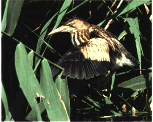
212 Woudaap / Little Bittern Ixobrychus minutus , juveniel, Waddinxveen, Zuid-Holland, juli 1997

Well, Limburg. De Slangenarend Circaetus gallicus van de Hoge Veluwe bleef de gehele periode aanwezig. Na eerdere geruchten werd op 29 juni net als in 1996 de aanwezigheid van twee exemplaren op deze plek bevestigd. Hoewel de meeste waarnemingen werden gedaan op en rond de Deelense Was, waren er ook ten zuiden van Radio Kootwijk, Gelderland (reeds op 27 mei), en ten zuidwesten van Deelen, Gelderland. Ook was er een melding op 19 juli bij Hulst, Zeeland. Buiten de broedgebieden werden Grauwe Kiekendieven Circus pygargus waargenomen op 1 juni op Texel, op 3 juni bij het Soerendonks Goor, Noord-Brabant, en op 13 juni bij Ermelo, Gelderland. De laatste noordwaarts doortrekkende Visarenden Pandion