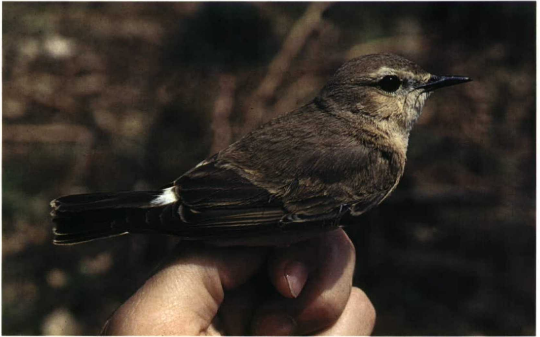
160 Isabelline Wheatear / Izabeltapuit Oenanthe isabellina , Comino, Malta, 28 April 1996. Note short, broad, triangular primary projection, large bulky head, dark alula still contrasting with very worn wing-coverts and small amount of white on rump and uppertail-coverts 161 Northern Wheatear / Tapuit Oenanthe oenanthe , Bloemendaal, Noord-Holland, Netherlands, 30 August 1991. Note tail pattern and compare with Isabelline Wheatear O isabellina in plate 160