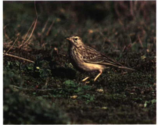
186 Mongoolse Pieper / Blyth's Pipit Anthus godlewskii , Maasvlakte, Zuid-Holland, 26 oktober 1996 187-189 Mongoolse Pieper / Blyth's Pipit Anthus godlewskii , Maasvlakte, Zuid-Holland, 26 oktober 1996

keel licht crèmekleurig. Oog vrij groot en opvallend, met name door lichte omranding.