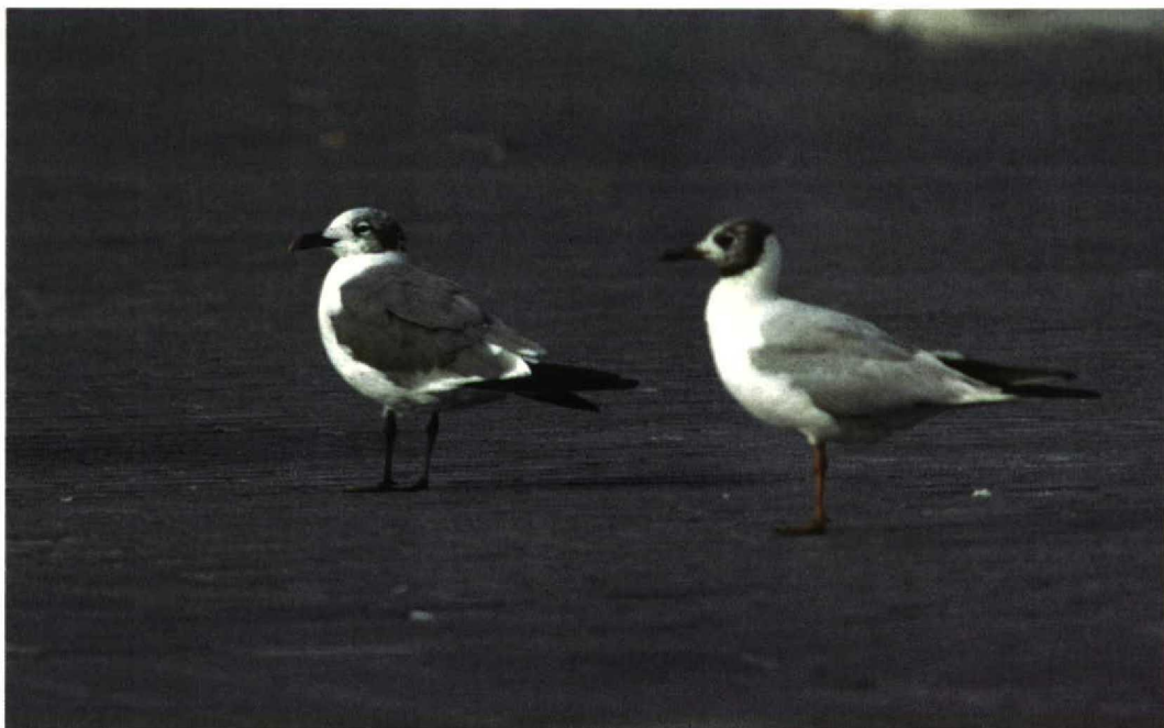
220 Lachmeeuw / Laughing Gull Larus atricilla , Groningen, Groningen, 22 augustus 1997

Na het nieuws via de semafoons te hebben verspreid arriveerden de eerste verhitte Groningers, sommigen in nogal ongewone outfit, op de plek. Pas na een half uur vloog de Lachmeeuw weer over. Toen de eerste mensen 'uit het land', getergd door files, arriveerden, liep het al tegen vijven. De vogel was al uren zoek, nadat hij nog even bij een sluis c 800 m verderop was gezien. Maar gelukkig vloog hij om c 17:30 opnieuw