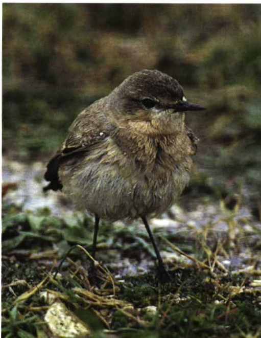
173 Isabelline Wheatear / Izabeltapuit Oenanthe isabellina , southern Sicily, Italy, March 1996. Same bird as in plate 158

UNDERWING (SLIGHTLY VARIABLE (4.4%); MOST RELIABLE OF ALL IDENTIFICATION CHARACTERS) In Isabelline , the underwing is very pale and clean with white or buffish-white underwing-coverts and axillaries and very pale