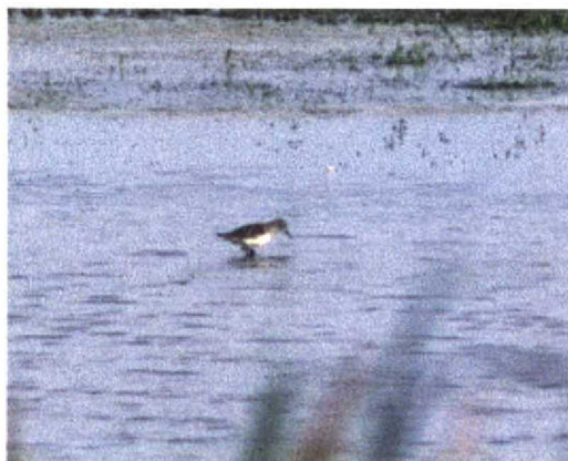
195 Grijze Strandloper / Semipalmated Sandpiper Calidris pusilla , adult, Oostvaardersdijk, Lepelaarsplassen, Flevoland, 19 juli 1996

This was the second record of Semipalmated Sandpiper for the Netherlands. The first was also present along Oostvaardersdijk, 13 km to the north, on 12-13 June 1989 (van der Veen 1991). The latter bird could not be photographed due to the distance of 75-200 m;