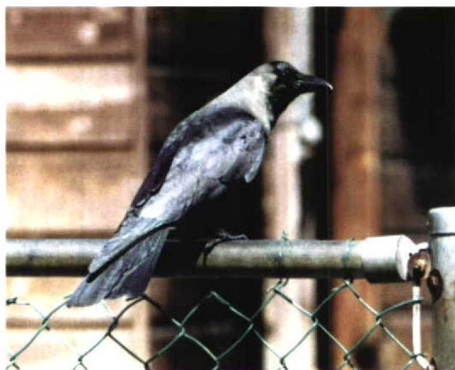
216 Huiskraai / House Crow Corvus splendens , Hoek van Holland, Zuid-Holland, 19 juli 1997

waren de Langstaartroodmussen Uragus sibiricus van 3 tot 23 juni op Terschelling en op 19 juli twee samen met enkele Baardmannen Panurus biarmicus in de Abtskolk bij Petten, Noord-Holland. Voor Roodmussen Carpodacus erythrinus was het een goed jaar, met op Terschelling een recordaantal van 18 territoria. Op 20 juli zong een mannetje Zwartkopgors Emberiza melanocephala op De Blocq van Kuffeler, Flevoland.