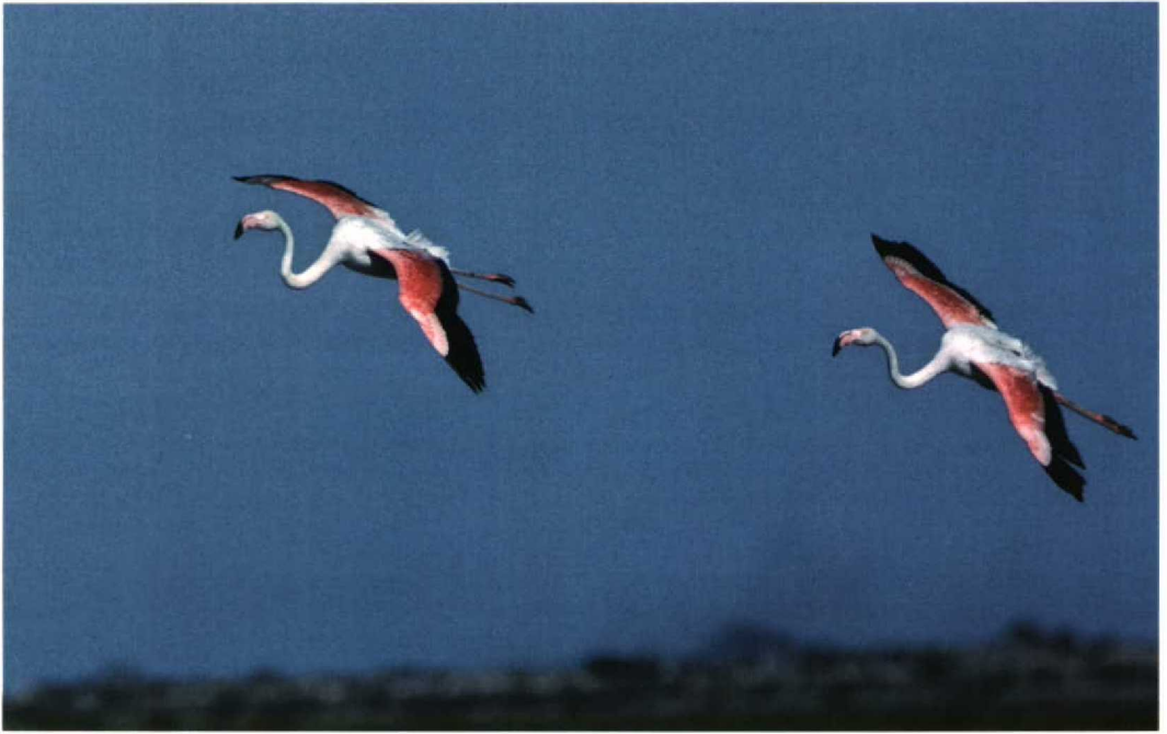
200 Greater Flamingos / Flamingo's Phoenicopterus roseus , adult, Camargue, Bouches-du-Rhône, France, July 1988 (René Pop)

(escaped) Chilean and Caribbean Flamingo. A mixed pair of Chilean and Greater Flamingo nested in 1989 but breeding success is not known. Adult hybrids of Chilean and Greater Flamingo have been observed in France and Spain (Cezilly & Johnson 1992). Recently, free-living Chilean and Greater Flamingo formed a mixed breeding colony at Zwillbrocker Venn, Nordrhein-Westfalen, Germany, near the Dutch border (Treep 1991, 1994). In 1993-94, the colony contained 13-18 pairs of Chilean and 2-6 pairs of Greater Flamingo (Lensink 1996). In both years, one mixed pair of Chilean and Greater Flamingo nested, raising one hybrid young (Lensink 1996). Hybrids of Chilean and Greater Flamingo may reach adulthood (Cezilly & Johnson 1992) and are fertile (Joop Treep pers comm).