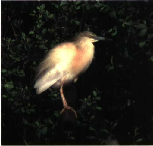
217 Ralreiger / Squacco Heron Ardeola ralloides , Libramont, Luxembourg, 28 juni 1997 (Luc Verroken)