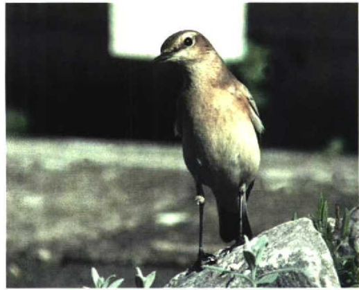
174 Isabelline Wheatear / Izabeltapuit Oenanthe isabellina , Marina di Modica, southern Sicily, Italy, April 1994 (Valerio Cappello). Rather grey-coloured bird with upperparts remarkably contrasting with underparts. Primary projection appearing long but all other characters typical of Isabelline 175 Northern Wheatear / Tapuit Oenanthe oenanthe , Vlieland, Friesland, Netherlands, 19 September 1993 (Carl Derks). Note pale breast and unmarked 'trousers' reminiscent of Isabelline Wheatear O. isabellina 176 Northern Wheatear / Tapuit Oenanthe oenanthe , Vlieland, Friesland, Netherlands, 19 September 1993 (Carl Derks). Same bird as in plate 175. Note long wings reaching beyond undertail-coverts and typical supercilium 177 Northern Wheatear / Tapuit Oenanthe oenanthe , Vlieland, Friesland, Netherlands, 19 September 1993 (Carl Derks). Same bird as in plate 175

remiges, giving the wing (in flight) a semi-translucent look (figure 4); in Northern, the underwing is dark grey or black and, also in first-winter and autumn female, never pure white but only washed grey or grey with extensive pale fringes. Only eight Isabelline observed showed many dark traces on the underwing-coverts and along the notches, but still such traces did not influence the paler and cleaner effect of the underwing. When comparing these two species, this aspect of the underwing is diagnostic and Isabelline does not show a dusky underwing (contra Wallace 1984). Moreover, the remiges on the underwing in Isabelline are truly dark (darker than any coverts), so when the pale fringes are abraded, the underwing appears in fact duskier than