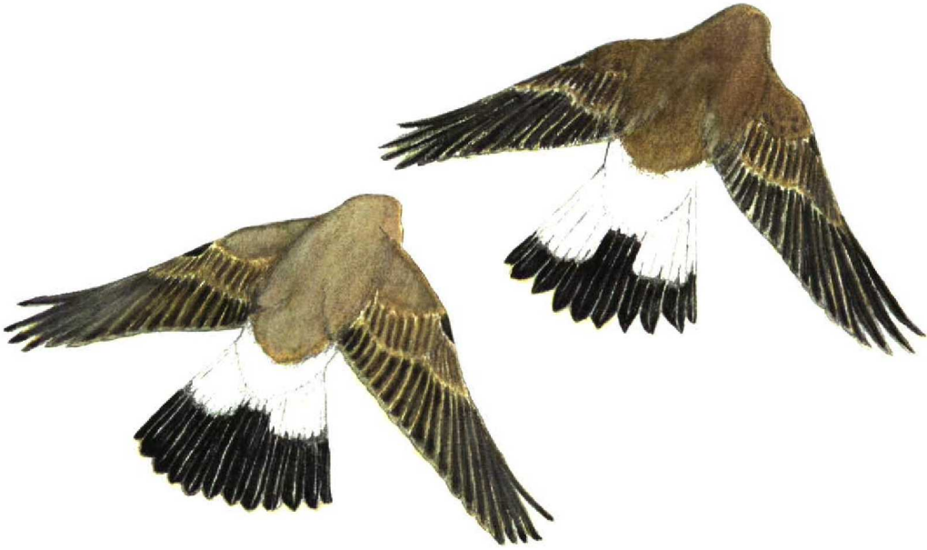
FIGURE 4 Isabelline Wheatear / Izabeltapuit Oenanthe isabellina and Northern Wheatear / Tapuit O oenanthe in flight (Carmela Cardelli & Andrea Corso). Isabelline (left): note paler general aspect, paler wings with semi-translucent look, less white on tail, uppertail-coverts and rump, broader black tail-band with indistinct inverted T and less eye-catching black-white contrast. Northern (right): note darker general ground colour, darker wings, more white on rump and tail, narrower black tail-band with distinct inverted T and more eye-catching black-white contrast