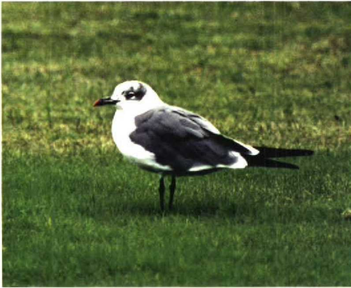
221 Lachmeeuw / Laughing Gull Larus atricilla , Groningen, Groningen, 30 augustus 1997