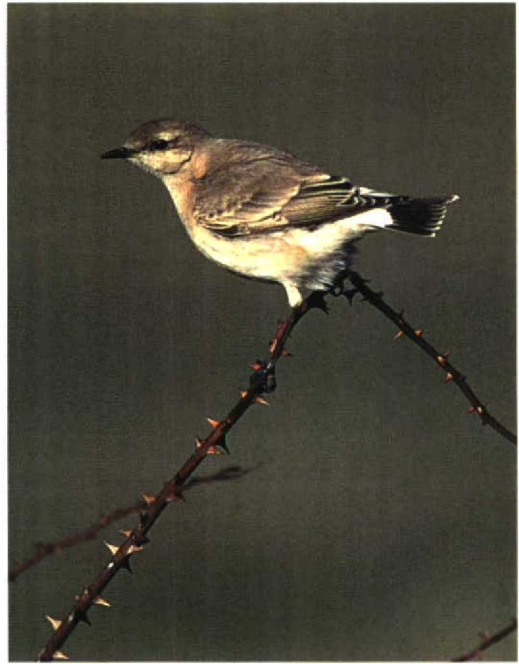
190 Izabeltapuit / Isabelline Wheatear Oenanthe isabellina , Maasvlakte, Zuid-Holland, 23 oktober 1996 191 Izabeltapuit / Isabelline Wheatear Oenanthe isabellina , Maasvlakte, Zuid-Holland, 23 oktober 1996 192 Izabeltapuit / Isabelline Wheatear Oenanthe isabellina , Maasvlakte, Zuid-Holland, 22 oktober 1996