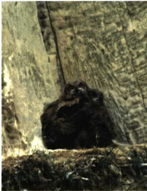
215 Oehoes / Eagle Owls Bubo bubo , juveniel, Maastricht, Limburg, 12 juli 1997

haliaetus werden gezien op 1 juni bij Olst, Overijssel, op 3 juni op Terschelling en op 7 juni bij Katwijk aan Zee. Pleisteraars verschenen van 20 tot 27 juli bij Rhenen, Utrecht, en vanaf 27 juli bij de Ventjagersplaten, Zuid-Holland. Roodpootvalken Falco vespertinus werden gemeld op 2 juni bij Rhenen en op de Strabrechtse Heide, op 3 juni op Terschelling en bij Middelburg, Zeeland, op 27 juni in Meyendel, Zuid-Holland, en vanaf 5 juli bij de Deelse Was. Uitzonderlijk was de melding van een Smelleken F columbarius op 6 juli in de Eemshaven, Groningen.