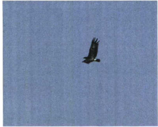
222 Bastaardarend / Spotted Eagle Aquila clanga , Lauwersmeer, Groningen, 29 augustus 1997

over, daarbij gelijk op film vastgelegd door een team van de regionale omroep TV-Noord. Enige tijd later werd hij teruggevonden op een grasveld ten noorden van de Europaweg en vloog vervolgens naar het dak van een bedrijf, onzichtbaar vanaf de grond. Gelukkig stond er een hoge mast en deze bracht voor velen uitkomst; na flink wat meters klimmen kon de vogel bewonderd worden op het dak! Even later kon bovendien de portier van het tegenovergelegen Philips-kantoor worden overgehaald mensen in groepjes van zes toe te laten tot een hoge verdieping van het gebouw, vanwaar de vogel redelijk kon worden bekeken. Met brood en inderhaast bij de nabijgelegen McDonald's aangeschafte hamburgers werden de aanwezige Kokmeeuwen L. ridibundus en soms ook de Lachmeeuw van het dak gelokt om tot in de schemering een hapje te halen. De volgende dagen was de vogel 's ochtends meestal heel vroeg even te zien, om zich pas mooi te laten bekijken in de namiddag en het begin van de avond, wanneer de meeuwen zich verzamelden op de grote parkeerplaats bij IKEA en McDonald's.