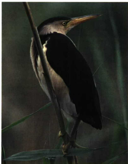
201 Little Bittern / Woudaap Ixobrychus minutus , adult, Waddinxveen, Zuid-Holland, Netherlands, July 1997 (Jan van Holten)