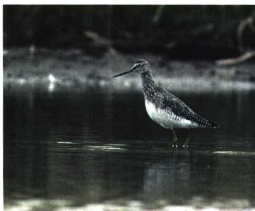
178 Grote Geelpootruiter / Greater Yellowlegs Tringa melanoleuca , Grijskerke, Zeeland, 15 januari 1995 179 Grote Geelpootruiter / Greater Yellowlegs Tringa melanoleuca , Dudzele-Zeebrugge, West-Vlaanderen, België, november 1994 180 Grote Geelpootruiter / Greater Yellowlegs Tringa melanoleuca , Braakman, Terneuzen, Zeeland, 21 april 1995 181 Grote Geelpootruiter / Greater Yellowlegs Tringa melanoleuca , Braakman, Terneuzen, Zeeland, mei 1995

streping; streping richting kin en keel minder dicht, maar daardoor wel meer opvallend. Kruij donkerder dan rest van kop. Teugel donkerbruin. Wenkbrauwstreek voor oog wit, even breed als oog, achter oog met haarfijne schachtstreepjes. Witte oogring. Kin grijsig.