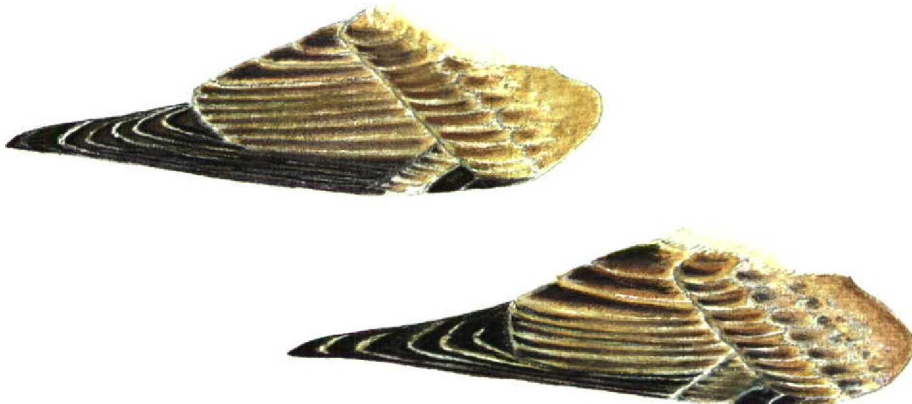
FIGURE 5 Wings of Isabelline Wheatear / Izabeltapuit Oenanthe isabellina and Northern Wheatear / Tapuit O oenanthe (Carmela Cardelli & Andrea Corso). Darkest and most marked type Isabelline (upper): note shorter and broader primary projection, paler primaries, less marked secondaries, more contrasting dark-centred tertials, more striking dark alula contrasting with brown (not blackish or black-centred) greater coverts. First-winter Northern (lower) for comparison: note longer and narrower primary projection, darker, more blackish primaries, darker and more marked secondaries, darker but less contrasting tertials, less contrasting alula, darker and more marked greater coverts with centres as dark as alula, more marked median and lesser coverts giving higher part of upperwing dark spotted aspect