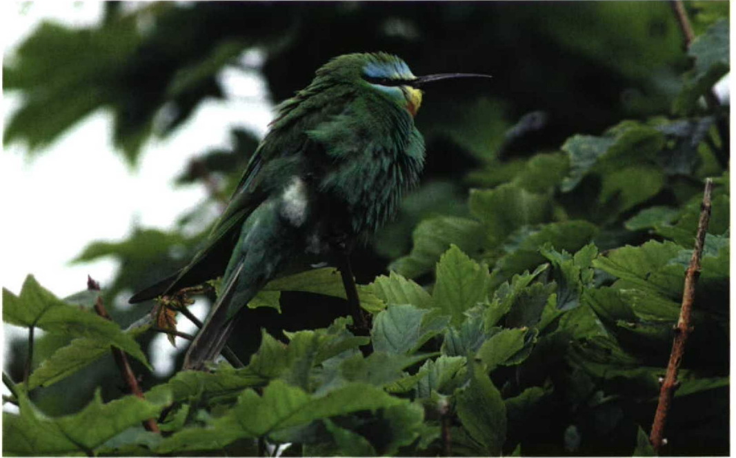
210 Blue-cheeked Bee-eater / Groene Bijeneter Merops persicus , Asta, Shetland, Scotland, 26 June 1997