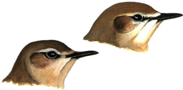
FIGURE 3 Heads of Isabelline Wheatear / Izabeltapuit Oenanthe isabellina and Northern Wheatear / Tapuit O oenanthe (Carmela Cardelli & Andrea Corso). Darkest type Isabelline (right) with ear-coverts darker than usual and dark general head colour. Pale type Northern (left) for comparison, with ear-coverts paler than usual, pale general head colour and narrow, indistinct and not very pale rear end of supercilium. Note typical differences in head shape, bill structure, lore colour and distinctness of supercilium above lore, and pale areas below eye and lore and in submoustachial area