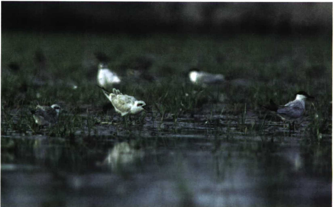
207 Gull-billed Terns / Lachsterns Gelochelidon nilotica , 't Zand, Noord-Holland, Netherlands, 9 August 1997

Larvik, Vestfold, Norway, on 20-21 August. There was much discussion whether a presumed Greater Sand Plover C leschenaultii on 14-16 August at Pagham, Kent, England, could have been Britain's first Lesser Sand Plover C mongolus . On 26 July, an adult Dotterel C morinellus with one young was seen on the Puigmal, Pyrénées Orientales, France, at the French-Spanish border. If accepted, an adult American Golden Plover Pluvialis dominicus roosting at Lesjø, Kørsøer, on 26 July will be the second for Denmark. The ninth for the Netherlands was an adult at Wevers Inlaag, Middel-schouwen, Zeeland, from 30 July to 9 August. This species' first breeding for Europe occurred at Ny Ålesund, Svalbard, Norway, where a pair raised four young in August. The first breeding pair of European Golden Plover P apricaria for Belgium since 1981 was found at Hautes Fagnes, Liège, in July. The fifth Sociable Lapwing Vanellus gregarius for Austria was seen on 13 April at Rabensburg. The second White-tailed Lapwing V leucurus for Sweden stayed at Turkiesjön, Västerås, Västmanland, on 22-24 June, at Östen, Västergötland, at least on 26 June (and probably earlier), and at Rynningeviken, Örebrö, Närke, from 27 June to 6 July. Another stayed at Getterön, Varberg, Halland, on 10-14 July. The first for Denmark was present at Tissoe, Kalundborg, Vest Sjælland, on 13-14 July and at Borreby Mose, Skælskør, Syd Sjælland, from 15 July to at least 3 August. On 16 July, two adult Semipalmated