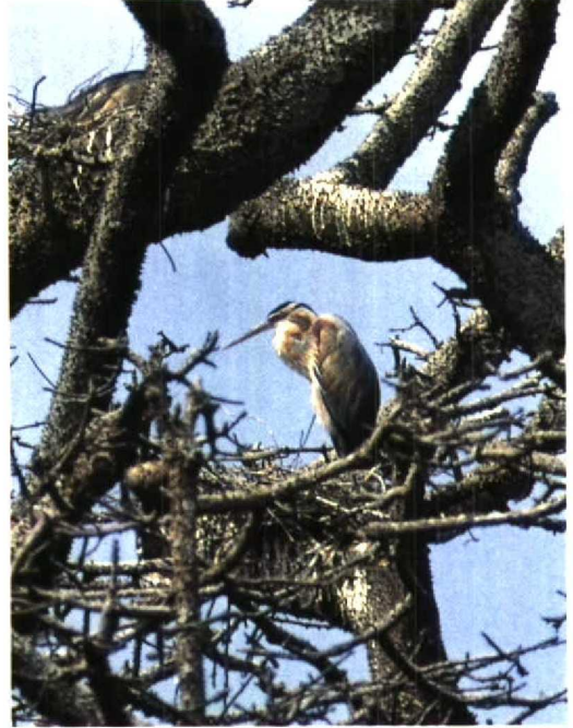
77 White-billed Diver / Geelsnavelduiker Gavia adamsii , hooked by fisherman, River Witham, Lincolnshire, England, 2 March 1996 (Steve Young/Birdwatch) 78 Cape Verde Purple Heron / Kaapverdiche Purperreiger Ardea (purpurea) bournei , Boa Entrada, Santiago, Cape Verde Islands, 4 March 1996 (Theo Bakker/Cursorius) 79 Harlequin Ducks / Harlekijneenden Histrionicus histrionicus , Ardwell Bay, Girvan, Strathclyde, Scotland, April 1996 (Steve Young/Birdwatch)