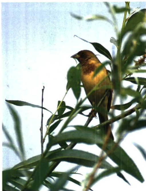
63 Bruinkopgors / Red-headed Bunting Emberiza bruniceps , mannetje, Sint Philipsland, Zeeland, 2 juni 1995 - 64 Bruinkopgors / Red-headed Bunting Emberiza bruniceps , mannetje (verzameld te Castricum, Noord-Holland, 6 juni 1933), Nationaal Natuurhistorisch Museum (NNM), Leiden, Zuid-Holland, maart 1996

Sinds het eind van de jaren 1940, maar vermoedelijk al veel eerder (cf Brouwer 1935, 1936, Hudson 1967, White 1967) werden grote aantallen Bruinkopgorzen geïmporteerd in West-Europa, onder meer in België, Groot-Brittannië en Nederland. In Groot-Brittannië werden bijvoorbeeld in 1988 800 Bruinkopgorzen geïmporteerd en in 1990 132 (Clement & Gantlett 1993). Het gaat meestal om mannetjes, die kort voor de voorjaarsstrek in India worden gevangen (Ferguson-Lees 1967). Er zijn veel waarnemingen bekend uit Groot-Brittannië en Ierland; na de eerste in 1931 werden tot en met 1990 zeker 291 waarnemingen verricht (Evans 1994). Hier worden waarnemingen van de Bruinkopgors sinds 1961, vanwege het veelvuldig voorkomen van ontsnapte vogels, zelfs niet meer landelijk geregistreerd of beoordeeld (Ferguson-Lees 1967, Dymond et al 1989). Het wordt echter aanneemelijk geacht dat ook echte dwaalgasten in West-Europa kunnen voorkomen (Lewington et al 1991, Dubois & Yésou 1992; Phillipe Dubois in litt). Zo vertoont het patroon van voorkomen op Shetland, Schotland, van zowel Bruinkopgors (n=24, alle als 'ontsnapt' beschouwd) als Zwart-