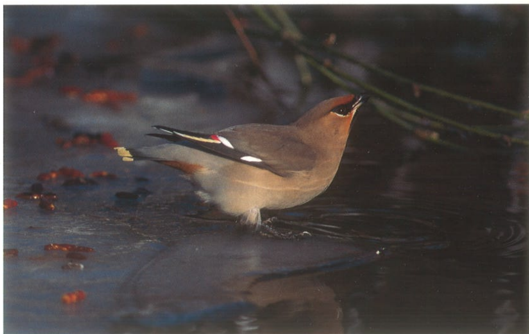
99 Pestvogel / Bohemian Waxwing Bombycilla garrulus , Katwijk, Zuid-Holland, 29 januari 1996 (René van Rossum)