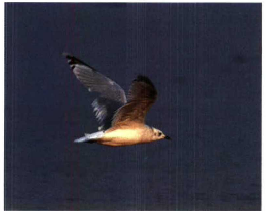
55 Relict Gull / Relictmeeuw Larus relictus , fresh second-winter (outer primary not yet fully grown), Happy Island, Hebei, China, September 1994 (Felix Heintzenberg). Note greenish bill with black tip and primary pattern 56 Relict Gulls / Relictmeeuwen Larus relictus , fresh second-winter (left) and adult-summer moulting to adult-winter, Happy Island, Hebei, China, September 1994 (Felix Heintzenberg) 57 Relict Gull / Relictmeeuw Larus relictus , second-winter, Happy Island, Hebei, China, September 1994 (Felix Heintzenberg) 58 Relict Gull / Relictmeeuw Larus relictus , moulting from second-summer to adult-winter, Happy Island, Hebei, China, September 1994 (Felix Heintzenberg)

from the breeding areas or different migration routes and wintering areas of this age group.