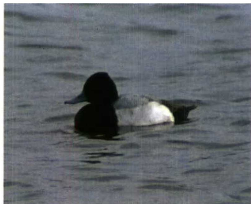
101 Witstuitbarmsijs / Arctic Redpoll Carduelis hornemanni , Bergen, Noord-Holland, 24 februari 1996 102 Kleine Topper / Lesser Scaup Aythya affinis , male, Sint-Kruis-Winkel, Oost-Vlaanderen, februari 1996

maart (één) en vanaf 27 maart (twee), en op 25 maart bij Latour (twee). Bij Baarle, Oost-Vlaanderen, verbleef van 29 februari tot 4 maart een ontsnapt vrouwtje Langstaartroodmus Uragus sibiricus . Op 22 februari werd een Witstuitbarmsijs Carduelis hornemanni gevangen in Putte-Kapellen, Antwerpen.