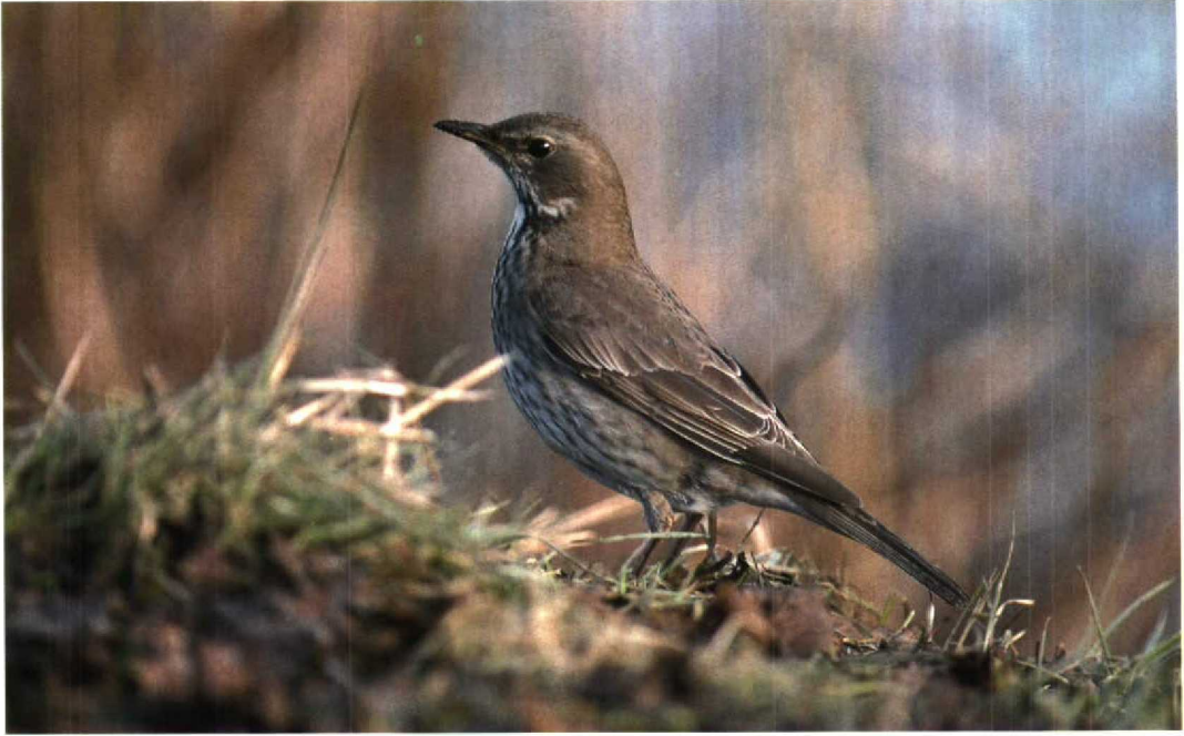
100 Zwartkeellijster / Black-throated Thrush Turdus ruficollis atrogularis , eerste-winter vrouwtje, Den Helder, Noord-Holland, 12 januari 1996 (René Pop)

dag reeds verdwenen. Het mannetje Ringsnaveleend A. collaris van Blokkersdijk, Antwerpen, bleef nog de gehele periode aanwezig. Wilde Witoogeenden A. nyroca vebleven nog te Duffel, Antwerpen, tot 13 februari (op 19 februari te Pulle, Antwerpen); op Blokkersdijk op 11 februari; te Rotselaar, Brabant, van 11 tot 17 maart; en te Kallo-Doel, Oost-Vlaanderen (twee) op 17 maart. De eerste Kleine Topper A. affinis voor België was een eerste-winter mannetje dat van 15 tot 25 februari verbleef bij Sint-Kruis-Winkel, Oost-Vlaanderen. Een Rosse Stekelstaart Oxyura jamaicensis zwom op 3 maart bij Neerharen, Limburg. De eerste Zwarte Vrouwen Milvus migrans vlogen over Schulen, Limburg, op 22 maart en over Bertem, Brabant, op 30 maart. Er werden niet minder dan 66 Rode Vrouwen M. milvus waargenomen waarvan er 35 overvlogen tussen 24 en 27 februari. Op 4 februari vloog een adulte Zeearend Haliaeetus albicilla boven het spaarbekken te Merkem-Woumen, West-Vlaanderen, en op 11 februari pleisterde een onvolwassen vogel bij Mol, Antwerpen. Een ongedetermineerde arend Aquila trok op 9 maart over Blokkersdijk. De eerste Visarenden Pandion haliaetus verschenen te Latour, Luxemburg, van 27 tot 29 maart; te Lier op 28 maart; en te Beerse, Antwerpen, op 31 maart. Een bijzonder vroeg vrouwtje Roodpootvalk Falco vespertinus vloog op 31 maart over Meerhout, Antwerpen; enkele dagen later volgden nog twee andere waarnemingen in Vlaanderen. Slechtvalken F. peregrinus deden