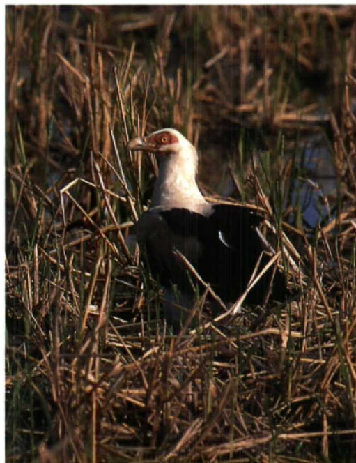
42 Swallow-tailed Bee-eater / Zwaluwstaartbijeneter Merops hirundineus , Casino Cycle Track, Serrekunda, The Gambia, 6 March 1995 (Roy de Haas) 43 Palm-nut Vulture / Palmgier Gypohierax angolensis , Casino Cycle Track, Serrekunda, The Gambia, 27 February 1995 (Roy de Haas) 44 Black Egrets / Zwarte Reigers Egretta ardesiaca , Casino Cycle Track, Serrekunda, The Gambia, 27 February 1995 (Roy de Haas)