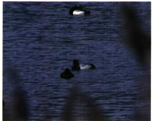
59-60 Kleine Topper / Lesser Scaup Aythya affinis , mannetje, Veere, Zeeland, 11 december 1994 61 Kleine Topper / Lesser Scaup Aythya affinis , mannetje, Veere, Zeeland, december 1994 62 Kleine Topper / Lesser Scaup Aythya affinis , mannetje, Veere, Zeeland, 1 april 1995

het kenmerkende vleugelpatroon op video vast te leggen. Vervolgens werd de aanwezigheid van de vogel per semafoon en vogellijn bekendgemaakt. In het weekend daarna konden enkele 100en vogelaars de Kleine Topper bekijken.