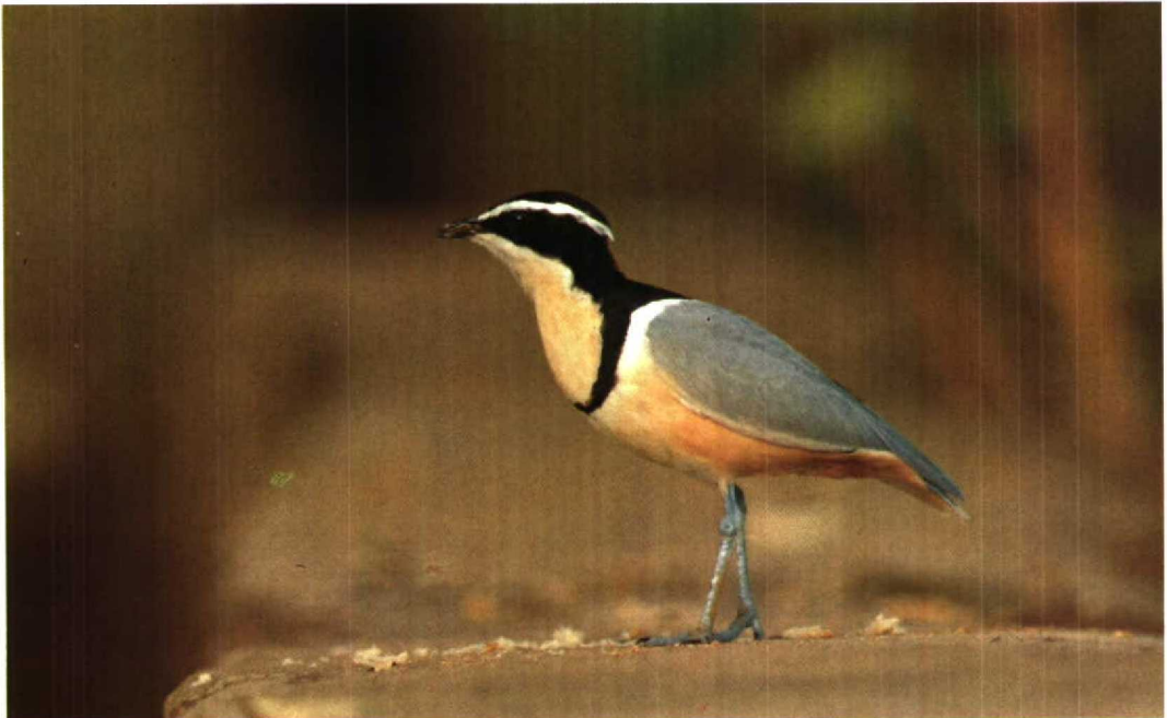
46 Egyptian Plover / Krokodilwachter Pluvianus aegyptius , Parc National du Niokolo Koba, Senegal, 7 February 1989 (Dirk de Moes)