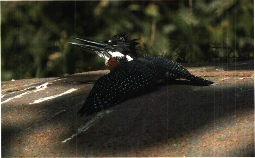
45 Giant Kingfisher / Afrikaanse Reuzenijsvogel Megaceryle maxima , Abuko, The Gambia, 24 January 1989 (Dirk de Moes)