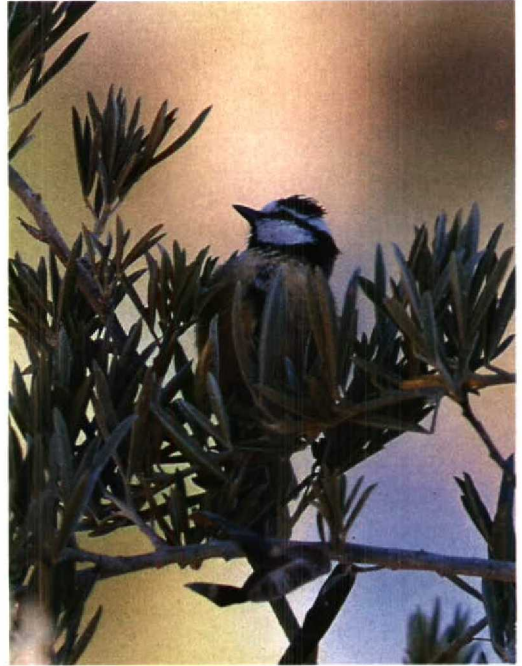
76 Tenerife Blue Tit / Tenerifepimpelmees Parus (caeruleus) teneriffae , Tenerife, Canary Islands, July 1988 (Oscar V Endtz)

Alström & Olsson (1992) identified several reasons why males may not respond to the play-back of songs of conspecific individuals: 1 the individual is in a stage in the breeding cycle where competition is less harmful to its breeding