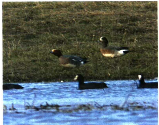
65 Hybride smient / hybrid wigeon Anas , Deventer, Overijssel, 6 maart 1994

De vogel leek veel op een Amerikaanse Smient en werd als zodanig nog een 10-tal dagen na de ontdekking gemeld. Deze soort kan echter worden uitgesloten op grond van de grijsbruine mantel, rug en achterflank en de 'vierkante' vorm van de op de bovenkop eindigende geelwitte voorhoofdsvek. Bij een Amerikaanse Smient zijn de mantel en de rug bruinachtig en de flanken uniform roodbruin zonder grijs, loopt de voorhoofdsvek verder en in een punt door op de bovenkop en is het groen op de kop beperkt tot een groene 'veeg' rond en achter het oog (Madge & Burn 1988, Harris et al 1989). De vorm van de voorhoofdsvek en de vrij grote hoeveelheid groen op de kop komen het meest overeen met de be-