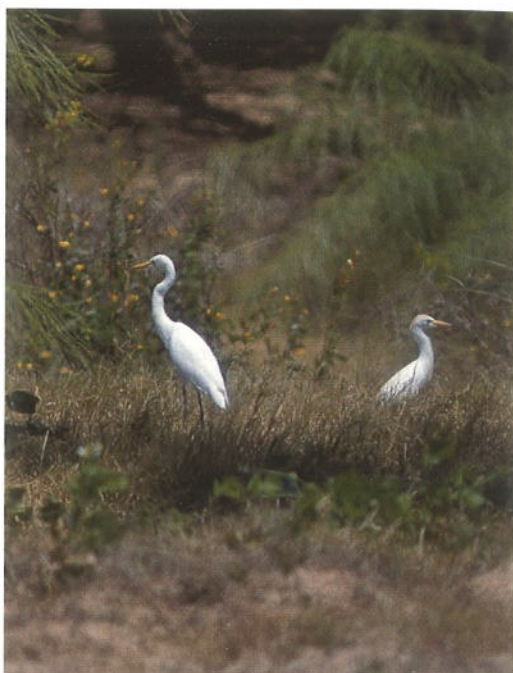
86 Hawk Owl / Sperweruil Surnia ulula , Gribskov, Sjælland, Denmark, March 1996 (Felix Heintzenberg) 87 Intermediate Egret / Middelste Zilverreiger Egretta intermedia and Cattle Egret / Koereiger Bubulcus ibis , Rabil Lagoon, Boavista, Cape Verde Islands, 22 March 1996 (Theo Bakker/Cursorius) 88 Sociable Lapwing / Steppekievit Chettusia gregaria , Lopik, Utrecht, the Netherlands, April 1996 (Marten van Dijk)