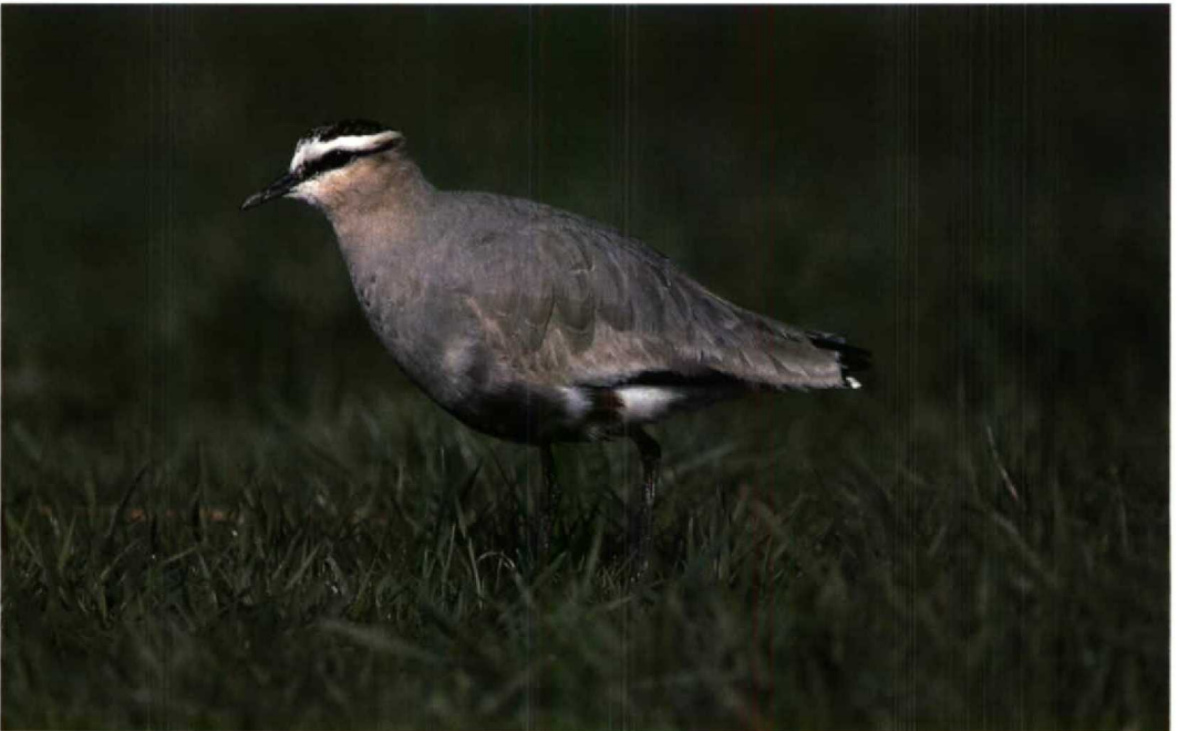
92 Steppekievit / Sociable Lapwing Chettusia gregaria , Lopik, Utrecht, april 1996