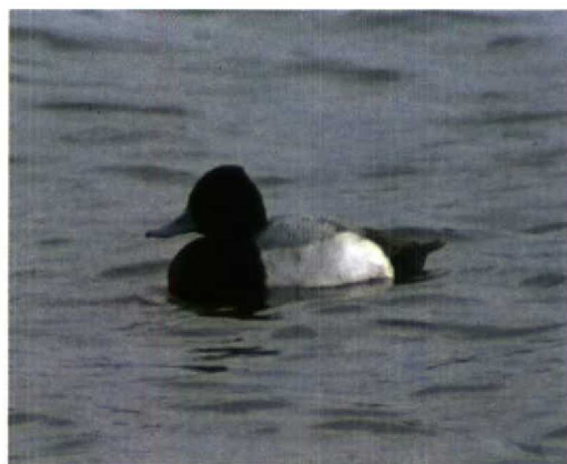
101 Witstuitbarmsijs / Arctic Redpoll Carduelis hornemanni , Bergen, Noord-Holland, 24 februari 1996 102 Kleine Topper / Lesser Scaup Aythya affinis , male, Sint-Kruis-Winkel, Oost-Vlaanderen, februari 1996

maart (één) en vanaf 27 maart (twee), en op 25 maart bij Latour (twee). Bij Baarle, Oost-Vlaanderen, verbleef van 29 februari tot 4 maart een ontsnapt vrouwtje Langstaartroodmus Uragus sibiricus . Op 22 februari werd een Witstuitbarmsijs Carduelis hornemanni gevangen in Putte-Kapellen, Antwerpen.