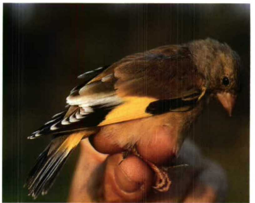
67 Pink-backed Pelican / Kleine Pelikaan Pelecanus rufescens , Lauwersmeer, Groningen, 22 September 1989 (René Pop) 68 Desert Finch / Vale Woestijnvink Rhodospiza obsolata , male, IJmuiden, Noord-Holland, 30 December 1989 (Arnoud B van den Berg) 69 White-cheeked Starling / Witoorspreeuw Sturnus cineraceus , Breskens, Zeeland, 4 May 1995 (Tobi Koppejan) 70 White-shouldered Starling / Mandarijnspreeuw Sturnus sinensis , De Bilt, Utrecht, 12 April 1996 (Arnoud B van den Berg) 71 Lazuli Bunting / Lazuligors Passerina amoena , first-summer male, Maasvlakte, Zuid-Holland, 6 May 1985 (René Pop) 72 Oriental Greenfinch / Chinese Groenling Carduelis sinica , male, Amsterdamse Waterleidingduinen, Noord-Holland, 26 September 1994 (Tom M van Spanje)