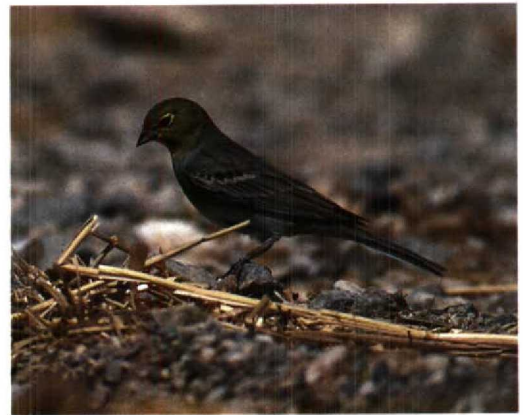
80 Laughing Gull / Lachmeeuw Larus atricilla , Sunderland, Tyne & Wear, England, February 1996 (Steve Young/Birdwatch) 81 Verreaux's Eagle / Zwarte Arend Aquila verreauxii , Wadi Rum, Jordan, 2 April 1996 (Ronald de Lange) 82 Lesser Scaup / Kleine Topper Aythya affinis , male, Tyttenhanger Gravel Pits, St Albans, Hertfordshire, England, April 1996 (Steve Young/Birdwatch) 83 Redhead / Roodkoopeend Aythya americana , male, Bleasby Gravel Pits, Nottinghamshire, England, March 1996 (Steve Young/Birdwatch) 84 American Coot / Amerikaanse Meerkoet Fulica americana , Stodmarsh, Kent, England, April 1996 (David Tipling) 85 Cinereous Bunting / Smyrnagors Emberiza cineracea , Eilat, Israel, March 1996 (Arie Ouwerkerk)