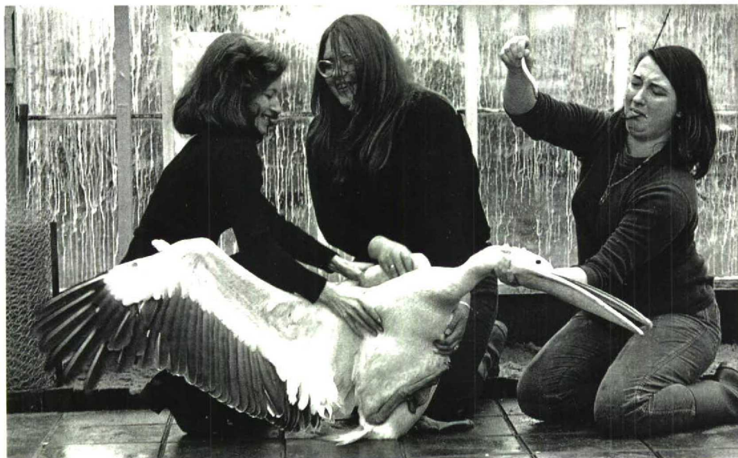
73 Roze Pelikaan / White Pelican Pelecanus onocrotalus , adult, Haarlem, Noord-Holland, 11 augustus 1975

In verband met een oproep van Steve Geelhoed voor informatie ten behoeve van een boek over de avifauna van Zuid-Kennemerland en de Haarlemmermeer, besloot ik onlangs meer informatie in te winnen over de pelikaan van Zuid-Kennemerland. Daarbij kwamen verrassende nieuwe gegevens aan het licht. In het Haarlems Dagblad bleek tweemaal een foto van de vogel te zijn gepubliceerd. Daartoe behoort niet de vluchtfoto die ik mij kon herinneren en die mogelijk in een ander dagblad werd gepubliceerd (cf Zwaaneveld & Ebels 1994; Edward van IJendoorn pers. obs). De eerste foto, van 21