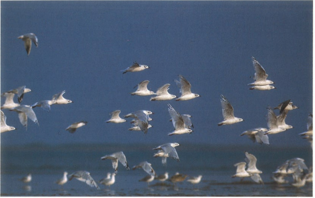
53 Relict Gulls / Relictmeeuwen Larus relictus , at least one fresh second-winter, at least five moulting from second-summer to adult-winter, many others moulting from adult-summer to adult-winter, with one Black-headed Gull / Kokmeeuw L. ridibundus and Black-tailed Gulls / Japanese Meeuwen L. crassirostris , Happy Island, Hebei, China, September 1994 (Felix Heintzenberg) 54 Relict Gulls / Relictmeeuwen Larus relictus with Black-headed Gulls / Kokmeeuwen L. ridibundus and Black-tailed Gulls / Japanese Meeuwen L. crassirostris , Happy Island, Hebei, China, September 1994 (Felix Heintzenberg)