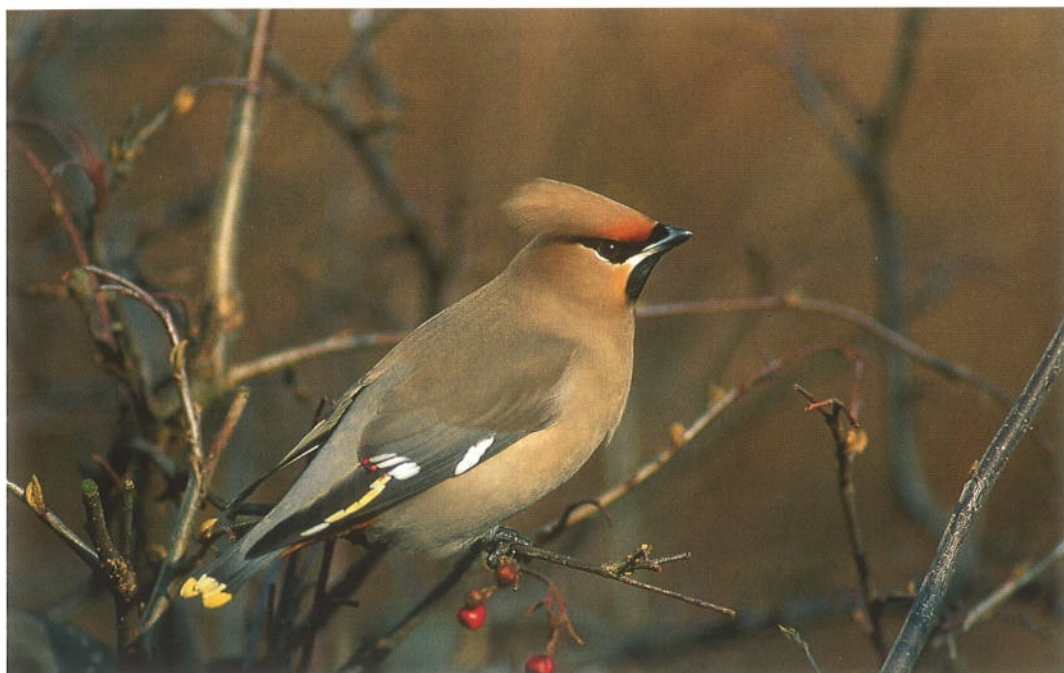
98 Pestvogel / Bohemian Waxwing Bombycilla garrulus , Papendrecht, Zuid-Holland, maart 1996