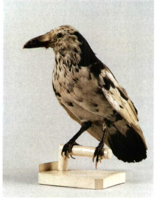
74-75 'White Raven' / 'Witte Raaf' Corvus corax varius , pied morph (collected at Faeroes, 1840), Nationaal Natuurhistorisch Museum (NNM), Leiden, Zuid-Holland, the Netherlands, February 1996 (NNM, Leiden)

as a mutant of the black Raven, with the depigmentation being due to one gene only, which was recessive (according to the general rule for albinistic mutants). As a result, pied individuals have always been in the minority compared with all-black birds.