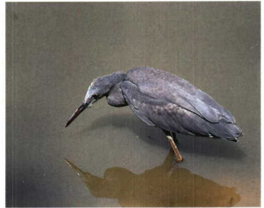
47 Swamp Alseonax / Moerasvliegenvanger Muscicapa aquatica , Jakhaly, The Gambia, 5 March 1995 (Roy de Haas) 48 Senegal Coucal / Senegalese Spoorkeekoek Centropus senegalensis , Abuko, The Gambia, 7 March 1995 (Roy de Haas) 49-50 Red-throated Bee-eaters / Roodkeelbijeneters Merops bulocki , Basse, The Gambia, 3 March 1995 (Roy de Haas) 51 Western Bluebill / Roodborstblauwsnavel Spermophaga haematina , Abuko, The Gambia, 7 March 1995 (Roy de Haas) 52 Black Egret / Zwarte Reiger Egretta ardesiaca , Casino Cycle Track, Serrekunda, The Gambia, 27 February 1995 (Roy de Haas)