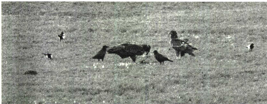
93 Zeearenden / White-tailed Eagles Haliaeetus albicilla , Hellegatsplaten, Zuid-Holland, 13 januari 1996 (Gerard L. Ouweeneel)

KRAANVOGELS TOT ALKEN In de periode vanaf 16 februari werden c 4000 Kraanvogels Grus grus geteld, met als piekperiode 8 tot 14 maart (3700). Een mannetje Kleine Trap Tetrax tetrax verbleef van 19 tot 27 maart bij de Inlagen van Westenschouwen, Zeeland. De Grote Trap Otis tarda van Rolde, Drenthe, was daar nog aanwezig tot 9 maart, terwijl er op 20 februari één langsvloog bij Kijkduin, Zuid-Holland. Groot was de verbazing toen op de plek van de Kleine Trap bij Westenschouwen van 30 maart tot 1 april een Griël Burhinus oediacnemus opdook. Deze vogel had een rode ring aan de rechterpoot en is waarschijnlijk afkomstig van de Engelse populatie waarvan veel vogels geringd zijn. Recordaantallen Goudplevieren Pluvialis apricaria (34 000) en Kieviten Vanellus vanellus (110 000) werden op 21 maart geteld bij Breskens. Een Steppekievit Chettusia gregaria verbleef vanaf 3 april bij Lopik. De eerste Ijslandse Grutto's Limosa limosa islandica werden gemeld op 31 maart (vijf) bij de Flaauwers Inlaag, Zeeland. Rosse Franjepoten Phalaropus fulicaria werden waargenomen op 17 februari bij Lauwersoog en op 20 februari bij Katwijk, Zuid-Holland. Kleine Burgemeesters Larus glaucooides werden gezien op 11 februari bij Ool, Limburg, op 18 februari in De Putten bij Camperduin en langs de Maas bij Waalwijk, Noord-Brabant, op 28 februari bij Katwijk en op 29 februari bij