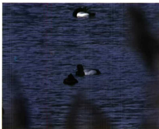
59-60 Kleine Topper / Lesser Scaup Aythya affinis , mannetje, Veere, Zeeland, 11 december 1994 61 Kleine Topper / Lesser Scaup Aythya affinis , mannetje, Veere, Zeeland, december 1994 62 Kleine Topper / Lesser Scaup Aythya affinis , mannetje, Veere, Zeeland, 1 april 1995

het kenmerkende vleugelpatroon op video vast te leggen. Vervolgens werd de aanwezigheid van de vogel per semafoon en vogellijn bekendgemaakt. In het weekend daarna konden enkele 100en vogelaars de Kleine Topper bekijken.