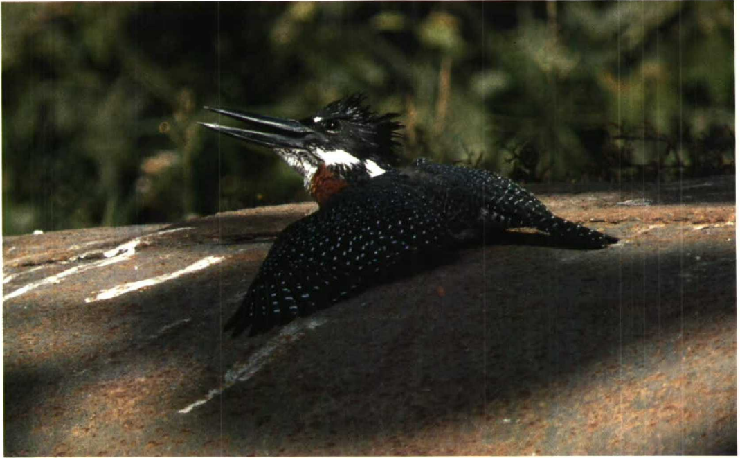
45 Giant Kingfisher / Afrikaanse Reuzenijsvogel Megaceryle maxima , Abuko, The Gambia, 24 January 1989