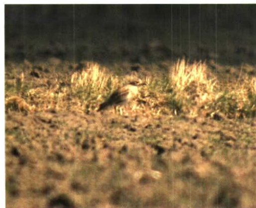
94 Kleine Trap / Little Bustard Tetrax tetrax , Westenschouwen, Zeeland, 24 maart 1996 95 Middelste Bonte Specht / Middle Spotted Woodpecker Dendrocopos medius , Vijlenerbos, Limburg, februari 1996 96 Witkopgors / Pine Bunting Emberiza leucocephalos , mannetje, Oirschotse Heide, Noord-Brabant, maart 1996 97 Griel / Stone-curlew Burhinus oedicnemus , Westenschouwen, Zeeland, 31 maart 1996

februari; Diepenbeek, Limburg op 24 maart; Jabbeke van 12 februari tot 2 maart; Rijkevorsel, Antwerpen, van 18 tot 24 maart; en Vorseelaar, Antwerpen, op 15 februari. Een bijzonder vroege Purperreiger Ardea purpurea trok op 21 maart over Wenduine, West-Vlaanderen. Er werden in totaal 35 Ooievaars Ciconia ciconia gemeld. Er verbleven meer Wilde Zwanen Cygnus cygnus dan in andere winters; het grootste aantal uit een totaal van 76 was een groep van 26 bij Neerpelt, Limburg. Er moeten in Vlaanderen c 20 (ongeringde!) Dwergganzen Anser erythropus hebben gezeten, waarvan c 10 te Boekhoutte-Watervliet-Bassevelde, Oost-Vlaanderen; vier in de Uitkerkse Polders, West-Vlaanderen; drie te Hoeke, West-Vlaanderen; twee te Damme, West-Vlaanderen; en één te Dudzele-Zeebrugge, West-Vlaanderen; een absoluut Belgisch recordjaar. In de Uitkerkse Polders