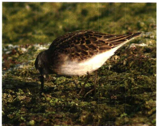
14-15 Mystery stint / raadselstrandloper Calidris , juvenile, Groote Keeten, Noord-Holland, 24 September 1995 16-19 Mystery stint / raadselstrandloper Calidris , juvenile, Groote Keeten, Noord-Holland, 23 September 1995