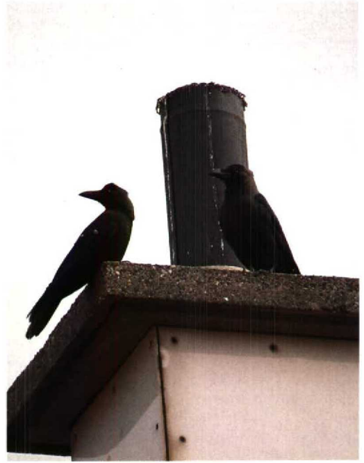
4 Huiskraai / House Crow Corvus splendens , tweede-kalenderjaar, Hoek van Holland, Zuid-Holland, 30 juni 1994 (Arnoud B van den Berg) 5 Huiskraaien / House Crows Corvus splendens , derde-kalenderjaar, Hoek van Holland, Zuid-Holland, 17 augustus 1995 (Arnoud B van den Berg) 6 Huiskraai / House Crow Corvus splendens , Renesse, Zeeland, 27 november 1995 (Eric Koops) 7 Huiskraai / House Crow Corvus splendens , Dunmore East Harbour, Waterford, Ierland, november 1974 (John Lovatt)