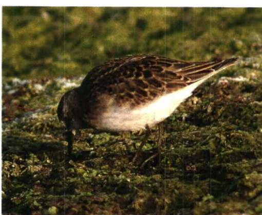
14-15 Mystery stint / raadselstrandloper Calidris , juvenile, Groote Keeten, Noord-Holland, 24 September 1995 16-19 Mystery stint / raadselstrandloper Calidris , juvenile, Groote Keeten, Noord-Holland, 23 September 1995