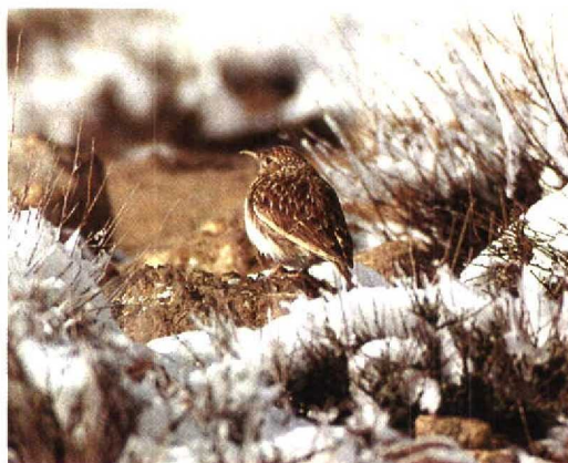
9 Dupont's Lark / Duponts Leeuwerik Chersophilus duponti , Tizi-n-Taghatine, Ouarzazate, Morocco, 7 January 1994 (Dick Meijer)

Cramp, S 1988. The birds of the Western Palearctic 5. Oxford.