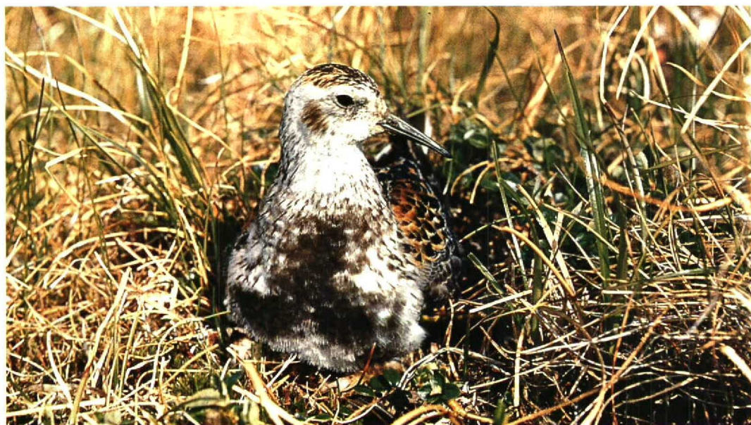
8 Rock Sandpiper / Beringstrandloper Calidris ptilocnemis , male, Chukotsky Peninsula, Russia, 9 July 1979

Some species have penetrated into north-eastern Siberia rather recently from both western and eastern directions. For example, Little Stint C minuta is the most numerous and characteristic arctic sandpiper of western and central Siberia, but it is an uncommon and irregular breeding bird east of the Indigirka River, though it is known from all northern Siberian coasts up to the Bering Strait. Baird's Sandpiper C bairdii is a typical American high arctic species but also breeds in