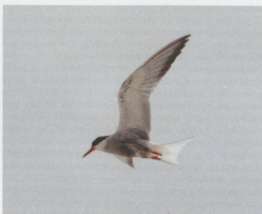
mystery photograph 58. Solution in next issue