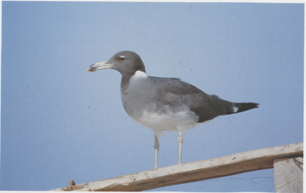
283 Sooty Gull / Hemprichs Meeuw Larus hemprichii , Siyal Islands, Egypt, 25 April 1985 (Peter L Meininger) 284 Blackstart / Zwartstaart Cercomela melanura , Wadi Aideib, Gebel Elba, Egypt, April 1985 (Peter L Meininger) 285 Pallid Harrier / Steppekiekendief Circus macrourus , adult male, Wadi Aideib, Gebel Elba, Egypt, April 1985 (Peter L Meininger)