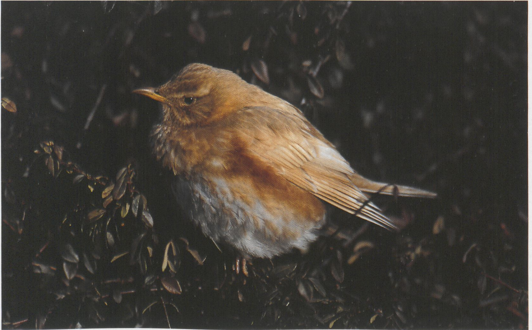
294 Leucistic Redwing / leucistische Koperwiek Turdus iliacus , Midsland, Terschelling, Friesland, 29 January 1996