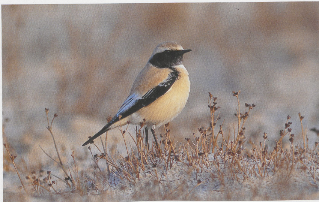
317 Woestijntapuit / Desert Wheatear Oenanthe deserti , Den Helder, Noord-Holland, 12 november 1996