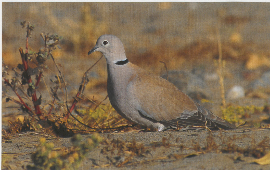
282 African Collared Dove / Izabeltortel Streptopelia roseogrisea , Gebel Abu Hadid (north of Gebel Elba), Egypt, 15 March 1995 ( Dina Ali & Rafik Khalil )