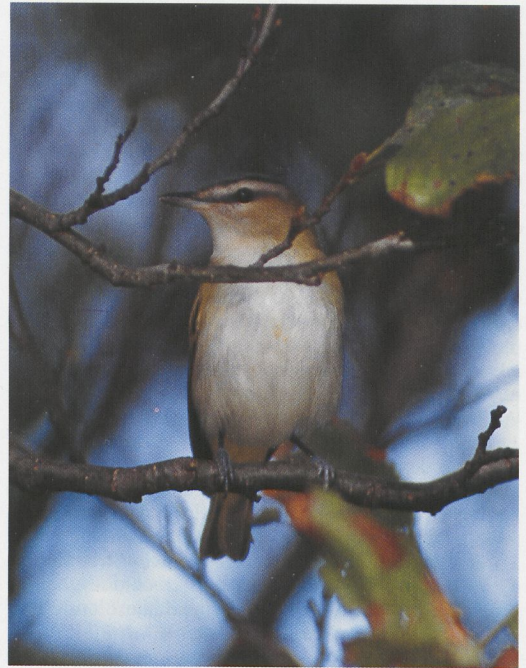
325 Kwak / Night Heron Nycticorax nycticorax , juveniel met Tsjechische ring, Enkhuizen, Noord-Holland, 5 oktober 1996 (Johan Buisman) 326 Roodoogvireo / Red-eyed Vireo Vireo olivaceus , Lange Paal, Vlieland, Friesland, 6 oktober 1996 (Hans Gebuis)

gezien te Blankenberge, West-Vlaanderen; Oostende (twee); Sint-Idesbald, West-Vlaanderen; Wenduine, West-Vlaanderen; en Zeebrugge. Wellicht ging het soms om dezelfde vogel(s). Het totaal aantal gemelde Vale Stormvogeltjes Oceanodroma leucorhoa komt op c 42, met een maximum van 10 te Oostende op 29 oktober. Kuifaalscholvers Phalacrocorax aristotelis werden waargenomen te Oostende op 1 (drie) en 2 oktober; te Koksijde op 2 oktober; te Wenduine op 29 oktober en te Nieuwpoort, West-Vlaanderen, op 1 november. De enige Kwak Nycticorax nycticorax vloog op 19 oktober over Kessel, Antwerpen. Kleine Zilverreigers Egretta garzetta werden nog waargenomen te Dudzele-Zeebrugge (de gehele periode); te Knokke-Zwin, West-Vlaanderen (maximaal 19 op 16 oktober); en in de Uitkerkse Polder, West-Vlaanderen, op 23 november. Deze periode waren Grote Zilverreigers E alba talrijker met waarnemingen te Daknam-Lokeren, West-Vlaanderen, op 4 oktober; bij Meise, Vlaams-Brabant, op 9 oktober; the Harchies, Hainaut, vanaf 23 oktober; te Kalmthout, Antwerpen, en bij Geel, Antwerpen, op 25 oktober; te Zandhoven, Antwerpen, op 10 november; en bij Wilssele, Vlaams-Brabant, van 16 tot ten minste 24 november. Late Purperreigers Ardea purpurea vlogen op 14 oktober over Wuustwezel, Antwerpen, en op 15 oktober (drie) over Heist op den Berg, Antwerpen. Een mannetje Blauwvleugeltaling Anas dis-