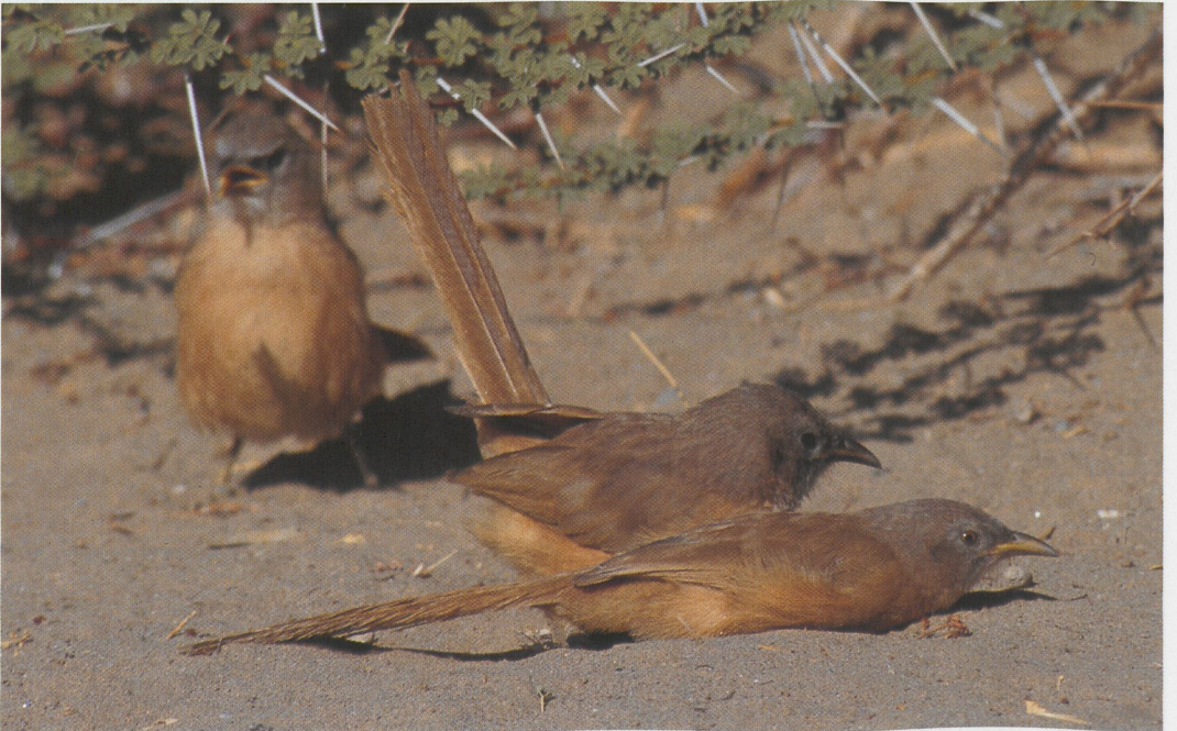
280 Fulvous Babblers / Bruingele Babbelaars Turdoides fulvus , Wadi Aukau, Gebel Elba, Egypt, 3 February 1994 (Dina Ali & Rafik Khalil)