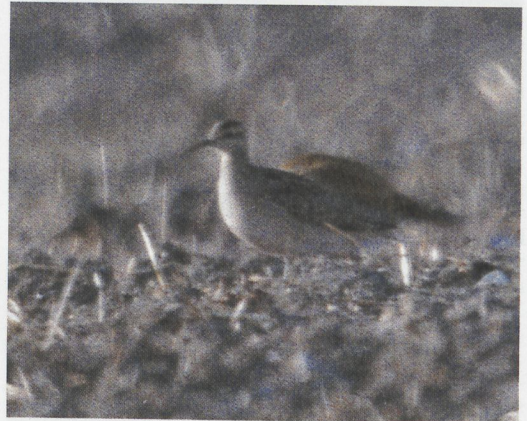
307 Pectoral Sandpiper / Gestreepte Strandloper Calidris melanotos , Circeo, Latium, Italy, November 1996 (Marco Trotta) 308 White-tailed Lapwing / Witstaartkievit Chettusia leucura , Vendicari, Siracusa, Italy, 14 October 1996 (Valerio Cappello) 309 Long-billed Dowitcher / Grote Grijsje Snip Limnodromus scolopaceus , Örtöfta, Skåne, Sweden, 8 October 1996 (Felix Heintzenberg) 310 Little Curlew / Kleine Regenwulp Numenius minutus , Sallvik, Ahvenanmaa, Finland, 1 October 1996 (Harry Lehto)

10-11 November. Up to seven wintering Spotted Eagles Aquila clanga in France included four in the Camargue (two from 7 November, three from 16 November and four from 8 December) and one at Etang de Lindre, Moselle, from 22 November. In the evening of 12 August, a male Lesser Kestrel Falco naumanni was seen on Helgoland, Schleswig-Holstein. A Lanner Falcon F biarmicus was seen in the Camargue on 5 December. In Israel, up to two Purple Gallinules Porphyrio porphyrio were present during November and early December at km 19-20 north of Eilat. The first American Coot Fulica americana for England which was discovered on 16 April at Stodmarsh, Kent, and had disappeared during spring, was seen again at the same spot on 9 November (cf Dutch Birding 18: 92-94, 1996). Two adults and a juvenile Siberian White Crane