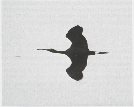
289-290 Zwarte Ibis / Glossy Ibis Plegadis falcinellus , Haarlem, Noord-Holland, 5 november 1994 (Arnoud B van den Berg)

langrijkste waarnemingen van groepen in de periode 1900-96.