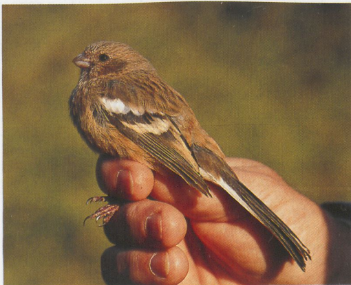
292 Langstaartroodmus / Long-tailed Rosefinch Uragus sibiricus , Zandvoort, Noord-Holland, 28 oktober 1991