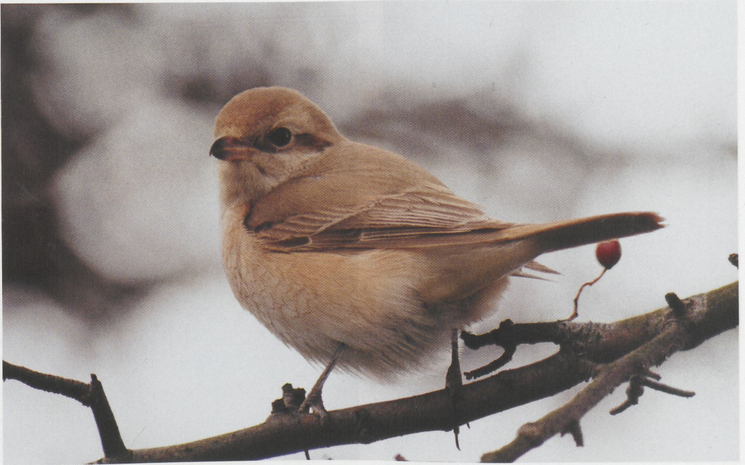
305 Isabelline Shrike / Izabelklauwier Lanius isabellinus , first-winter male, Stocks Reservoir, Lancashire, England, November 1996 306 Indigo Bunting / Indigogors Passerina cyanea , first-winter male, Ramsey, Pembrokeshire, Wales, October 1996