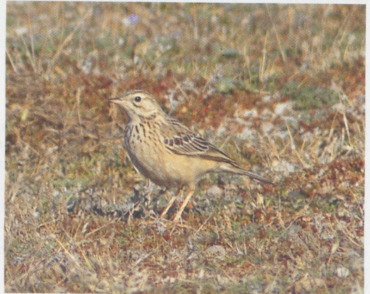
319 Bonte Tapuit / Pied Wheatear Oenanthe pleschanka , eerste-winter mannetje, Stroe, Wieringen, Noord-Holland, 17 november 1996 (Ruud E Brouwer) 320 Grote Burgemeester / Glaucous Gull Larus hyperboreus , Brouwersdam, Zuid-Holland, 20 oktober 1996 (Paul Knolle) 321 Aziatische Roodborsttapuit / Siberian Stonechat Saxicola torquata maura , Den Helder, Noord-Holland, 12 oktober 1996 (Ruud E Brouwer) 322 Witkopgors / Pine Bunting Emberiza leucocephalos , vrouwtje, Katwijk aan Zee, Zuid-Holland, november 1996 (Marc Guyt) 323 Withalsvliegenvanger / Collared Flycatcher Ficedula albicollis , eerste-winter mannetje, Terschelling, Friesland, 12 oktober 1996 (Arie Ouwerkerk) 324 Mongoolse Pieper / Blyth's Pipit Antus godlewskii , Maasvlakte, Zuid-Holland, 26 oktober 1996 (Arnoud B van den Berg)