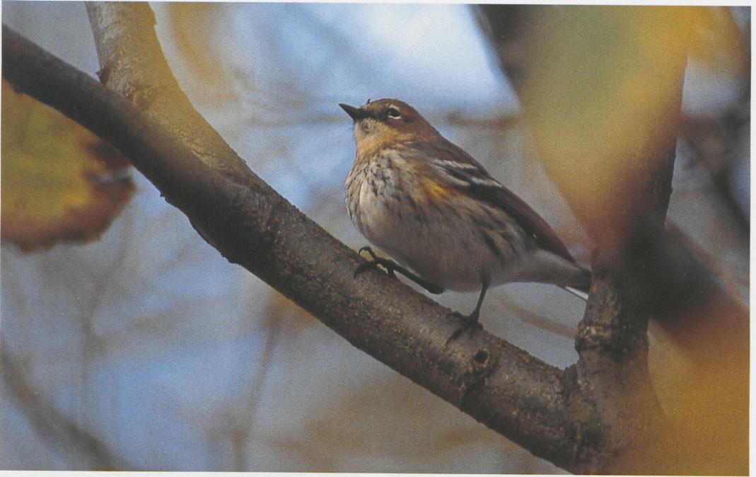
315 Mirtezanger / Myrtle Warbler Dendroica coronata , adult mannetje, Vlieland, Friesland, 14 oktober 1996 (René Pop)