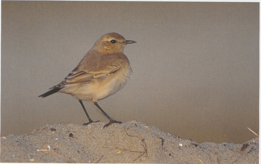
316 Izabeltapuit / Isabelline Wheatear Oenanthe isabellina , Maasvlakte, Zuid-Holland, 23 oktober 1996