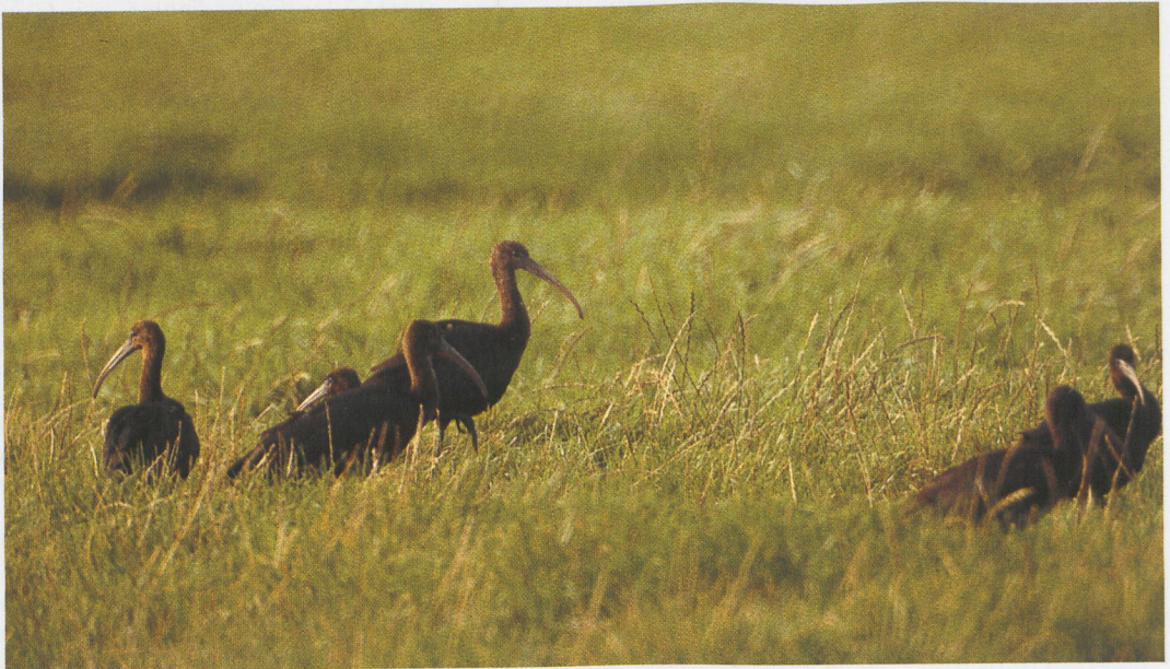
291 Zwarte Ibissen / Glossy Ibises Plegadis falcinellus , Stitswerd, Groningen, oktober 1994

Een gewaagde theorie over de herkomst van Zwarte Ibissen in West-Europa werd gepubliceerd door Wille (1986) en Vanpraet & Wille (1988). Zij gaan ervan uit dat Zwarte Ibissen in West-Europa van Noord-Amerikaanse herkomst zijn. Volgens Wille (1986) zouden de West-Europese Zwarte Ibissen via de Britse eilanden