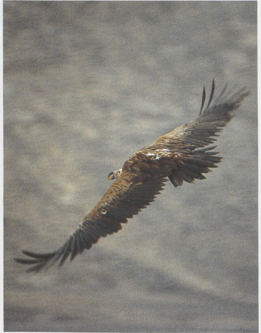
286 Rosy-patched Bush Shrike / Roodbuikklawier Rhodophoneus cruentus , Wadi Aukau, Gebel Elba, Egypt, 6 February 1994 ( Dina Ali & Rafik Khalil ) 287 Lappet-faced Vulture / Oorgier Torgos tracheliotus , Wadi Aideib, Gebel Elba, Egypt, April 1985 ( Peter L Meininger ) 288 Lappet-faced Vultures / Oorgieren Torgos tracheliotus , Wadi Aideib, Gebel Elba, Egypt, April 1985 ( Peter L Meininger )