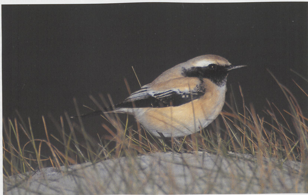
318 Woestijntapuit / Desert Wheatear Oenanthe deserti , Den Helder, Noord-Holland, november 1996 (Harm Niesen)