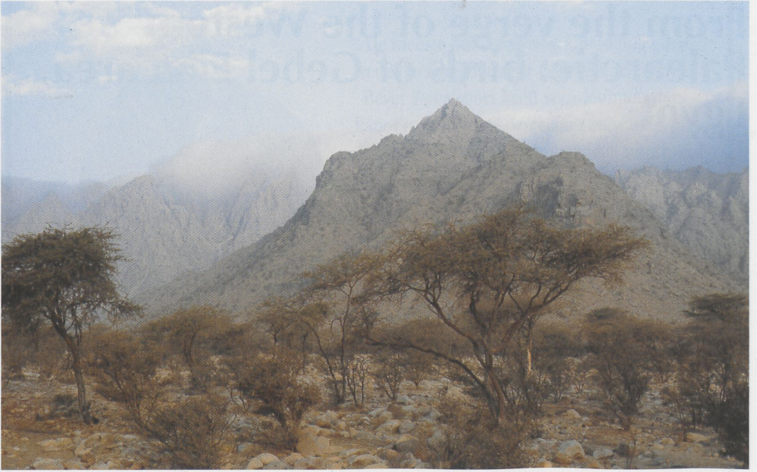
279 Mist-covered summit of Gebel Elba, Wadi Aideib, Gebel Elba, Egypt, April 1985 (Peter L Meininger)