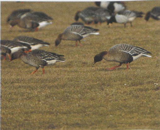
295 Taiga Bean Geese / Taigarietganzen Anser fabalis , Almere, Flevoland, the Netherlands, 15 February 1986 (Arnoud B van den Berg) 296 Tundra Bean Geese / Toendarietganzen Anser serrirostris , Hellevoetsluis, Zuid-Holland, the Netherlands, February 198 (René Pop) 297 Tundra Bean Goose / Toendarietgans Anser serrirostris (left) and Pink-footed Goose / Kleine Rietgans A brachyrhynchus , Elahuizen, Friesland, the Netherlands, 8 February 1996 (Arnoud B van den Berg)

1976). Others, like Buturlin (1935), Berry (1938) and Coombes (1951), agreed with Naumann's (1842) view and remained convinced that Taiga and Tundra Bean Geese are distinct taxa.