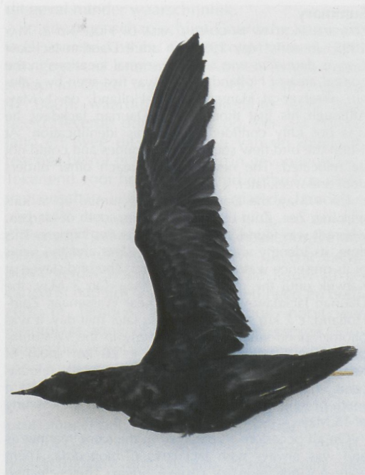
226-227 Bulwers Stormvogel / Bulwer's Petrel Bulweria bulwerii (aanvankelijk levend aan boord van schip in haven te Europoort, Zuid-Holland, in november 1993), Natuurmuseum Rotterdam (collectie NMR 9997-00205), Rotterdam, Zuid-Holland, 20 januari 1994; top van p10 afgebroken