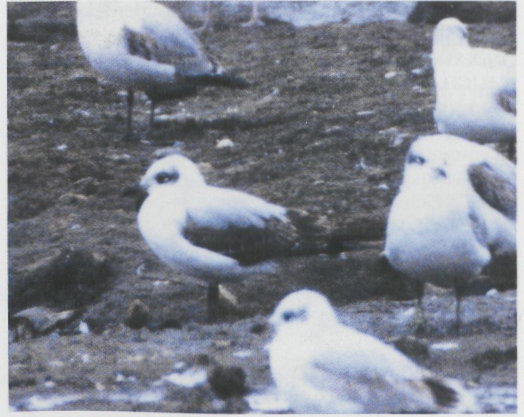
230-231 Mediterranean Gull / Zwartkopmeeuw Larus melanocephalus , first-year with all-dark wings, Le Portel, Pas-de-Calais, France, 20 February 1995