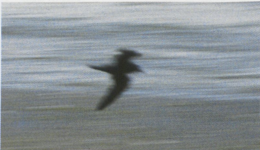
220-221 Bulwers Stormvogel / Bulwer's Petrel Bulweria bulwerii , Westplaat bij Maasvlakte, Zuid-Holland, 21 augustus 1995

Jouanins komt voor in de Indische Oceaan en werd éénmaal met zekerheid in het West-Pale-