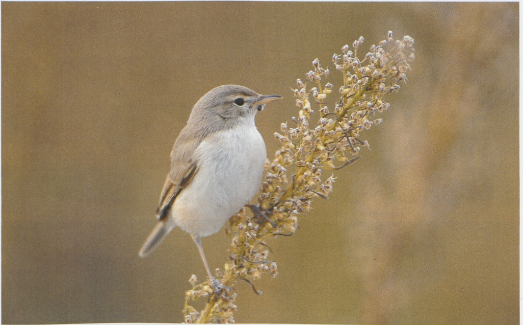
248 Booted Warbler / Kleine Spotvogel Hippolais caligata , Rheindelta-Vorarlberg, Austria, September 1996 (Georg Juen)