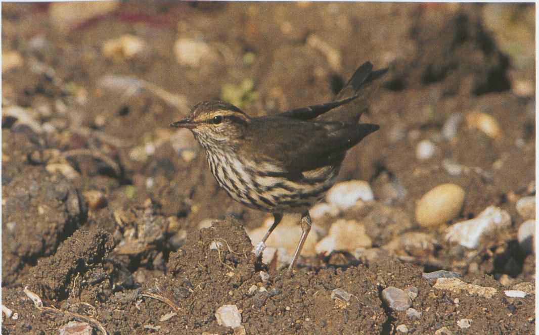
249 Northern Waterthrush / Noordse Waterlijster Seiurus noveboracensis , Portland Bill, Dorset, England, 17 October 1996