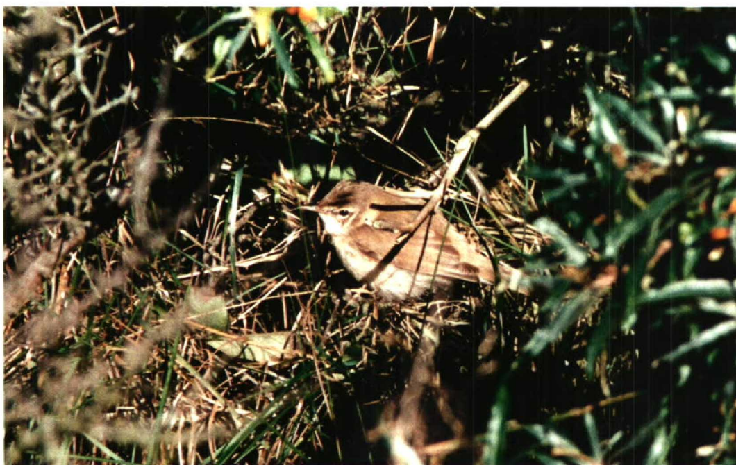
10 Veldrietzanger / Paddyfield Warbler Acrocephalus agricola , Vlieland, Friesland, 18 september 1994 (Sander Lagerveld)

Nederland. De zes voorgaande gevallen betroffen alle ringvangsten en dateren van 2 oktober 1971 te Laaxum, Friesland (van IJzendoorn & Westhof 1985, met foto's); 23 oktober 1982 te Makkum, Friesland (de Vries 1987, met foto); 13 oktober 1984 eveneens te Makkum (de Jong 1985, met foto's); 26 september 1986, eveneens op Vlieland (Terpstra 1988); 8 september 1987 te Zuidland, Zuid-Holland (Oudebeek 1988, met foto); en 8 september 1987 langs de Oostvaardersdijk, Flevoland (foto in van den Burg et al 1987) (cf van den Berg & Bosman 1995).