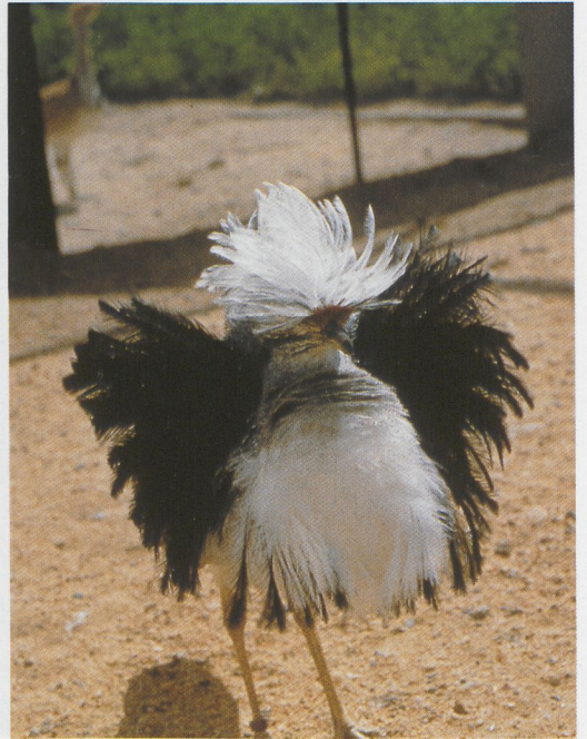
237 Macqueen's Bustard / Oostelijke Kraagtrap Chlamydotis macqueenii , male at start of feather erection, Taif, Saudi Arabia (National Wildlife Research Center Photo Library) 238 Houbara Bustard / Westelijke Kraagtrap Chlamydotis undulata undulata , male at start of feather erection, Taif, Saudi Arabia (National Wildlife Research Center Photo Library) 239 Macqueen's Bustard / Oostelijke Kraagtrap Chlamydotis macqueenii , male with full feather erection during display run, Taif, Saudi Arabia (National Wildlife Research Center Photo Library)