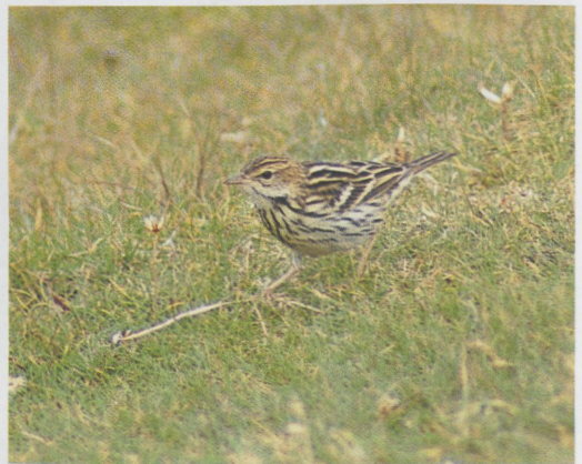
250 Little Swift / Huisgierzwaluw Apus affinis , near Bolonia, Andaluc a, Spain, 24 July 1996 (Diederik Kok) 251 hybrid Black Kite x Common Buzzard / hybride Zwarte Wouw x Buizerd Milvus migrans x Buteo buteo , juvenile, Tolfa, Rome, Italy, August 1996 (Andrea Corso & Roberto Gildi) 252 Paddyfield Warbler / Veldrietzanger Acrocephalus agricola , Fair Isle, Shetland, Scotland, 19 September 1996 (Roger Riddington) 253 Arctic Warbler / Noordse Boszanger Phylloscopus borealis , Fair Isle, Shetland, Scotland, 8 September 1996 (Roger Riddington) 254 Desert Wheatear / Woestijntapuit Oenanthe deserti , male, Den Helder, Noord-Holland, the Netherlands, 3 November 1996 (Ren  Pop) 255 Pechora Pipit / Petsjorapieper Anthus gustavi , Fair Isle, Shetland, Scotland, 20 September 1996 (Roger Riddington)