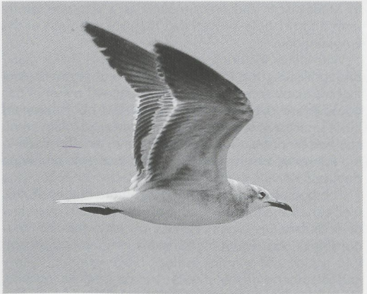
Mystery photograph 57. Solution in next issue

dense mixed geese flocks, have created confusion about the alleged presence of Lesser Canada Goose in the Netherlands. Until 1 January 1995, however, only one individual has been docu-