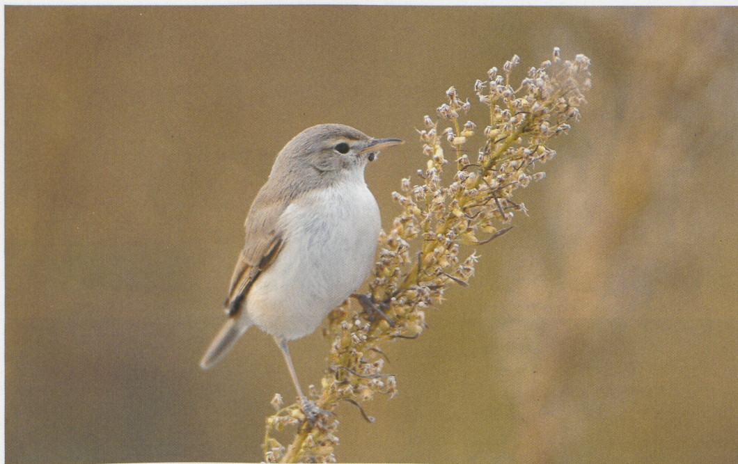
248 Booted Warbler / Kleine Spotvogel Hippolais caligata , Rheindelta-Vorarlberg, Austria, September 1996 (Georg Juen)