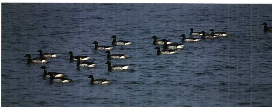
31 Provençaalse Grasmus / Dartford Warbler Sylvia undata , Westkapelle, Zeeland, 1 december 1995 32 Dwerggors / Little Bunting Emberiza pusilla , Katwijk, Zuid-Holland, 25 december 1995 33 Humes Bladkoning / Hume's Yellow-browed Warbler Phylloscopus humei , Den Haag, Zuid-Holland, 29 december 1995 34 Witstuitbarmsijs / Arctic Redpoll Carduelis hornemanni exillipes , Lopik, Utrecht, 5 februari 1996 35 Witbuikrotganzen / Pale-bellied Brent Geese Branta bernicla hrota , Neeltje Jans, Zeeland, 2 januari 1996