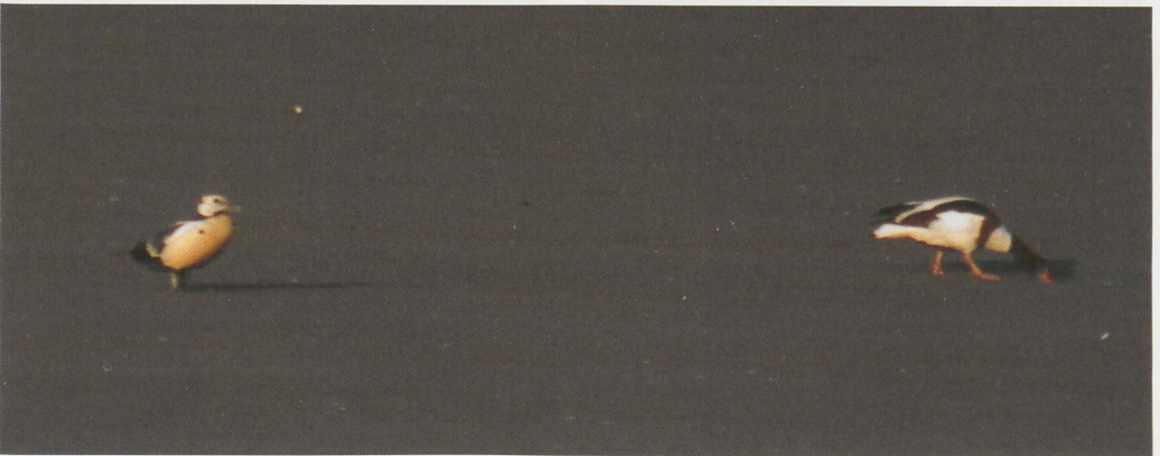
214 Grote Grijs Snip / Long-billed Dowitcher Limnodromus scolopaceus , Workumerwaard, Friesland, 11 augustus 1996 ( Sander Lagerveld ) 215 Witvleugelstern / White-winged Black Tern Chlidonias leucopterus , Houtribsluizen, Lelystad, Flevoland, 30 juli 1996 ( Piet Munsterman ) 216 Stellers Eider / Steller's Eider Polysticta stelleri en Bergeend / Common Shelduck Tadorna tadorna , Verdrongen Land van Saeftinge, Zeeland, 11 juni 1996 ( Patrick Buys )

Brabant; Schilde, Antwerpen (twee); Scholen (twee); Sint-Pieters-Kapelle, West-Vlaanderen (vijf); en Zemst-Laar, Antwerpen. Te Antwerpen-Hooge Maay, Antwerpen, vertoefde op 30 juni een mannetje Kaneeltaling Anas cyanoptera . Zwarte Wouwen Milvus migrans werden nog waargenomen te Frasnes-lez-Buissenal, Hainaut; Glabbeek, Brabant; Melsbroek, Brabant; en Munte, Oost-Vlaanderen. De enige Rode Wouw M. milvus van deze periode vloog op 1 juni over Sint-Pieters-Voeren, Oost-Vlaanderen. Naar bijna jaarlijkse gewoonte verbleef op 3 en 4 juni alweer een Slangenarend Circaetus gallicus op het schietveld te Brecht-Wuustwezel, Antwerpen. Op 5 juni vloog een Grauwe Kiekendief Circus pygargus over Zandvoorde. Van 7 tot 9 juni en op 24 juli verbleef een Visarend Pandion haliaetus te Brecht-Wuustwezel en op 16 juni één te Harchies. Roodpootvalken Falco vespertinus bleven schaars met waarnemingen te Tienen, Brabant, en te