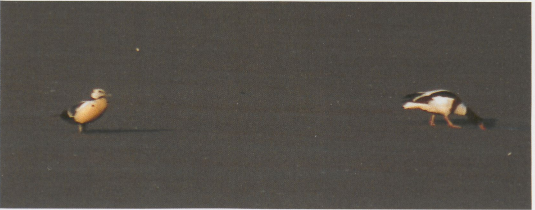
214 Grote Grijs Snip / Long-billed Dowitcher Limnodromus scolopaceus , Workumerwaard, Friesland, 11 augustus 1996 215 Witvleugelstern / White-winged Black Tern Chlidonias leucopterus , Houtribsluizen, Lelystad, Flevoland, 30 juli 1996 216 Stellers Eider / Steller's Eider Polysticta stelleri en Bergeend / Common Shelduck Tadorna tadorna , Verdrongen Land van Saeftinge, Zeeland, 11 juni 1996

Brabant; Schilde, Antwerpen (twee); Scholen (twee); Sint-Pieters-Kapelle, West-Vlaanderen (vijf); en Zemst-Laar, Antwerpen. Te Antwerpen-Hooge Maay, Antwerpen, vertoefde op 30 juni een mannetje Kaneeltaling Anas cyanoptera . Zwarte Wouwen Milvus migrans werden nog waargenomen te Frasnes-lez-Buissenal, Hainaut; Glabbeek, Brabant; Melsbroek, Brabant; en Munte, Oost-Vlaanderen. De enige Rode Wouw M. milvus van deze periode vloog op 1 juni over Sint-Pieters-Voeren, Oost-Vlaanderen. Naar bijna jaarlijkse gewoonte verbleef op 3 en 4 juni alweer een Slangenarend Circaetus gallicus op het schietveld te Brecht-Wuustwezel, Antwerpen. Op 5 juni vloog een Grauwe Kiekendief Circus pygargus over Zandvoorde. Van 7 tot 9 juni en op 24 juli verbleef een Visarend Pandion haliaetus te Brecht-Wuustwezel en op 16 juni één te Harchies. Roodpootvalken Falco vespertinus bleven schaars met waarnemingen te Tienen, Brabant, en te