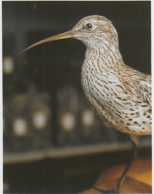
182 Dunbekwulp / Slender-billed Curlew Numenius tenuirostris , Hallum, Friesland, 27 december 1889; ZMA, juni 1987 (Edward J van IJzendoorn) 183 Dunbekwulp / Slender-billed Curlew Numenius tenuirostris , Friesche Wadden, Friesland, 16 januari 1925; FNM, juni 1986 (Edward J van IJzendoorn) 184 Haakbekken / Pine Grosbeaks Pinicola enucleator , Rotterdam, Zuid-Holland, 5 december 1909 (boven) en 8 december 1909 (onder); ZMA, december 1995 (Jan van der Laan)