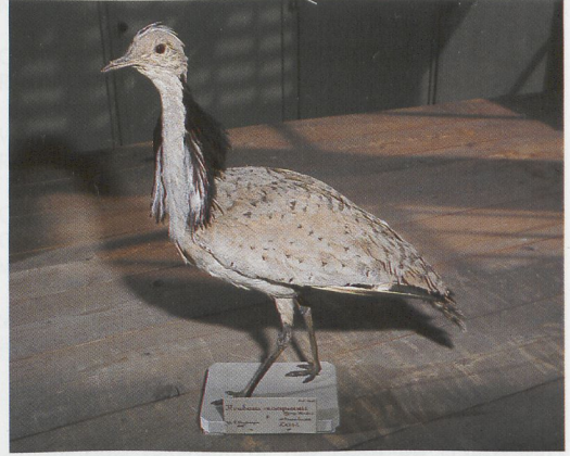
169 Siberische Taling / Baikale Teal Anas formosa , Damwoude, Friesland, 29 november 1948; FNM, juni 1986 (Edward J van IJzendoorn) 170 Amerikaanse Zee-eend / Black Scoter Melanitta americana , De Cocksdorp, Texel, Noord-Holland, 2 november 1967; ZMA, december 1995 (Jan van der Laan) 171 Steppekiekendief / Pallid Harrier Circus macrourus , Noordwijk, Zuid-Holland, 23 april 1866; NNM, juni 1987 (Edward J van IJzendoorn) 172 Oostelijke Kraagtrap / Macqueen's Bustard Chlamydotis (undulata) macqueenii , Zeist, Utrecht, 10 december 1850; NNM, april 1983 (Arnoud B van den Berg)

vermeld als 'vondst'), gevangen of geringd, wordt dit vermeld. Daarnaast worden verwijzingen gegeven (voor zover mogelijk), waar zich naast het CDNA-archief documentatie bevindt, zoals in literatuur of collecties. Van gevallen na 1950 wordt (voor zover mogelijk) verwezen naar het jaarverslag waarin het geval als aanvaard is opgenomen. Alleen bij vondsten en ringvangsten die niet zijn aanvaard, wordt in de meeste gevallen de reden van afwijzing vermeld. Tenslotte zijn van sommige soorten ook gevallen van na 1 januari 1980 onder de loep genomen als daar aanleiding toe was ten gevolge van veranderende inzichten die tijdens de herziening naar voren kwamen. Alleen gevallen die niet langer aan-