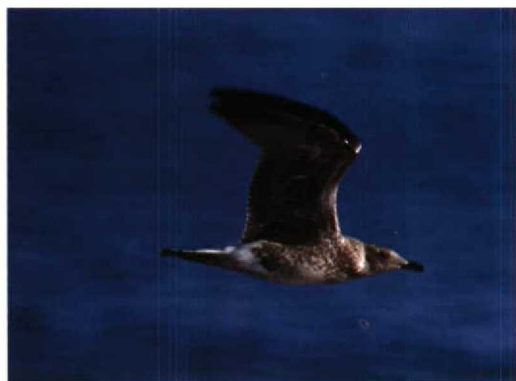
13 Atlantic Yellow-legged Gull / Atlantische Geelpoot-meeuw Larus cachinnans atlantis , juvenile, near Azores, at 37:16 N, 24:47 W, 27 August 1994 (Colm C Moore)

a Yellow-legged Gull and another pelagic bird was noted: a Bulwer's Petrel Bulweria bulwerii , which was floating on the water and apparently feeding on organisms attached to the underneath of a small piece of polystyrene, was forced to fly as the gull settled to pick vigorously at the piece of flotsam (cf Moore 1994).