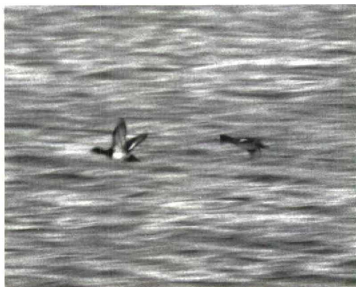
41 Kleine Topper / Lesser Scaup Aythya affinis , mannetje, Lelystad-Haven, Flevoland, 13 januari 1996

dat bovengenoemde waarnemers hun Kleine Topper introkken. Dit zal mede de reden zijn geweest dat de volgende ochtend Jaap en Peter Eerdmans als enige vogelaars in Lelystad-Haven aan het zoeken waren. Ook die ochtend kon de vogel ondanks intensief spoorwerk niet meer worden gevonden. JAAP D EERDMANS & RUUD M VAN DONGEN