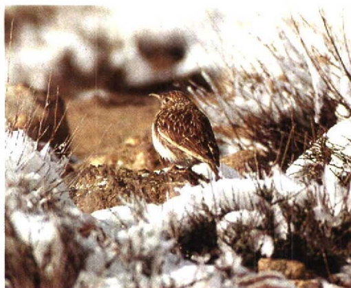
9 Dupont's Lark / Duponts Leeuwerik Chersophilus duponti , Tizi-n-Taghatine, Ouarzazate, Morocco, 7 January 1994 (Dick Meijer)

Cramp, S 1988. The birds of the Western Palearctic 5. Oxford.