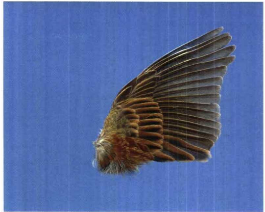
12 Cirlgors / Cirl Bunting Emberiza cirlus , tweede-kalenderjaar mannetje (gevonden te Hoogerheide, Noord-Brabant, 13 maart 1995), Zoologisch Museum Amsterdam, Noord-Holland, juni 1995 (Louis A van der Laan)

van den Berg, A B & Bosman, C A W 1996. Lijst van