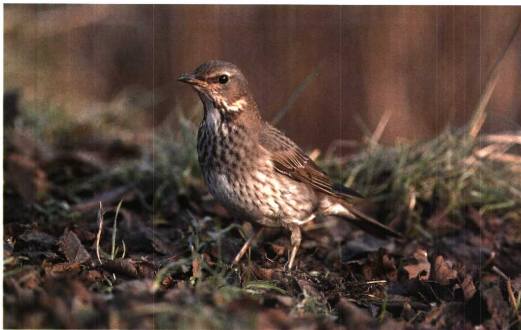
28 Zwartkeellijster / Black-throated Thrush Turdus ruficollis atrogularis , eerste-winter vrouwtje, Den Helder, Noord-Holland, 12 januari 1996 29 Kleine Zilverreiger / Little Egret Egretta garzetta , Serooskerke, Zeeland, 29 december 1995 30 Grote Pieper / Richard's Pipit Anthus richardi , Eijsden, Limburg, december 1995