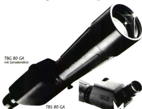
TBS 80 GA mit Geradenblick