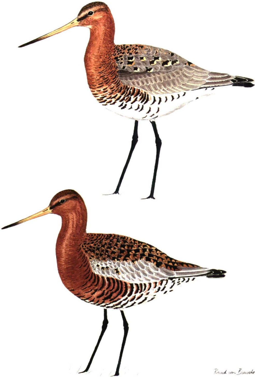
FIGUUR 1 IJslandse Grutto / Icelandic Black-tailed Godwit Limosa limosa islandica , mannetje in adult zomerkleed (onder), en Grutto / Black-tailed Godwit L. limosa , mannetje in adult zomerkleed (boven) (Ruud F. J. van Beusekom)