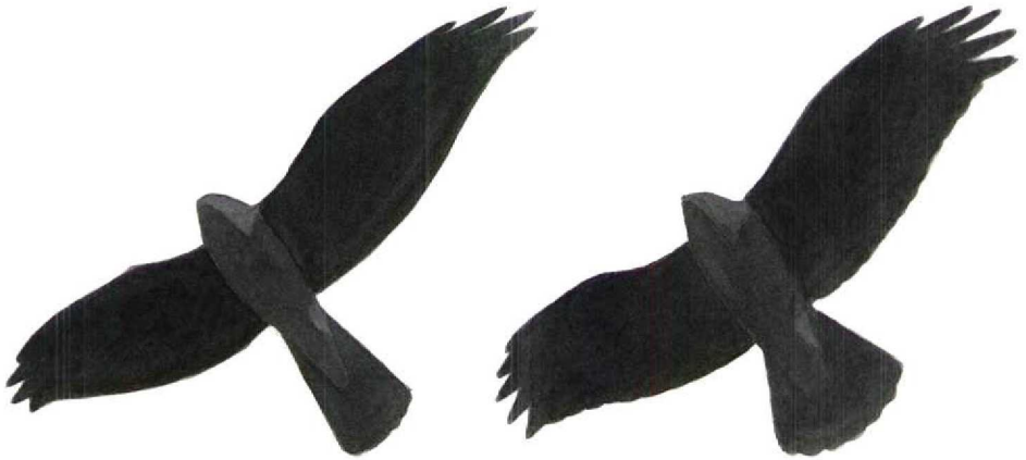
FIGURE 2 Silhouettes of soaring Montagu's Circus pygargus / Pallid C macrourus (left) and Hen Harrier C cyaneus (Dick Forsman). Note differences in width of wing and structure of hand/wing-tip. In Hen, whole wing appearing equally broad with rounded tip, whereas wing in Montagu's/Pallid widest at carpal with hand tapering clearly towards tip

riers, possible confusion with Hen Harrier C cyaneus cannot be overlooked. The risk of misidentification is particularly great wherever or whenever Hen Harriers occur in places where Pallid and Montagu's Harriers are more likely, eg, in northern Africa and the Middle East. Experienced birders should, as a rule, have no problems identifying the heavier Hen, with its broad and round-tipped wings. However, Hen can sometimes be truly difficult to separate from Pallid, a problem largely overlooked in the literature. The most difficult Hens are moulting adult females in late summer/early autumn, showing a pointed wing-tip. Also small and narrow-winged juvenile males, with breast streaking confined to upper breast only, can appear confusingly similar to ringtail Pallids.