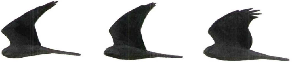
FIGURE 1 General differences in shape between, from left to right, Montagu's Circus pygargus , Pallid C macrourus and Hen Harriers C cyaneus (Dick Forsman). Note long, narrow and pointed hand and small body and long tail of Montagu's compared with more triangular-handed and heavier-bodied Pallid. Hen has broadest wings with rounded tip and bulging trailing edge to arm and rather heavy body. See text for details