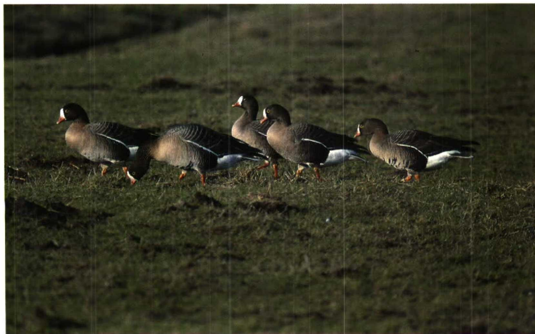
58 Lesser White-fronted Geese / Dwergganzen Anser erythropus , family of 'Limping Lotta', Strijen, Zuidholland, February 1995