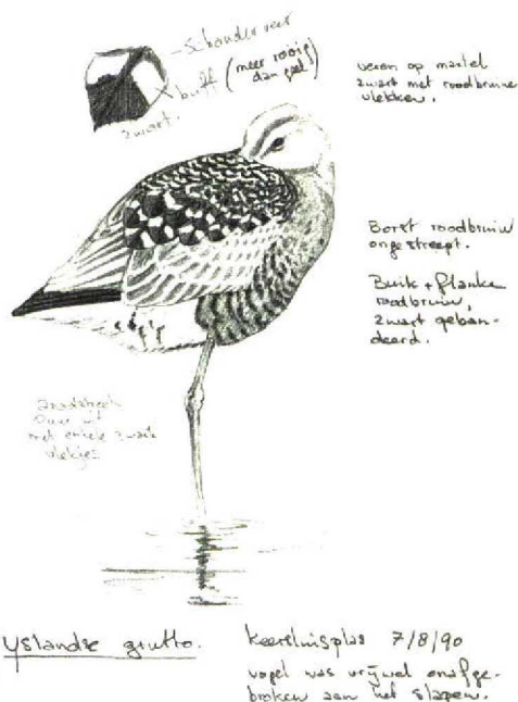
FIGUUR 2 IJslandse Grutto / Icelandic Black-tailed Godwit Limosa limosa islandica , adult zomerkleed, Keersluisplas, Oostvaardersplassen, Flevoland, 7 augustus 1990 (waarneming 24) (Karel A Mauer). Tekening op tertials niet aangebracht