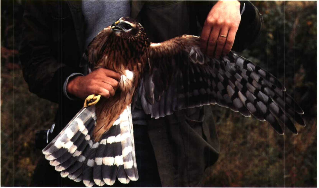
34 Hen Harrier Circus cyaneus , juvenile female, Finland, September 1982. Compare with adult female Pallid Harrier in plate 38 and note especially differences in primary barring and wing formula. Pattern of darkish secondaries can be rather similar, but head appearing generally more streaked in Hen 35 Montagu's Harrier Circus pygargus , typical adult female, Kazakhstan, 18 September 1993. Note evenly barred primaries, typical pattern of secondaries and coarsely rufous-patterned underwing-coverts and axillaries. Note also typical head pattern and rufous bars on outer rectrices