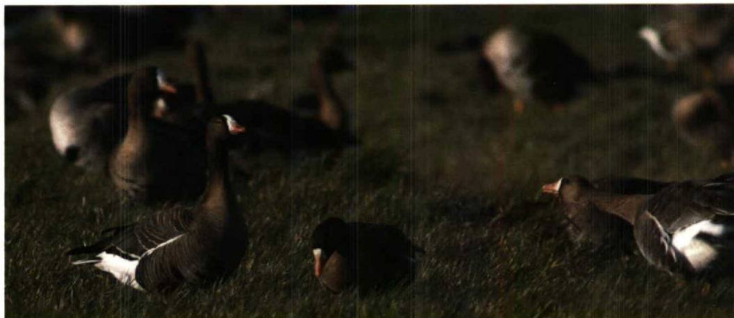
59 Lesser White-fronted Goose / Dwerggans Anser erythropus and White-fronted Geese / Kolganzen A albifrons , Goedereede, Zuidholland, 12 February 1995 (Arnoud B van den Berg)

Zuidholland might soon become the most reliable and most convenient places to see this species in Europe. The Hortobágy, Hungary, is the only other European birding area where regularly winter flocks are reported such as, for example, 350 in November 1992 (Dutch Birding 15: 33, 1993) and 140 in early November 1993 (Dutch Birding 16: 33, 1994).