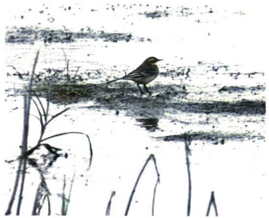
56 Citroenkwikstaart / Citrine Wagtail Motacilla citreola , Eemshaven, Groningen, 5 september 1994 (Eric Koops)

Dit is het vierde geval voor Nederland. Voor een overzicht van de overige Nederlandse geval-