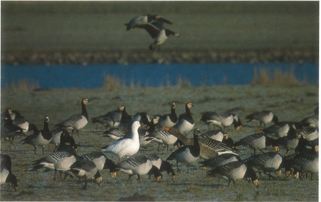
67 Ross' Gans / Ross's Goose Anser rossii , Plaat van Scheelhoek, Stellendam, Zuidholland, januari 1995 (Marten van Dijk)