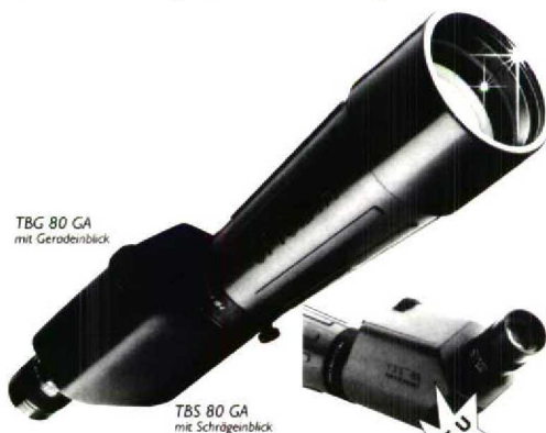
TBG 80 GA mit Geradenblick