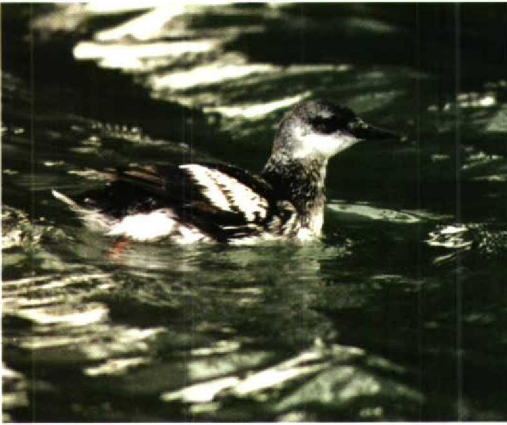
71 Zwarte Zeekoet / Black Guillemot Cephus grylle , West-Terschelling, Terschelling, Friesland, januari 1995