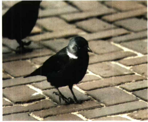
72 Russische Kauw / Russian Jackdaw Corvus monedula soemmerringii , Leiden, Zuidholland, januari 1995

Remiz pendulinus van het seizoen werden opgemerkt op 26 februari langs de Knardijk, Flevoland, op 23 maart (twee) bij het Veerse Meer en op 30 maart in de Brabantse Biesbosch, Noordbrabant. Op 11 januari werd een Notekraker Nucifraga caryocatactes gezien bij het Engelermeer, Noordbrabant. Een Russische Kauw Corvus monedula soemmerringii verbleef een groot deel van de winter in Leiden, Zuidholland. Op 5 februari werden er enkele 10-tallen gezien in de omgeving van Wijster, Drenthe. Beide Huis kraaien C splendens van Hoek van Holland, Zuidholland, blijken de winter te hebben doorstaan, waarschijnlijk op een dieet van patat. Behoorlijk buiten zijn verspreidings-