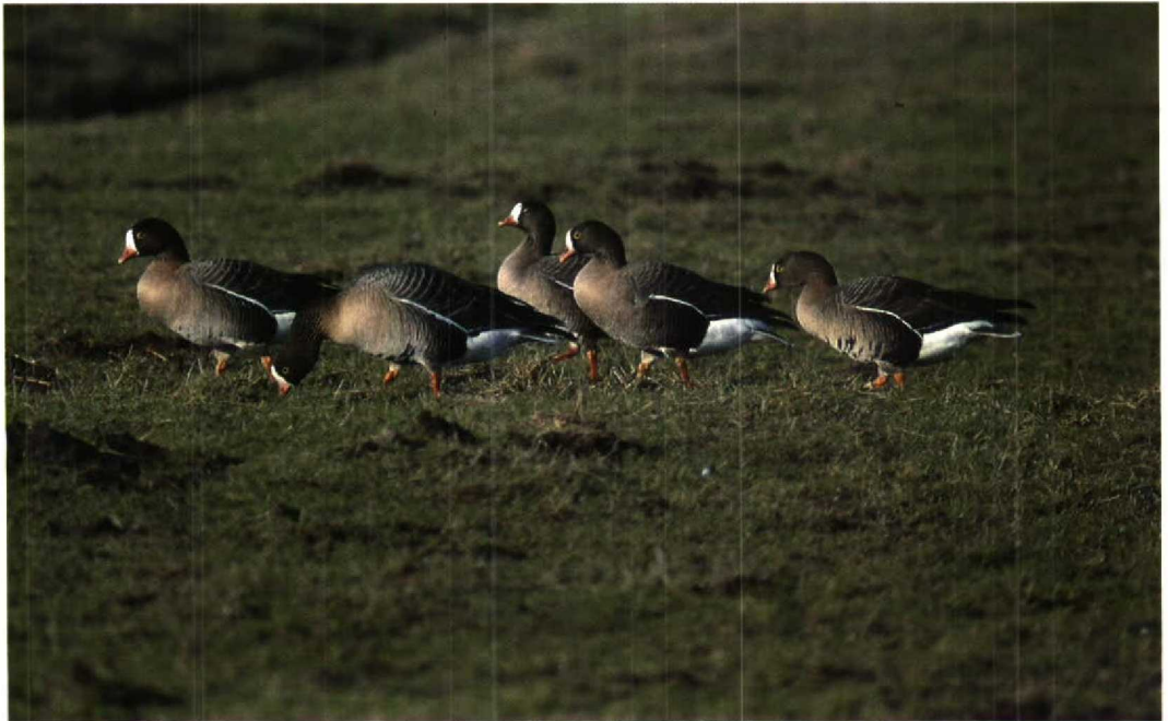
58 Lesser White-fronted Geese / Dwergganzen Anser erythropus , family of 'Limping Lotta', Strijen, Zuidholland, February 1995 (Marten van Dijl)