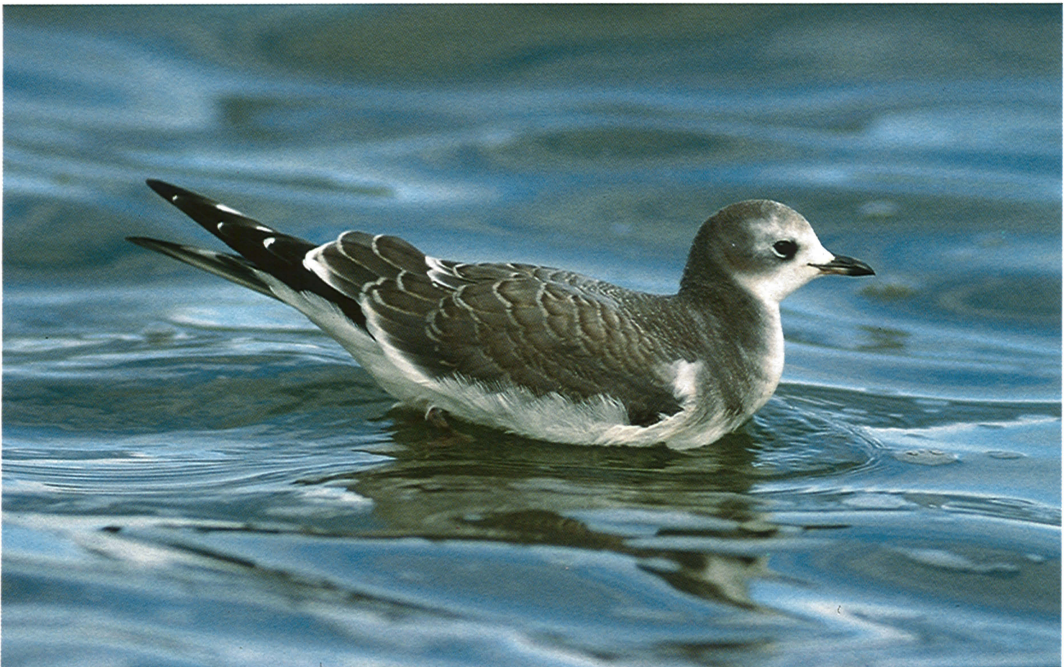
10 Vorkstaartmeeuw / Sabine's Gull Larus sabini, Oostvaardersdijk, Flevoland, september 1990