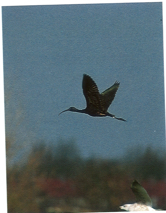
27 Zwarte Ibis / Glossy Ibis Plegadis falcinellus , Haarlem, Noordholland, november 1994 (Piet Munsterman)