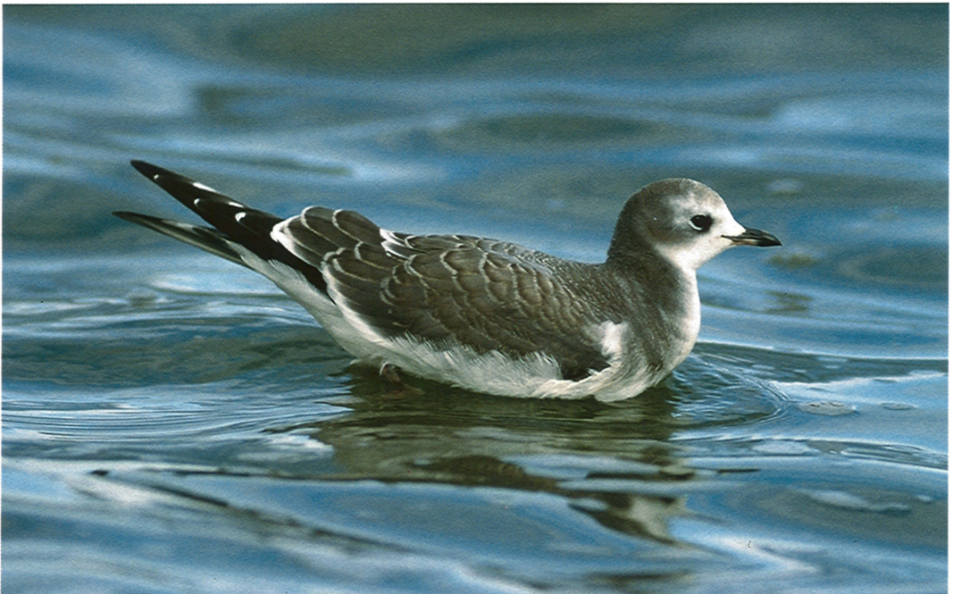
10 Vorkstaartmeeuw / Sabine's Gull Larus sabini, Oostvaardersdijk, Flevoland, september 1990