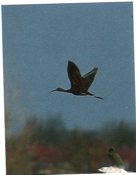
27 Zwarte Ibis / Glossy Ibis Plegadis falcinellus , Haarlem, Noordholland, november 1994 (Piet Munsterman)