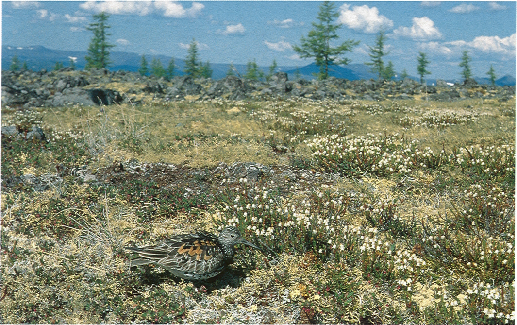
13 Great Knot / Grote Kanoet Calidris tenuirostris , male on second-ever known nest, Koryak Highland, Russia, 14 July 1976