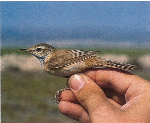
18 Paddyfield Warbler / Veldrietzanger Acrocephalus agricola , first-winter, 22 September 1991, Göksü delta, Turkey (Tom M van der Have)

SIZE & STRUCTURE Slightly smaller than Reed Warbler A scirpaceus . Wing short, shorter than uppertail-coverts. Three rectal bristles.