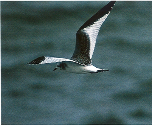
11 Vorkstaartmeeuw / Sabine's Gull Larus sabini , IJmuiden, Noordholland, september 1990 (Piet Munsterman)