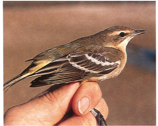
5 Yellow Wagtail Motacilla flava , first-winter female, Ebro Delta, Spain, 15 September 1993 (Raül Aymí). Note short, narrow supercilium and ear-coverts clearly darker than crown. Upperparts typically bicoloured brown and grey 6 Yellow Wagtail Motacilla flava , 'grey-and-white' first-winter (left) and Citrine Wagtail M. citreola , first-winter, Ebro Delta, Spain, 7 September 1991 (Raül Aymí). Note rather similar coloration in upperparts except tips of greater coverts 7 Citrine Wagtail Motacilla citreola , first-winter, Ebro Delta, Spain, 5 September 1991 (Gabriel Gargallo). Note marked contrast between dark upperparts and pure white underparts 8 Yellow Wagtail Motacilla flava , first-winter, Ebro Delta, Spain, 1 October 1993 (Raül Aymí). Note conspicuous white tips to unmoulted greater and median coverts producing double wing-bar recalling Citrine Wagtail M. citreola

samples of birds trapped in late autumn and also varies among years (Christer Persson in litt).