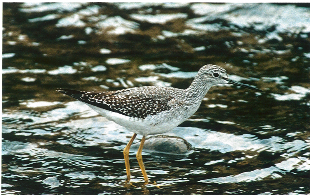
21 Greater Yellowlegs / Grote Geelpootruiter Tringa melanoleuca , Rockliffe, Cumbria, England, October 1994