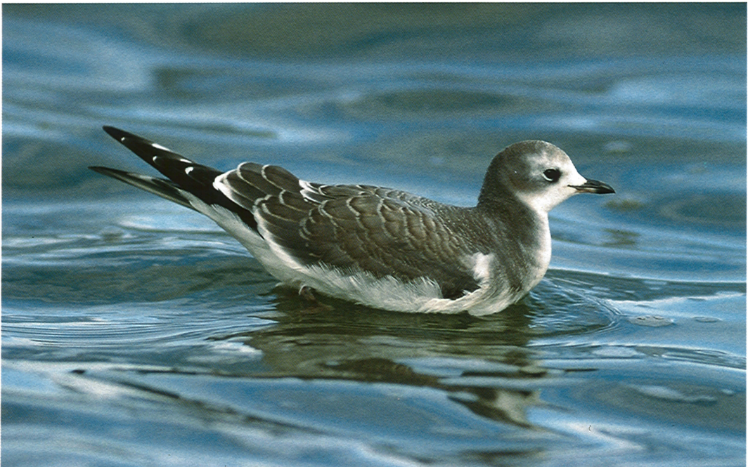
10 Vorkstaartmeeuw / Sabine's Gull Larus sabini, Oostvaardersdijk, Flevoland, september 1990