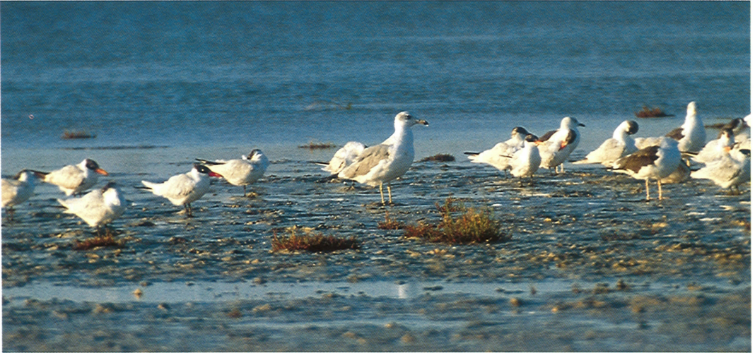
14 Great Black-headed Gull / Reuzenzwartkopmeeuw Larus ichthyaetus with Lesser Black-backed Gulls / Kleine Mantelmeeuwen L. fuscus and Caspian Terns / Reuzensterms Sterna caspia , El Attaya, Kerkennah, Tunisia, 26 February 1994

paler towards tip; on basal edge of dark band also slight dirty-orange wash. Leg greyish-green. VOICE Single, low, slightly nasal oow, lower and clearly different from other gulls' calls.