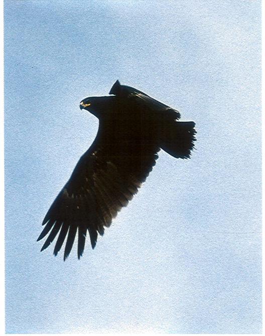
22 Ring-billed Gull / Ringsnavelmeeuw Larus delawarensis , first-winter, Ümminger See, Bochum, Nordrhein-Westfalen, Germany, 24 January 1995 ( Felix Heintzenberg ) 23 Spotted Eagle / Bastaardarend Aquila clanga , Hortobágy, Hungary, 12 December 1994 ( Leo J R Boon ) 24 Blackpoll Warbler / Zwartkopzanger Dendroica striata , Bewl Water, East Sussex, England, December 1994 ( David Tipling ) 25 Spotted Sandpiper / Amerikaanse Oeverloper Actitis macularia , Heppendorf, Nordrhein-Westfalen, Germany, 6 December 1994 ( David Gray )