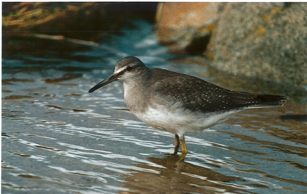
20 Grey-tailed Tattler / Siberische Grijze Ruit Heteroscelus brevipes , Burghead, Grampian, Scotland, December 1994