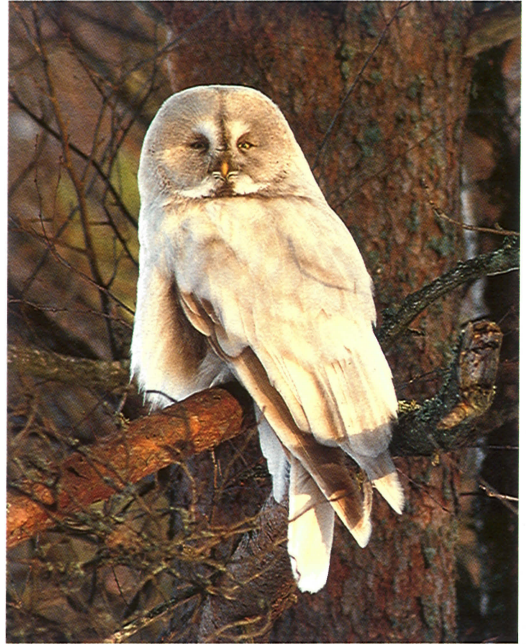
16 Leucistic Great Grey Owl / leucistische Laplanduil Strix nebulosa , Sonkari, Vesanto, Finland, 1 April 1994

During the winter of 1993/94, a late influx of Great Grey Owls occurred in eastern Finland. For instance, up to 10 individuals were found on a single local birding trip and Eagle Owls reported during day-time by non-birders often turned out to be Great Grey Owls. In March 1994, Pentti Alaja reported that Pirkko Siikamäki had found three Great Grey Owls at Sonkari, Vesanto, 60 km west of Kuopio, and that one was a very pale, possibly leucistic individual. We went to see the