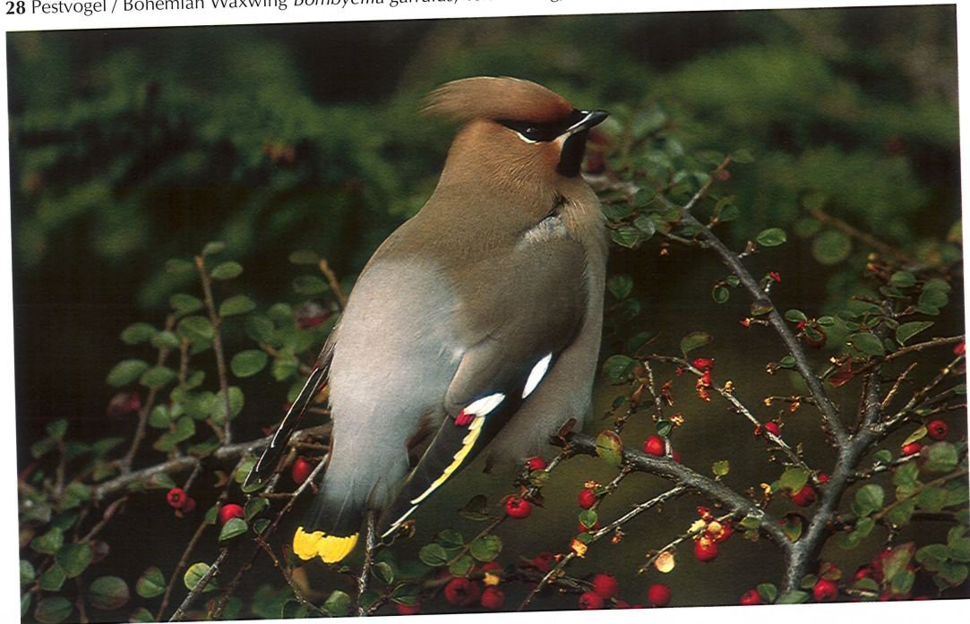
28 Pestvogel / Bohemian Waxwing Bombycilla garrulus , Terschelling, Friesland, 15 november 1994