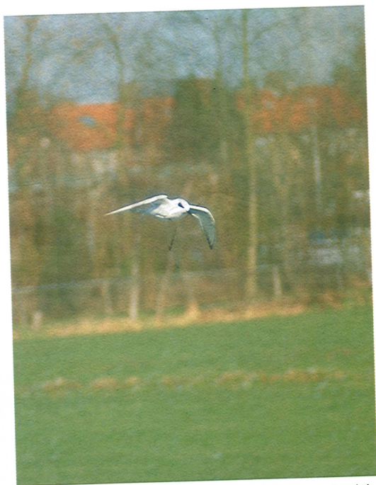
26 Forsters Stern / Forster's Tern Sterna forsteri , Kinderdijk, Zuidholland, 5 januari 1995