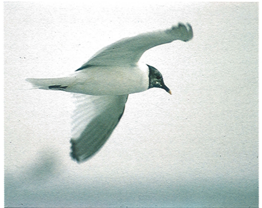
12 Vorkstaartmeeuw / Sabine's Gull Larus sabini , Eemshaven, Groningen, 23 september 1990