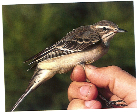
1 Yellow Wagtail Motacilla flava , first-winter female with uniformly coloured upperparts, Ebro Delta, Spain, 5 September 1991 ( Gabriel Gargallo ). Note conspicuous whitish tips to unmoulted greater coverts 2 Yellow Wagtail Motacilla flava , first-winter female possibly belonging to subspecies M f flavissima , Ebro Delta, Spain, 12 September 1992 ( Raül Aymí ). Note distinct supercilium and extremely pale ear-coverts and lores, upperparts with sandy tones and underparts with creamy suffusion 3 Yellow Wagtail Motacilla flava , first-winter female with no trace of supercilium, Ebro Delta, Spain, 18 September 1992 ( Raül Aymí ). Note bicoloured upperparts with brownish crown, nape, scapulars and back and grey rump and uppertail-coverts 4 Yellow Wagtail Motacilla flava , first-winter female resembling subspecies M f flava , Ebro Delta, Spain, 5 September 1991 ( Gabriel Gargallo ). Note distinct supercilium and relatively pale ear-coverts

lower mandible was usually paler grey or sometimes pinkish near the base, although in some individuals it was almost uniformly black.