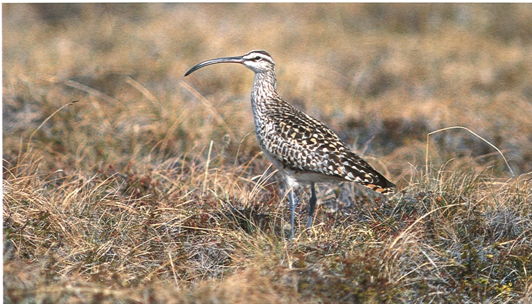
19 Bristle-thighed Curlew / Zuidzeewulp Numenius tahitiensis , Nome, Alaska, USA, June 1991 (Arnold W J Meijer)

After breeding, this curlew shows a very odd migration route. Instead of migrating southwards along the coast or across the interior, like most Nearctic waders, birds gather in flocks on the coast of western Alaska and then head straight out to cross the Pacific Ocean to their wintering grounds on (often tiny) islands in the Pacific. The normal wintering range extends from Caroline Island south and east to Fiji and through Eastern Polynesia to Pitcairn and Ducie Island (Hayman et al 1986). During migration, they also occur in Hawaii and on the Marquesas Islands. On their wintering grounds, the curlews mainly feed on