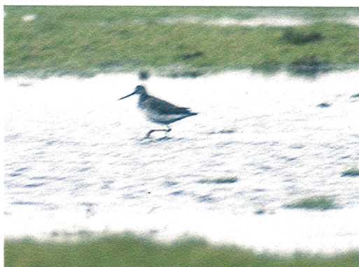
29 Witkopgors / Pine Bunting Emberiza leucocephalos , mannetje, Bloemendaal, Noordholland, 4 november 1994 (Jan de Bruin/VRS Cornelis van Lennep) 30 Kleine Topper / Lesser Scaup Aythya affinis , Veere, Zeeland, 11 december 1994 (Arnoud B van den Berg) 31 Siberische Taling / Baikal Teal Anas formosa , mannetje, Broekhuizen, Limburg, 27 december 1994 (Arnoud B van den Berg) 32 Grote Geelpootruiter / Greater Yellowlegs Tringa melanoleuca , Grijpskerke, Zeeland, 15 januari 1994 (Koen Kuypers) 33 Grote Geelpootruiter / Greater Yellowlegs Tringa melanoleuca , Zeebrugge, Westvlaanderen, november 1994 (Bernard De Langhe)