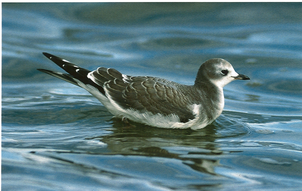
10 Vorkstaartmeeuw / Sabine's Gull Larus sabini, Oostvaardersdijk, Flevoland, september 1990