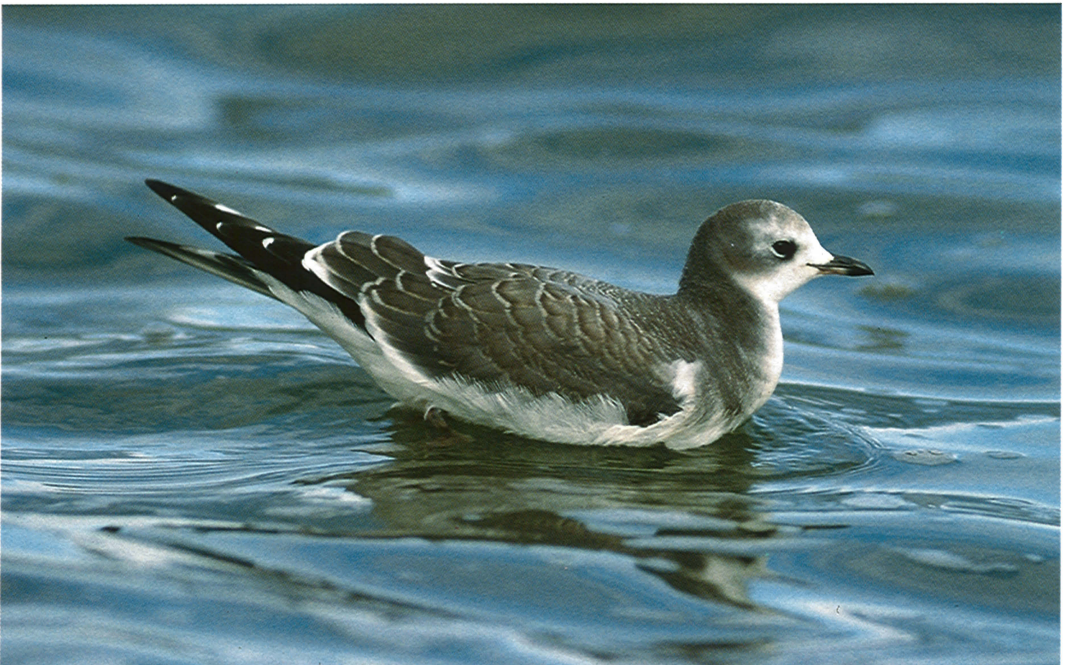
10 Vorkstaartmeeuw / Sabine's Gull Larus sabini, Oostvaardersdijk, Flevoland, september 1990