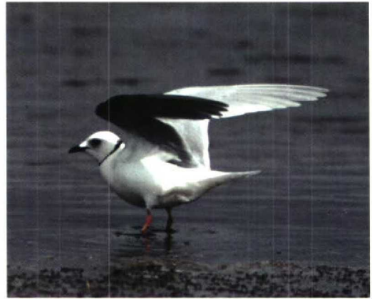
144 Bulwer's Petrel / Bulwers Stormvogel Bulweria bulwerii , Maasvlakte, Zuidholland, Netherlands, 21 August 1995 (Bernd de Bruijn) 145 Ross's Gull / Ross' Meeuw Rhodostethia rosea , Greatham Creek, Teesside, Cleveland, England, June 1995 (Robin Chittenden) 146 Least Sandpiper / Kleinste Strandloper Calidris minutilla , Sidlesham, West Sussex, England, July 1995 (Dave Stewart)