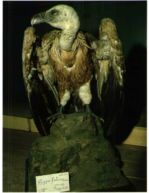
117 Vale Gier / Griffon Vulture Gyps fulvus , Wommels, Friesland, 31 juli 1975 (mevr Faber) 118 Vale Gier / Griffon Vulture Gyps fulvus fulvus (verzameld te Twijzel, Friesland, juni 1930), Nationaal Natuurhistorisch Museum, Leiden, Zuidholland, april 1983 (Arnoud B van den Berg) 119 Vale Gier / Griffon Vulture Gyps fulvus (verzameld te Schijndel, Noordbrabant, 4 oktober 1944), Milieu Educatie Centrum, Eindhoven, Noordbrabant, 11 augustus 1995 (Enno B Ebels)