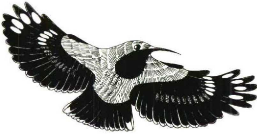
FIGURE 3 Wallcreeper Tichodroma muraria , male in flight from below (Miroslav Saniga). Note two white elliptical spots on p2-5, one white proximal spot on p6 and rusty spots (shaded) on p7-10 and s1-6