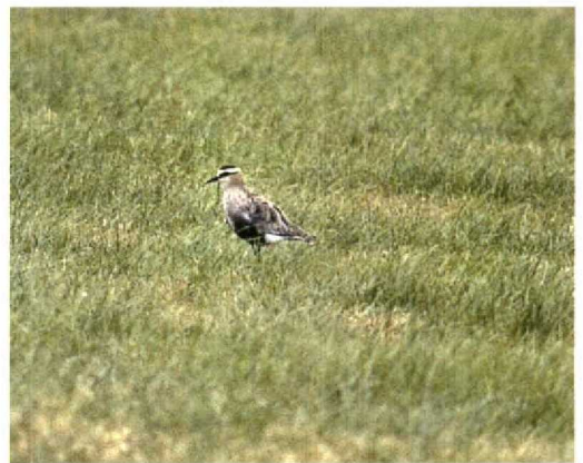
147-148 Dwergarend / Booted Eagle Hieraetus pennatus , donker vorm, Hoge Veluwe, Gelderland, 13 juli 1995 149 Kreeklzanger / River Warbler Locustella fluviatilis , Groningen, Groningen, juli 1995 150 Kuifkoekoek / Great Spotted Cuckoo Clamator glandarius , Schiermonnikoog, Friesland, 28 juli 1995 151 Grote Franjepoot / Wilson's Phalarope Phalaropus tricolor , Wevers Inlaag, Zeeland, 24 juni 1995 152 Steppekievit / Sociable Lapwing Chettusia gregaria , Kamerik, Utrecht, juli 1995