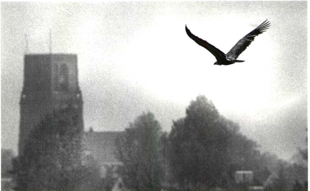
113 Vale Gier / Griffon Vulture Gyps fulvus fulvus , 'A1', zeven jaar oud mannetje, Durgerdam, Noordholland, 29 april 1993

In de zomermaanden trekken vooral jonge vogels van deze kolonies c 250 km in noordwestelijke richting naar de Oostenrijkse Alpen, waar in die periode kudde schapen naar de hogere bergweiden worden gevoerd. Een vrij kleine populatie Vale Gieren bestrijkt hier de noord- en zuidoorden van de 3000 m hoge bergkam de Hohe Tauern, c 100 km ten zuiden van Salzburg. Een traditionele roestplaats bevindt zich in het Rauristal, waar sinds 1979 een voederplaats voor gieren is ingericht, omdat het aantal overzomerende vogels vanwege de afnemende schapenbe-