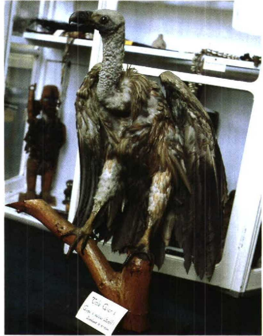
114 Vale Gier / Griffon Vulture Gyps fulvus fulvus , 'A1', juveniel mannetje, Udine, Italië, 2 september 1987 ( Fulvio Genero ) 115 Vale Gier / Griffon Vulture Gyps fulvus (verzameld te Dinteloord, Noordbrabant, 10 juni 1904), Instituut St Louis, Oudenbosch, Noordbrabant, november 1985 ( Edward J van IJendoorn ) 116 Vale Gier / Griffon Vulture Gyps fulvus fulvus , 'A1', zeven jaar oud mannetje, Durgerdam, Noordholland, april 1993 ( Marten van Dijk )